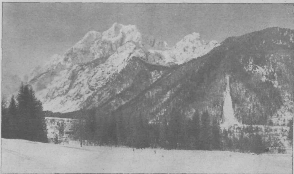
Naša znamenita skakalnica v Planici, kjer bodo prihodnji mesec tekmovali v „smuških poletih“. — V ozadju Ponce

(Glej Poličko športnega strička, str. 137.)