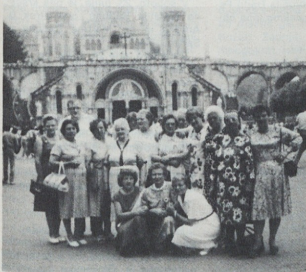
Slovensko roma-nje v Lurd od 12. do 18. julija 1983.