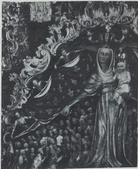
Znameniti kamniti relief z Marijo in mnogimi drugimi zgodovinskimi osebam na PTUJSKI GORI.

„Ti si me prisilil, da te ne bom imenovala do smrti, prislegla sem ti in držala črno prisego,“ reče tvoja mati, „dasi me je veliko stalo. In zdaj bi rad še zadnjo? Ne boš je imel ne, nikdar ti ne bo dal pisanja v roke drug kot on, ki te ga je sram. Vsaj po moji smrti naj ve, kakšnega očeta ima. Le daj ga v vojake, krokar! Potlej