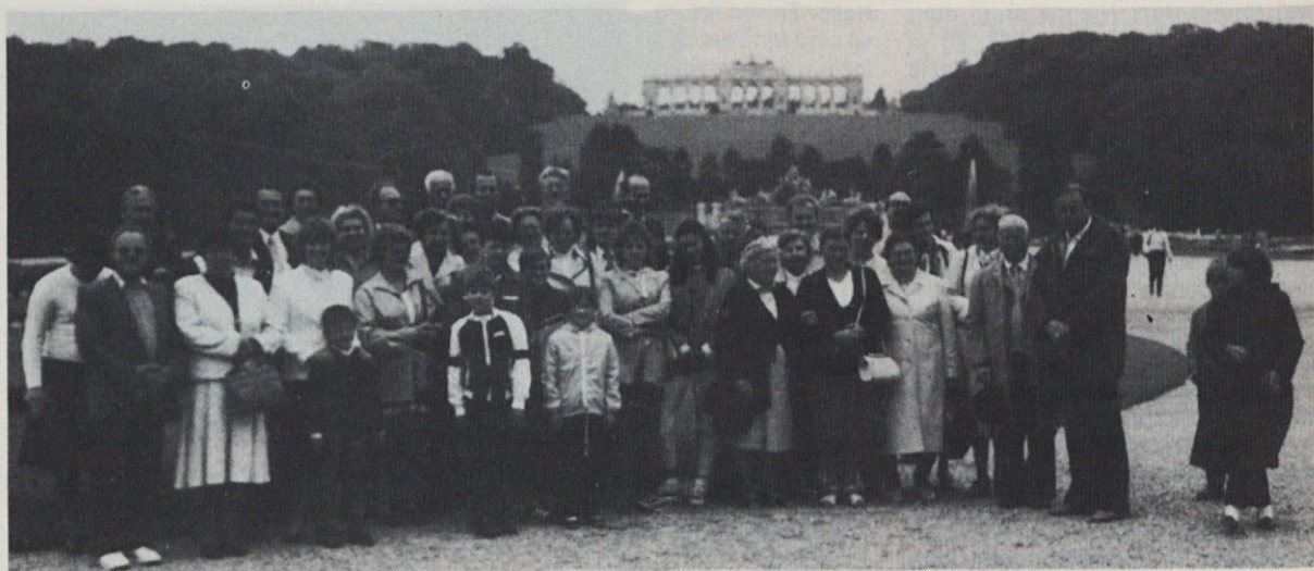
Skupina münchenkih Slovencev na Dunaju v parku z gradom Schönbrunn.