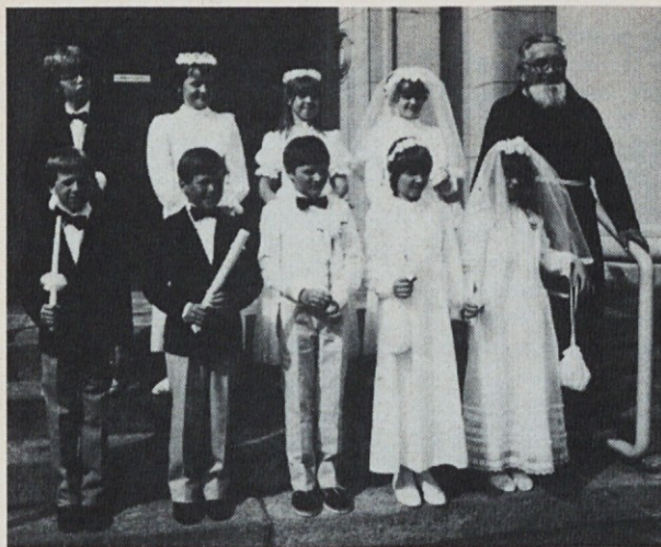
Letošnji prvoobhajanci v Zürichu

jajo tudi na božjo pot, saj je tudi ves smisel, pomen in namen vsakega romanja poživljanje in utrjevanje zvestobe na življenjski poti.