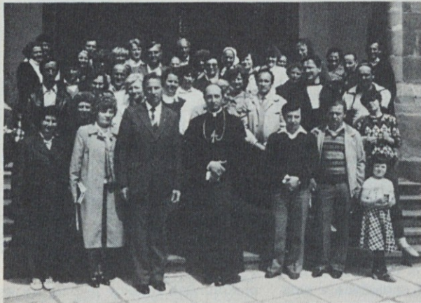
Slovo od Ptujске gore