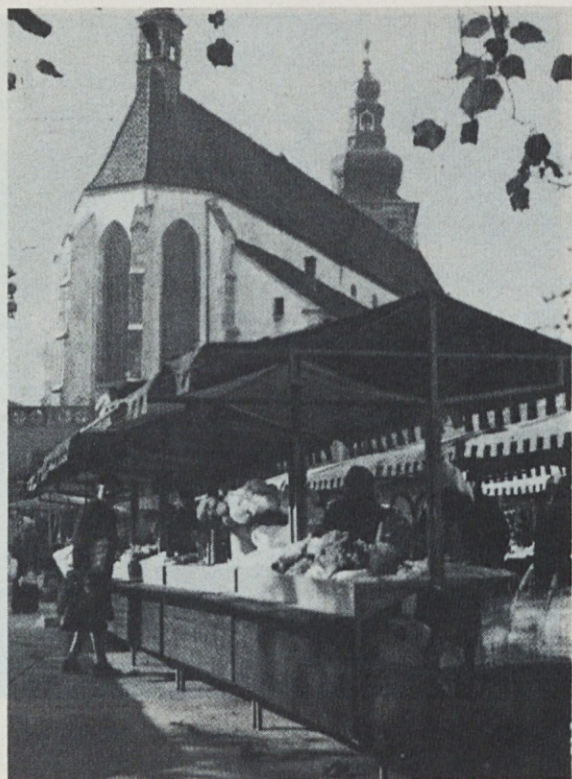
PTUJSKA PROŠTIJSKA CERKEV je bila pre-delana iz romanske v gotsko.

„Hoj, slišiš, Domen! Ne stoj tamkaj! Že prej sem ti hotel povedati, če čakaš Sovo, ga ne boš pričakal; že pred poldnem je bil doma, po drugi poti je šel, ne čez goro!“