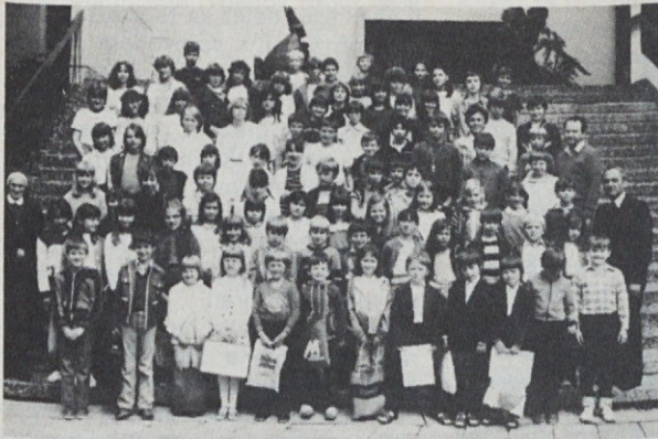
Ob zaključku šolskega leta na Sobotni šoli v Stuttgartu 18. junija je 98 šolarjev dobilo spričevala.