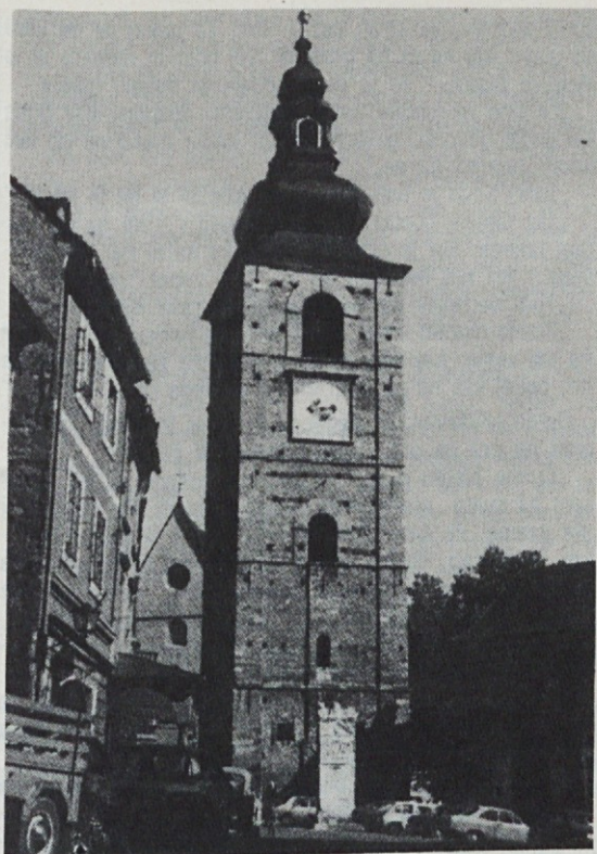
Zvonik srednjeveške proštiješke cerkve v PTUJU.

„Tukajle je eno, ki je na njem podpisan graščak,“ re-