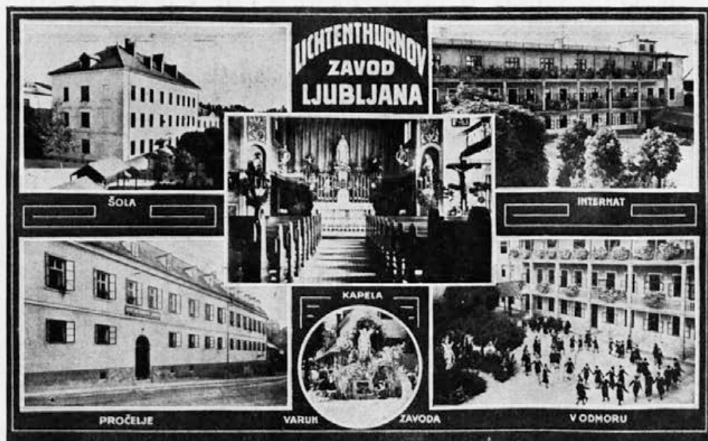
Lichtenethurn, Ljubljana, Ambrožev trg Ustanovljen l. 1878.

„Dajte mi dobrih mater in preobrazim vam ves svet.“