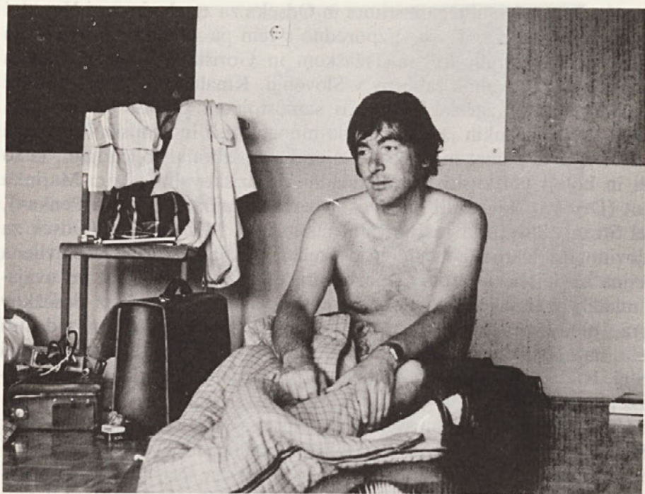
Kako bi človek še spal (Podzemelj, julija 1985)