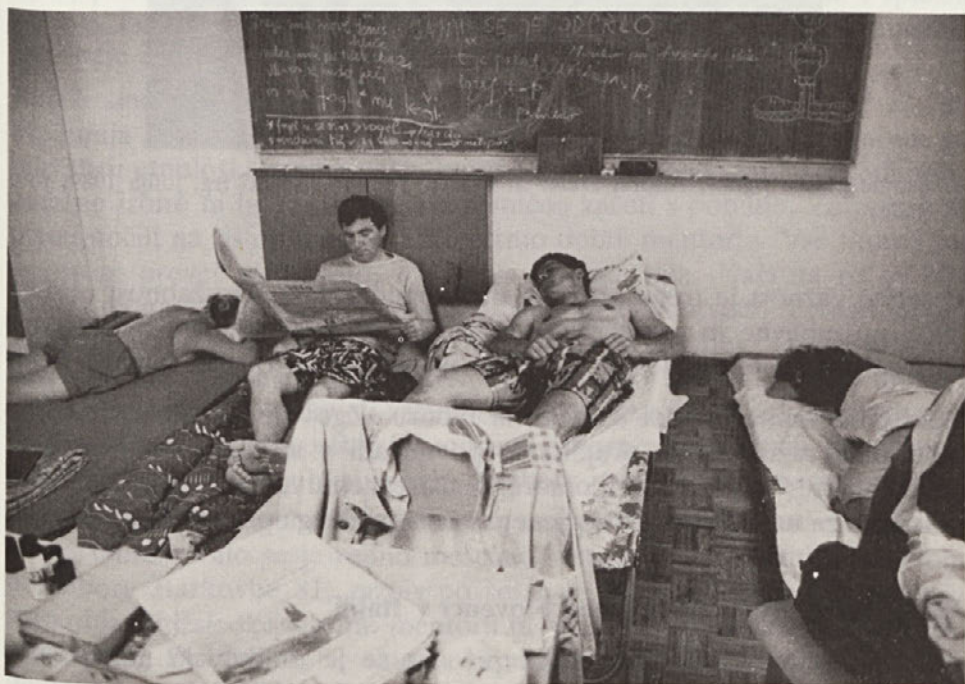
Utrujeni mentorji (Stari trg, julija 1989)