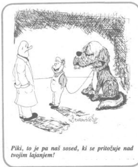
Piki, to je pa naš sosed, ki se pritožuje nad tvojim lajanjem!

GLASILO OK SZDL LJUBLJANA VIČ-RUDNIK - UREJATA IZDAJATELJSKI SVET (PREDSIEDNIK dr. DESAN JUSTIN) IN UREDNIŠKI ODBOR - ALOJZ DOLNIČAR, STANE DROLJČ, JANJA DOMITROVIČ (GLAVNA IN ODGOVORNA UREDNICA), MIRO PETJE, BOJAN SIMONIČ. TEHNIČNI UREDNIK IVAN ŽITKO - UREDNIŠTVO NAŠE KOMUNE - LJUBLJANA TRG MDB 14 - TELEFON 221-191 ali 221-188 - TEKOČI RAČUN SDK: 50101-678-51168 - ROKOPISOV IN FOTOGRAFIJ NE VRAČAMO - TISK ČGP DELO, LJUBLJANA - GLASILO PREJEMAJO VSA GOSPODINSTVA V OBČINI BREZPLAČNO - GLASILO NAŠA KOMUNA IZHAJA ŠTIRINAJSTDEKOVNO V NAKLADI 26.000 IZVODOV