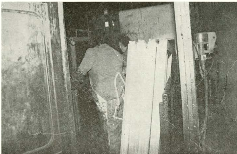
Tu so v glavnem zaposlene ženske

bila prisotna. Ko se je na tem področju pojavil problem, je OOS organizirala prevoz delavcev popoldanske izmene s kombijem. Trenutno je avto v popravilu in bo v čimkrajšem času zopet vozen.