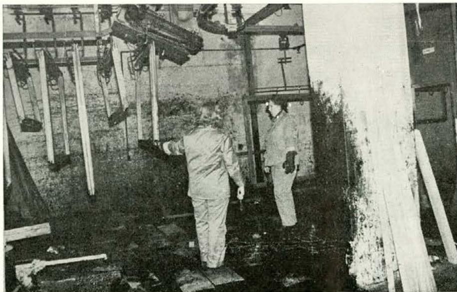
Pri delu v lakirnici nastajajo škodljivi plini

Odg. O rezultatih poslovanja smo bili vedno dobro obveščeni. K izboljšanju poslovanja smo največkrat pripomogli s svojim delom ob prostih sobotah, velikokrat pa smo organizirali udarniške delovne akcije.