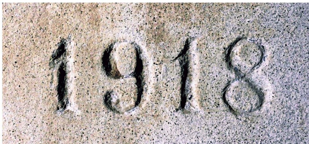
Stanovanjska hiša je dobila prizidek leta 1918.