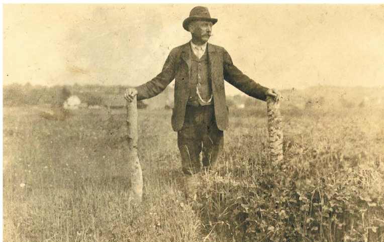
Skromna zemlja in temu primerni pridelki so se z uporabo umetnih gnojil bistveno spremenili.

Skromna zemlja in temu primerni pridelki so se z uporabo umetnih gnojil bistveno spremenili. Kot napreden kmet je izvajal poizkuse z različnimi gnojili in jih predstavljal stroki ter krajanom od blizu in daleč. Posebej veličastno in slovesno je bilo na velikem shodu ob domačiji v Vičancih.