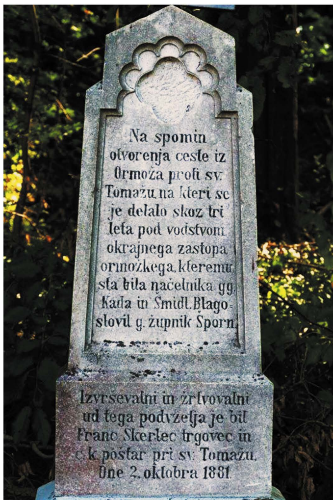
Znamenje ob cesti v vasi Dobrava.