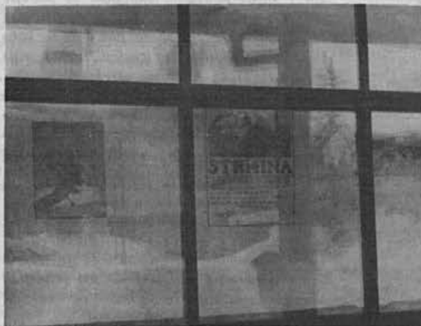
V spomin in opomin vsem, ki (ni)so sodelovali...

Navsezadnje, ko delamo prvi korak, moramo vsaj približno vedeti, kam bi radi prišli po petih korakih. Pa četudi bomo potem začeli delati predore do sosednjih krajev... Najdebelejši »kitajski zid« lahko zgradimo v sebi – posledica pa so živi primeri iz pretekle žirovske zgodovine, ko bi bili lahko petnajst let pred drugimi – pa smo zaradi samovšečnosti ključnih ljudi – petnajst let zaostali.