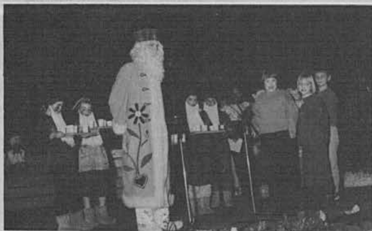
Spremlstvo dedka Mraza in veliko veselje sodelujočih