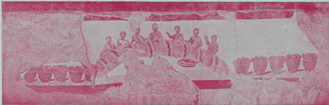
Prizor obeda (evharističnega).

V katakombah Kalista, konec II. stoletja.