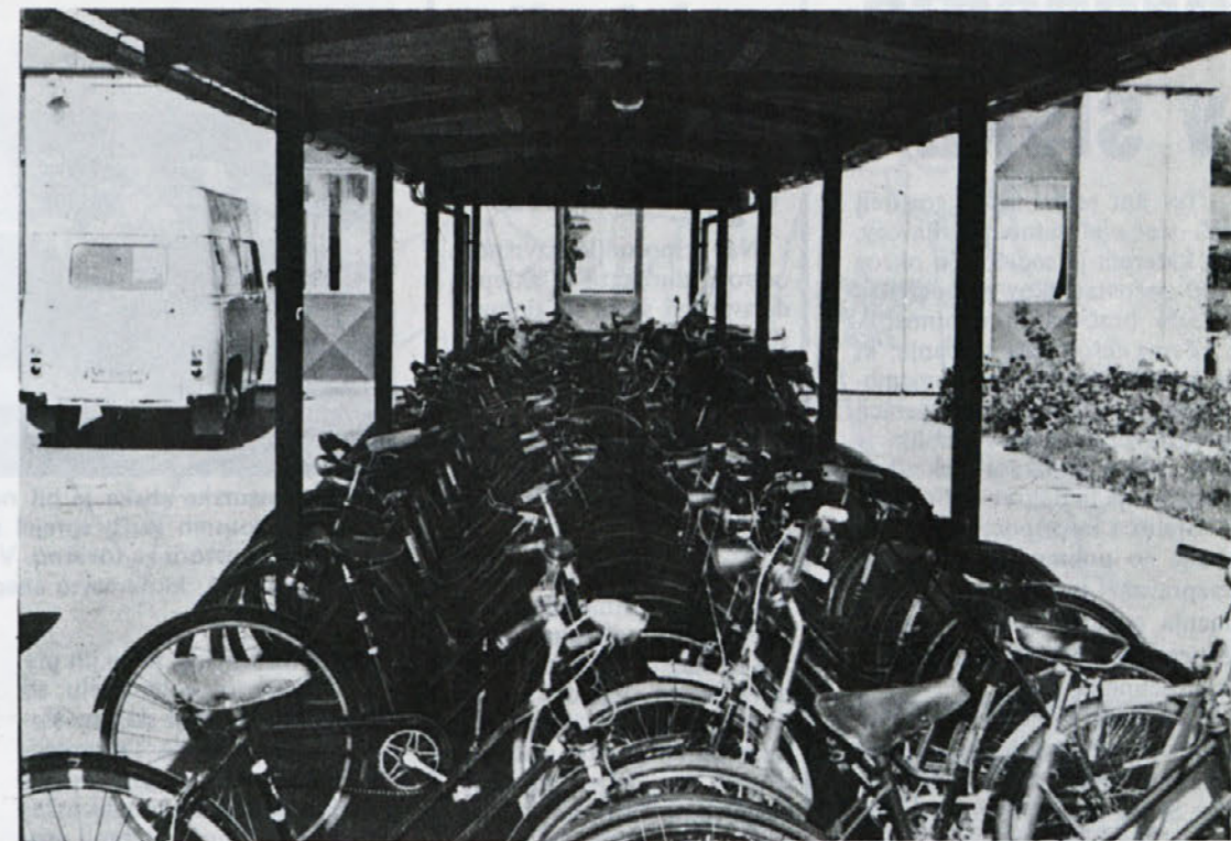
Pogled na vzorno urejen parkirni prostor „avtomobilov“ delavk TOZD Delta Ptuj.

Delavska samoupravna kontrola v delovni skupnosti skupnih služb je obvestila člane delovne skupnosti o svoji prvi seji. Vprašali smo se, če bo kaj sprememb v delu tega organa. Druga seja, ki je bila 3. 11. 76, kaže, da se bo na tem področju nekaj premaknilo.