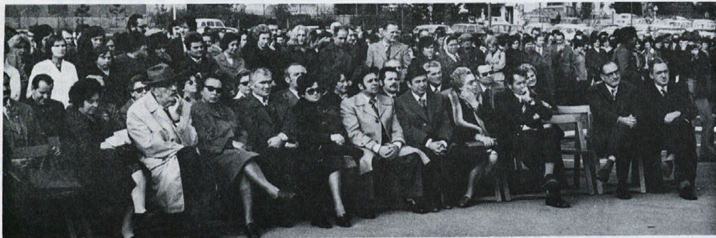
Takole smo se zbrali ob odprtju naše nove zdravstvene postaje