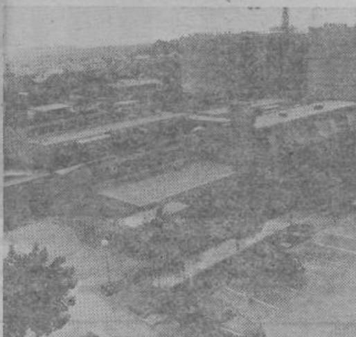
Sadovi samoprispevka II