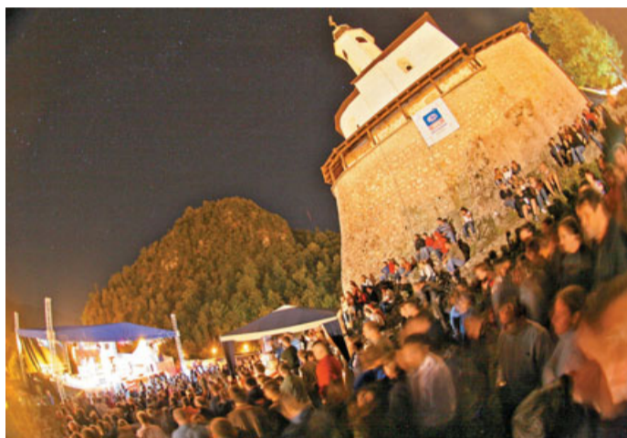
Eden največjih projektov Kulturnega društva Priden možic je poletni kulturni festival Kamfest, ki je v letu 2013 doživel jubilejno deseto izvedbo.

Kulturno društvo Priden možic je bilo ustanovljeno leta 1996. Od takrat dalje je opozarjalo nase in na aktualne lokalne probleme z različnimi akcijami, pollegalnimi predstavami v takrat nedelujočem kino domu in redno televizijsko oddajo na lokalni kabelski televiziji Impulz. Hkrati so člani društva delovali v Ljubljani, na Gledališki in lutkovni šoli Kozmopolitske delavnice umetnosti, v Impro ligi in prebujajočem se uličnem gledališču. Vse to je vodilo do povezovanja s takratno Agencijo za razvoj turizma in podjetništva v občini Kamnik, Občino Kamnik, Zvezo kulturnih organizacij Kamnik, Medobčinskimi muzejem Kamnik in Matično knjižnico Kamnik. Povezovanje z najrazličnejšimi organizacijami je ostalo ena glavnih značilnosti delovanja društva do danes.