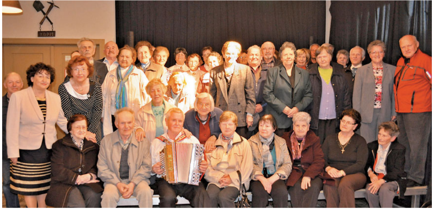
Del udeležencev Občnega zbora DIS KO Kamnik.