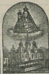
C. Brady Schutzmarke.

sind in rothen Faltschachteln verpackt und mit dem Bildnisse der heil. Mutter Gottes von Mariazell (als Schutzmarke) versehen. Unter der Schutzmarke muss sich die neben- stehende Unterschrift C. Brady befinden. — Bestandtheile sind angegeben.