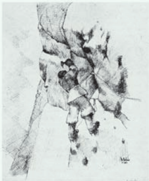
PV 1947, str. 69: Plezalec v sneženi steni ✎ Marjan Keršič-Belač

Macesnovca z vrisano smerjo zimskega vzpona je bila začetek njegovega dolgoletnega sodelovanja v Planinskem vestniku. Njegove perorisbe sten in vrhov s smermi vzponov, tehnične risbe, vinjete, zemljevidi in zapisi domačih imen pričajo o izredno dejavni osebnosti, tesno povezani z gorami. Odlikuje jih čista, precizna, mehka linija šolanega arhitekta. In seveda poznavanje gora »iz prve roke«. Aktiven je še danes, pri dva- indevetdesetih letih!