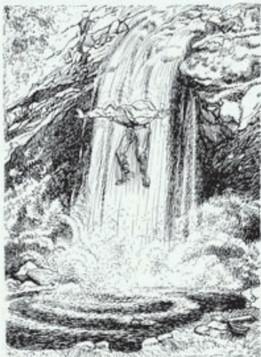
PV 1933, str. 157: Mladi Tuma se po slapu drsa v tolmun.

Pa to še ni bilo vse. Dr. Henrik Tuma je opisal svoja mlada leta v gorah (Turistika izza mladih let) in tedanji urednik je za duhovito pripoved s pravim poslušom pridobil Hinka Smrekarja, znamenitega karikaturista (leta 1942 so