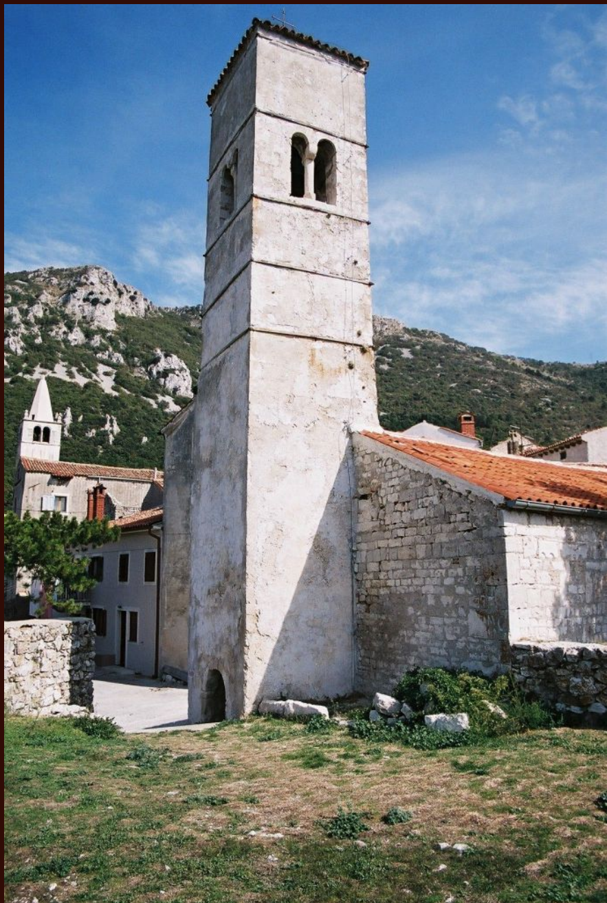
Plomin, crkva Sv. Jurja prije početka obnove 2003. godine