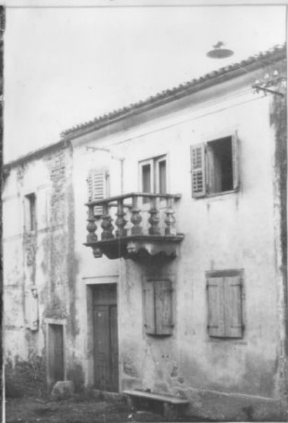
kuća br.36 u ul.M.Gorkog

Popis spomenika kulture za mjesto Oprtalj, Konzervatorski zavod Rijeka, 1963., dio popratnih ilustracija