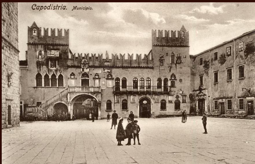
Palazzo Pretorio a Capodistria