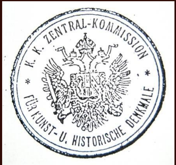
Timbro dell'i.r. Commissione centrale per la ricerca e la tutela dei beni culturali