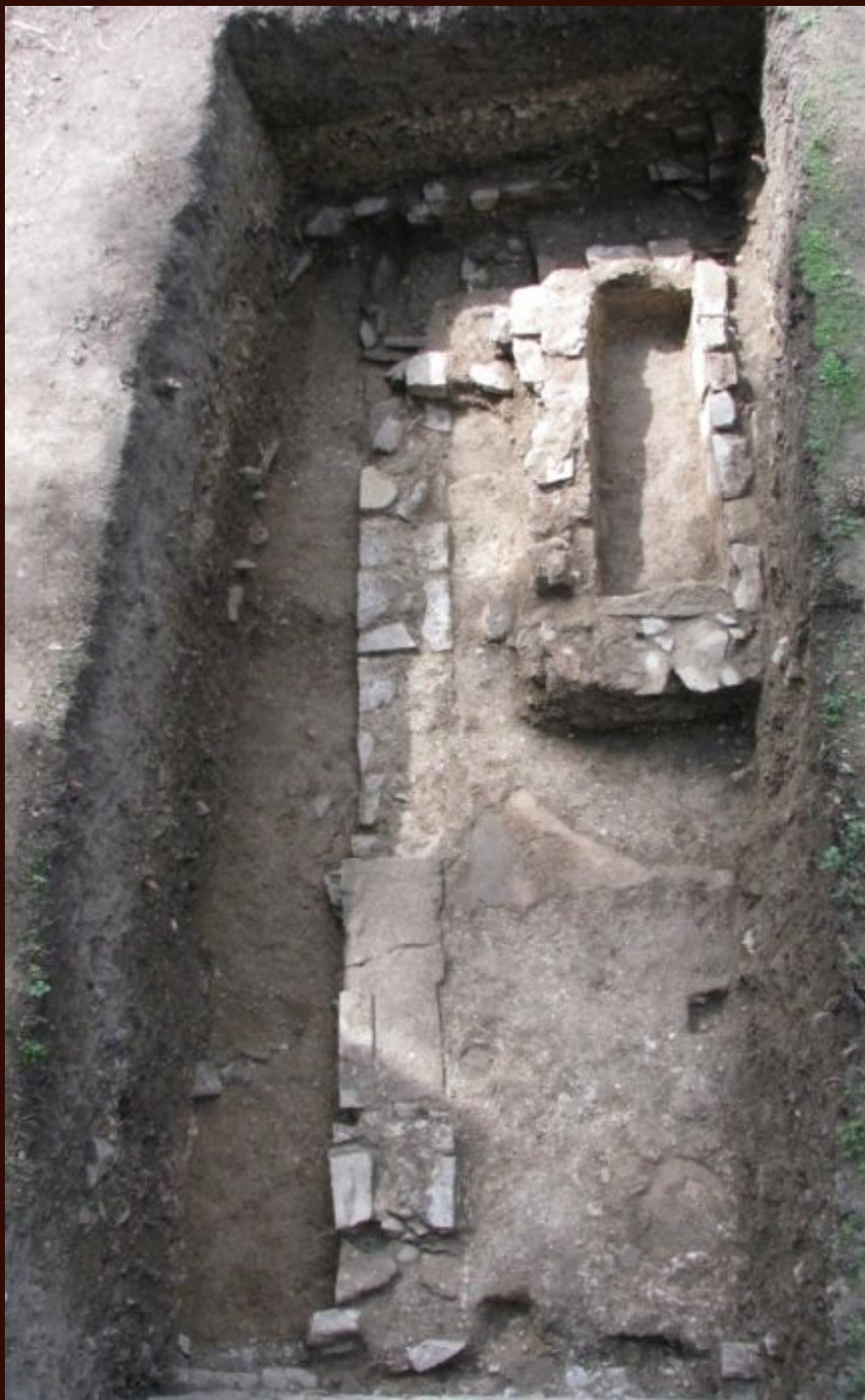
Koper, Servitski samostan, sonda 3: ostanki rimske arhitekture (zid s preklado ter fragmenti črno-belega mozaika) pod srednjeveškim grobom