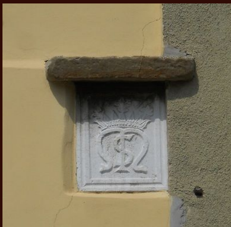
Koper, Servitski samostan, kamnita plošča na pročelju stavbe