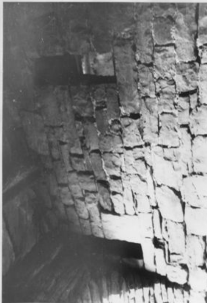
Otvari u obliku puškarnica ispod jednog natkrivenog prolaza u zapađnom dijelu naselja