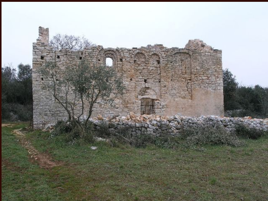
Rovinj, Sv. Cecilija kraj Rovinjskog sela, konzervacija ostataka crkve iz 11. stoljeća istraživane u razdoblju od 2003. do 2005. godine