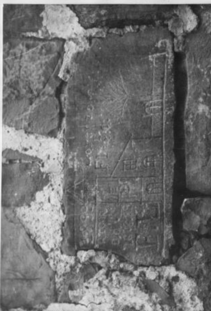
Kamena ploča sa urezenom risa- dom crkve na kući br.28 a