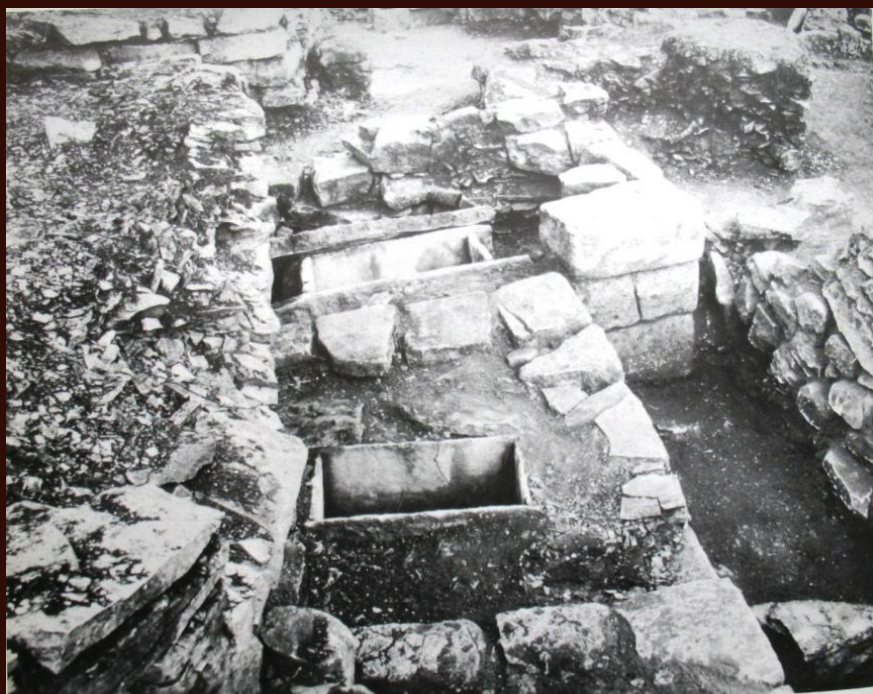
Područje zaboravljene nekropole gradine Vrčin: stanje 60-ih godina 20. stoljeća