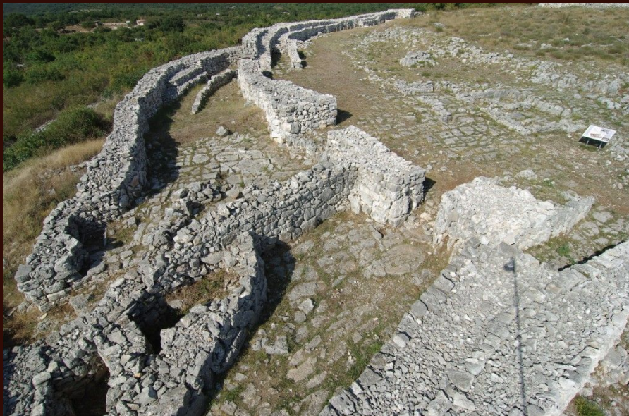
Gradina Monkodonja: područje zapadnih vrata 2009. godine