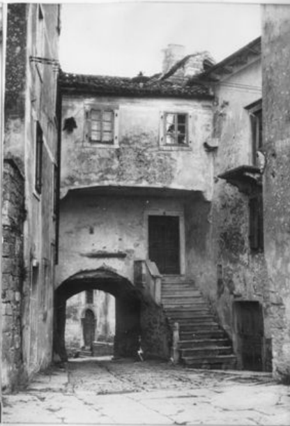
Natkriveni prolaz između kuća br.4 i 17