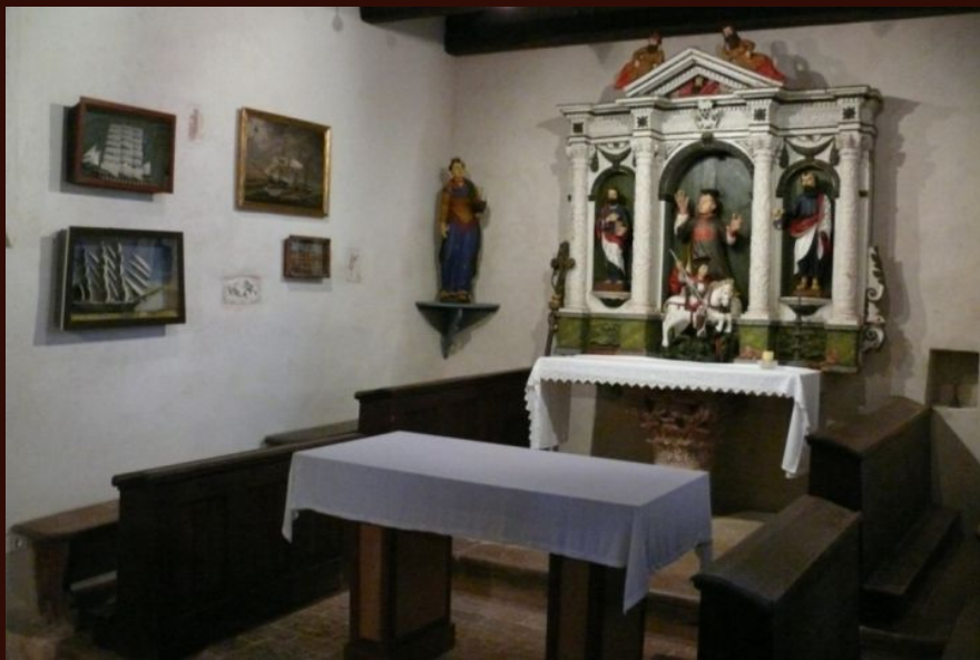
Plomin, svetište crkve Sv. Jurja nakon obnove, 2009.