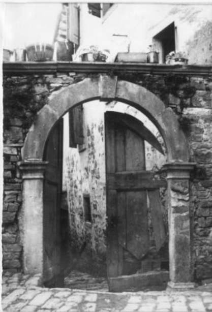
Dvorišni portal između kuća br.20 i 22 u ul.M.Gorkog