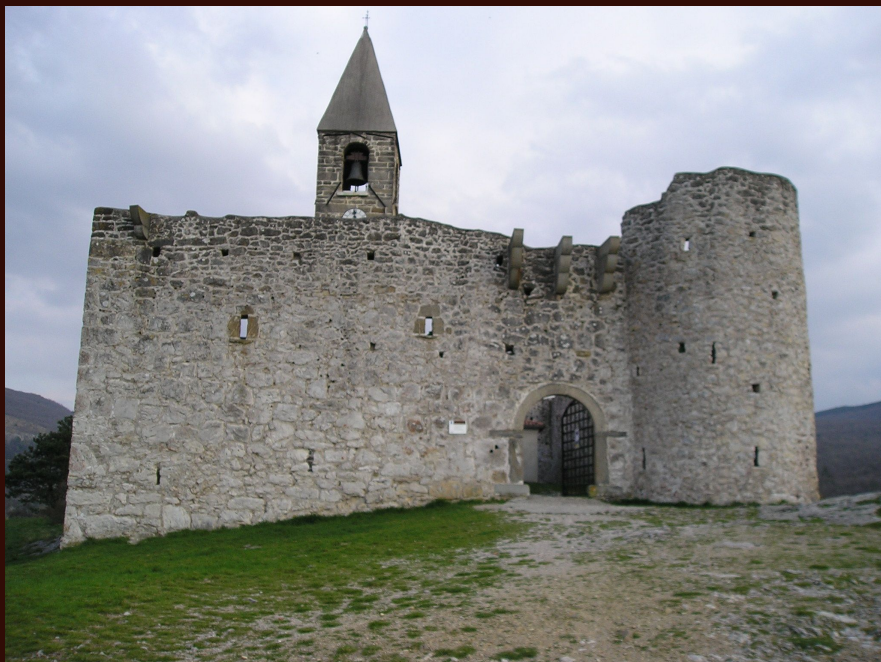
Chiesa medievale della SS. Trinità a Crastovlje (Hrastovlje)