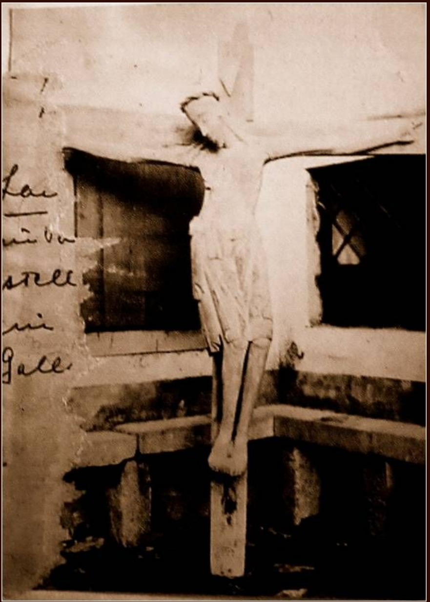
Crocefisso della chiesa parrocchiale di San Vito a Gallignana ritrovato nel 1910 in un ripostiglio da Francesco Ferdinando, allora protettore della Commissione centrale