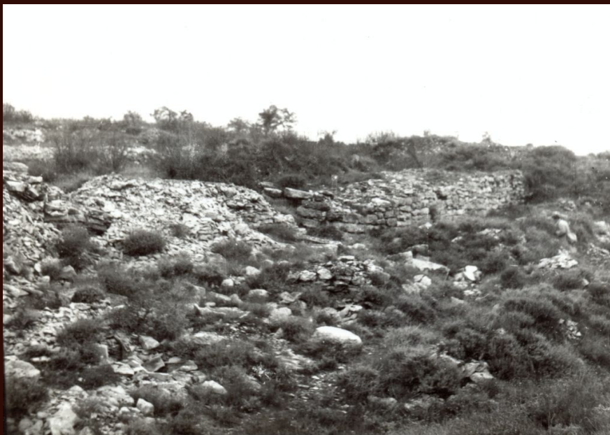
Detalj brončanodobne nekropole gradine Vrčin - Monte Orcino: stanje u tijeku iskopavanja 1925-1929