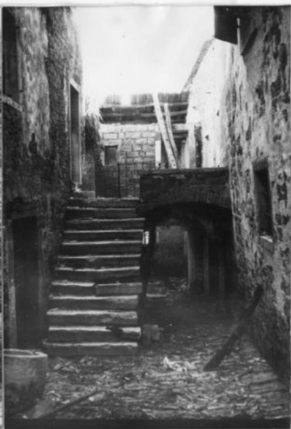
Stepenište između kuća br.20 i 22 u ul.M.Gorkog