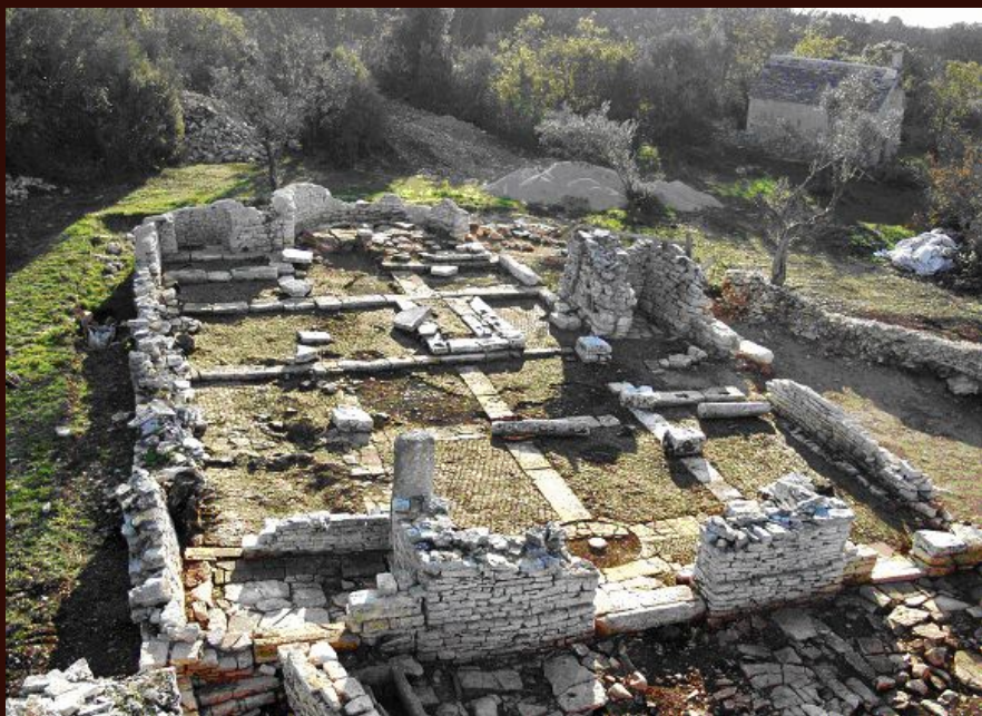
Vodnjan, Sv. Mihovil kraj Banjola, višeslojni lokalitet s ostacima sakralnih građevina nastalih u razdoblju od 6. do 15. stoljeća, istražuje se od 2006. godine