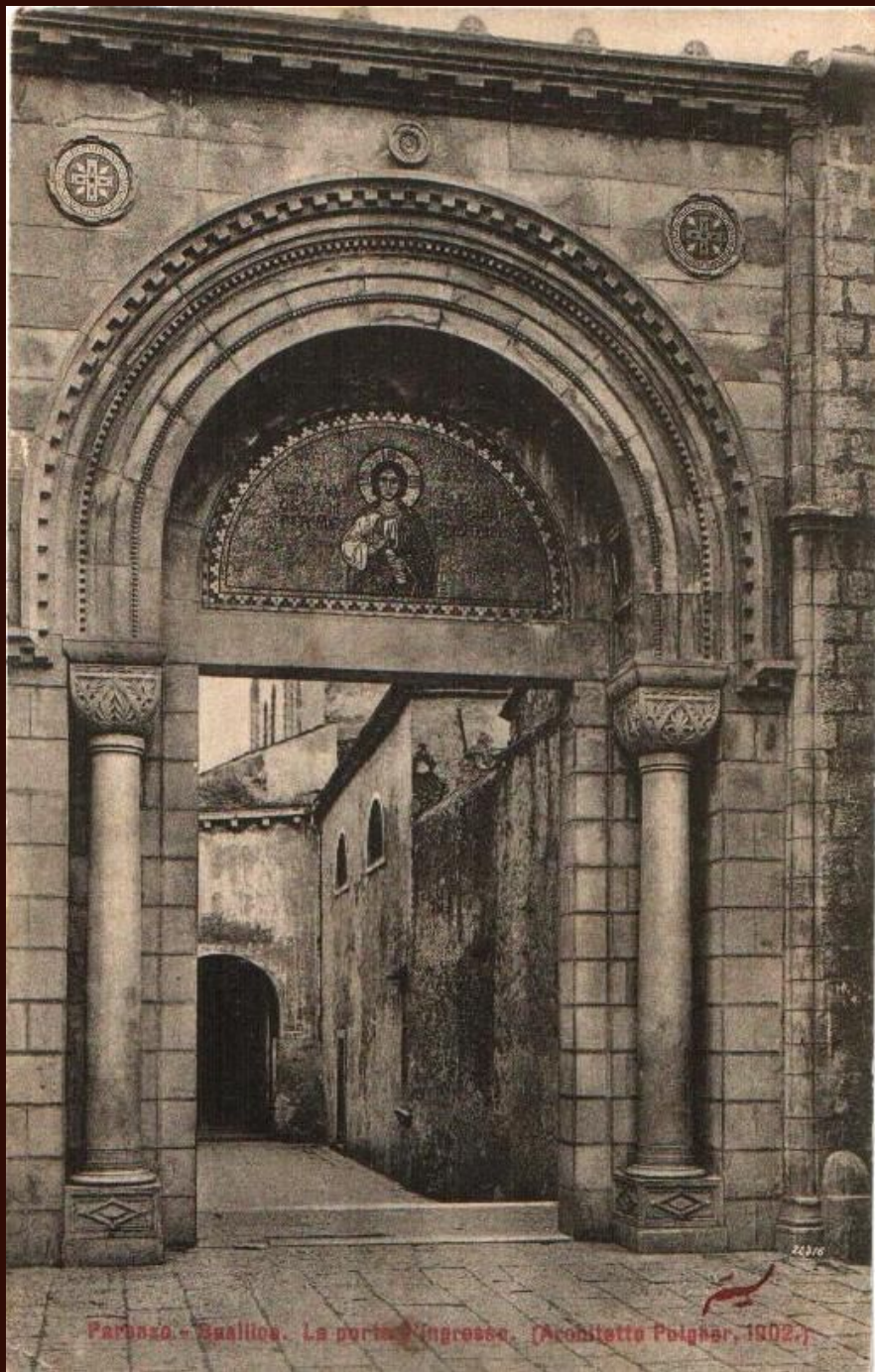
Paronzo - Spallio. La porta d'ingresso. (Architetto Poignar, 1902.)

Novi portal Eufrazijane, foto Zaviičajni muzej Poreštine - Museo del Territorio parentino