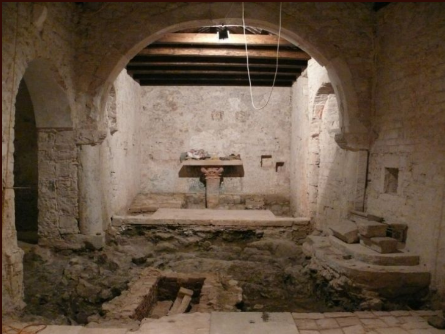
Plomin, crkva Sv. Jurja tijekom istraživanja, svetište 2006. godine, foto Nataša Nefat