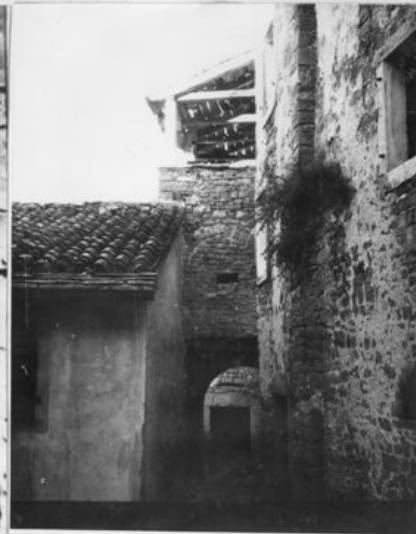
Natkriveni prolaz u zapađnom dijelu naselja

Popis spomenika kulture za mjesto Oprtalj, Konzervatorski zavod Rijeka, 1963., dio popratnih ilustracija