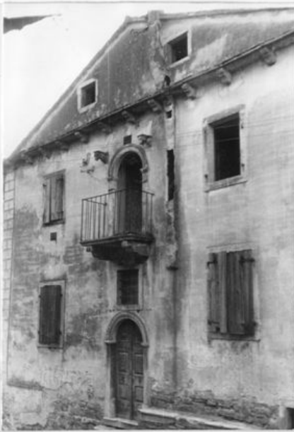
Kuća br.7 u ul.M.Gorkog-renesansa