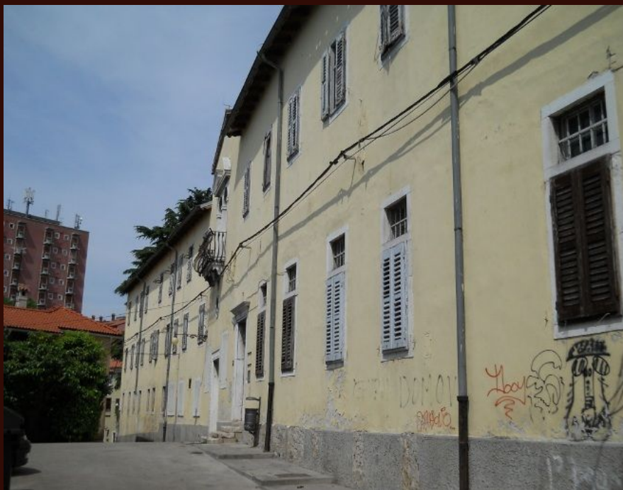
Koper, Servitski samostan, pročelje

Strokovno vodstvo / Guida esperta / Stručno vodstvo: Katharina Zanier, Neža Čebren Lipovec