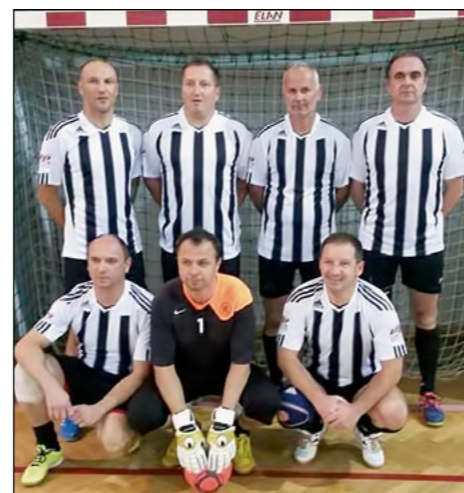
4. mesto: Draženci – veterani