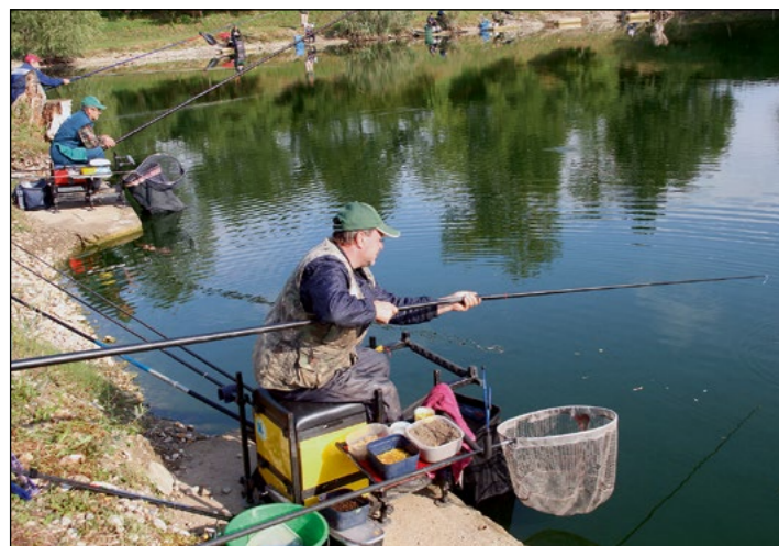
Ribiči iz občine Hajdina so 3. oktobra zasedli najboljša mesta ob draženskem ribniku.