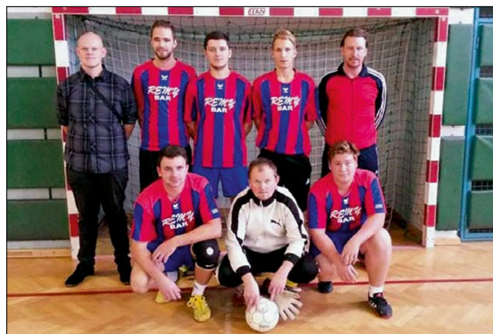
6. mesto: Slovenja vas – člani