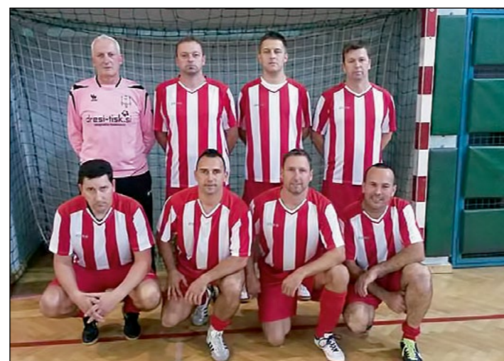
2. mesto: Hajdoše – veterani