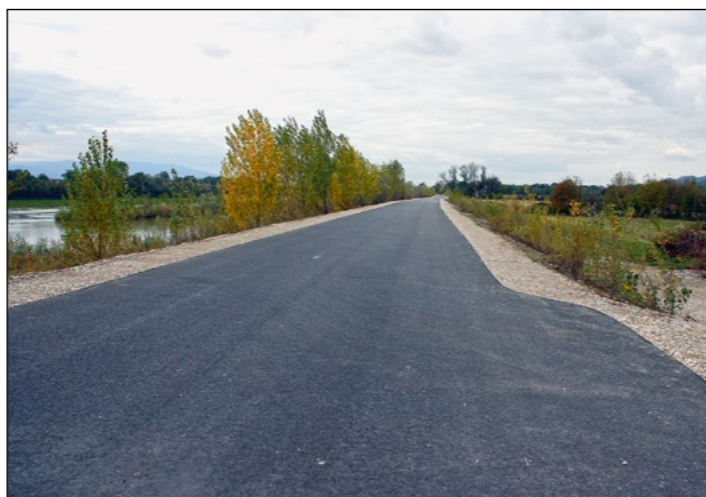
Asfaltno obleko je dobila tudi cesta preko kanala med Slovenjo vasjo in Hajdošami.