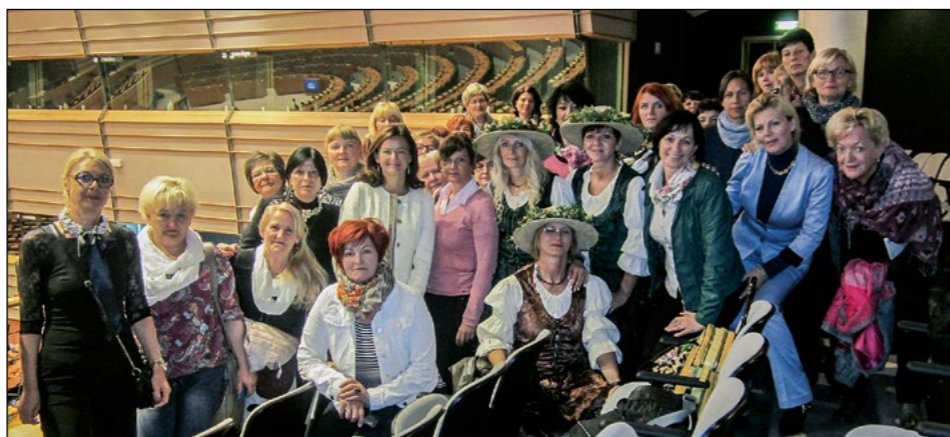
V družbi evropske poslanke Tanje Fajon v dvorani evropskega parlamenta