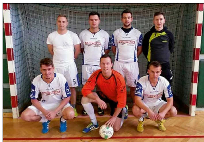
5. mesto: Draženci – člani

V počastitev letošnjega praznika Občine Hajdina sta bila v oktobru tradicionalno odigrana tudi turnirja v malem nogometu za člane in veterane. Zaradi slabega vremena sta bila spet izpeljana v telovadnici OŠ Hajdina. Kot vsako leto sta tudi letos oba postregla z zelo zanimivimi tekmami, na koncu pa vedno zmagajo najboljši.