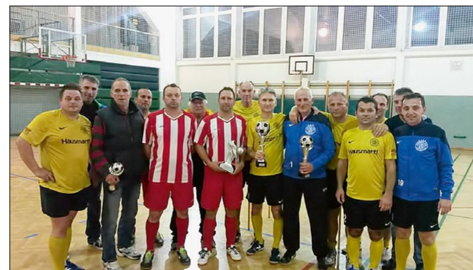
Dobitniki pokalov – veterani 2015