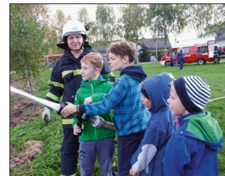
Posebej zanimivo je bilo pri »delu« opazovati najmlajše, bodoče gasilke in gasilce.

Slovenja vas so se s tem gasilskim dogodkom pridružili številnim slovenskim gasilskim društvom, mnogim prostovoljcem, ki v oktobru preverjajo operativne sposobnosti, v ospredju pa so letos imeli osrednjo temo meseca oktobra Evakuacija iz stanovanja.