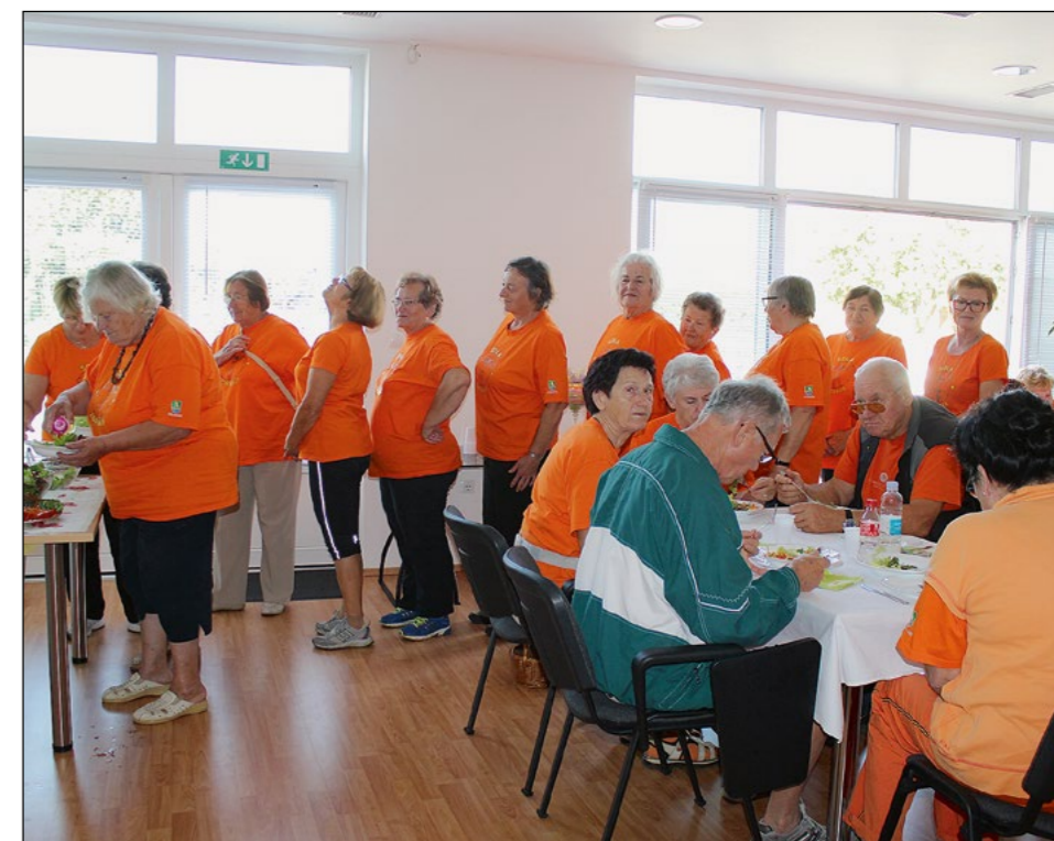
V vrsti do solatnega bifeja. Ali med čakajočimi prepoznate Hajdinčane? Poglejte na rovak leve roke.