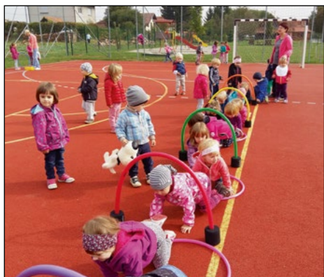
Tudi otroci vijolične igralnice smo uživali v igrah brez meja na igrišču.