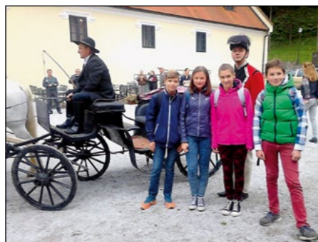
Nekoč so pošto prevažali s kočijo ...

desetič dogajala v Trakoščanu. Letos je naša pošta potovala s kočijo, tako kot je bilo v preteklosti. Ogledali smo si filatelistično razstavo in ob prijetnem kulturnem programu, dobri hrani in pečenih kostanjih preživeli prijeten dan. Zbiranje znamk je zanimiv hobi. Ob znamkah se lahko veliko naučimo o naravi, kulturi, znamenitostih, človeku, običajih ... Najlepše pa je, da se družimo s prijatelji. Vse, ki jih zbiranje pritegne še bolj, pa jih lahko popelje tudi v kraje, ki jih drugače morda nikoli ne bi obiskali. Zato vas vabimo, da se nam pri našem krožku kdaj pridružite, z nami menjate znamke ali pa če imate veliko filatelističnega znanja, to delite z nami. Krožek imamo prvi ponedeljek v mesecu od 7.30 do 8.15.