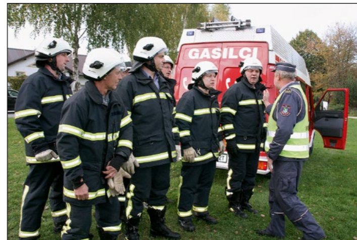
Gasilci v akciji, na kraju dogodka ...

Drugo leto zapored so člani PGD Slovenja vas v mesecu varstva pred požari posebej opozorili nase in na svoje delo. V soboto, 17. oktobra, so na stečaj odprli vrata gasilskega doma, na ogled so postavili skorajda vso gasilsko tehniko, s katero razpolagajo v primeru intervencij, posebej pa so se izkazali v gasilski intervenciji, ki so jo uprizorili za obiskovalce.