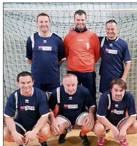
5. mesto: Veterani iz Skorbe. Pred turnirjem še dobre volje ...