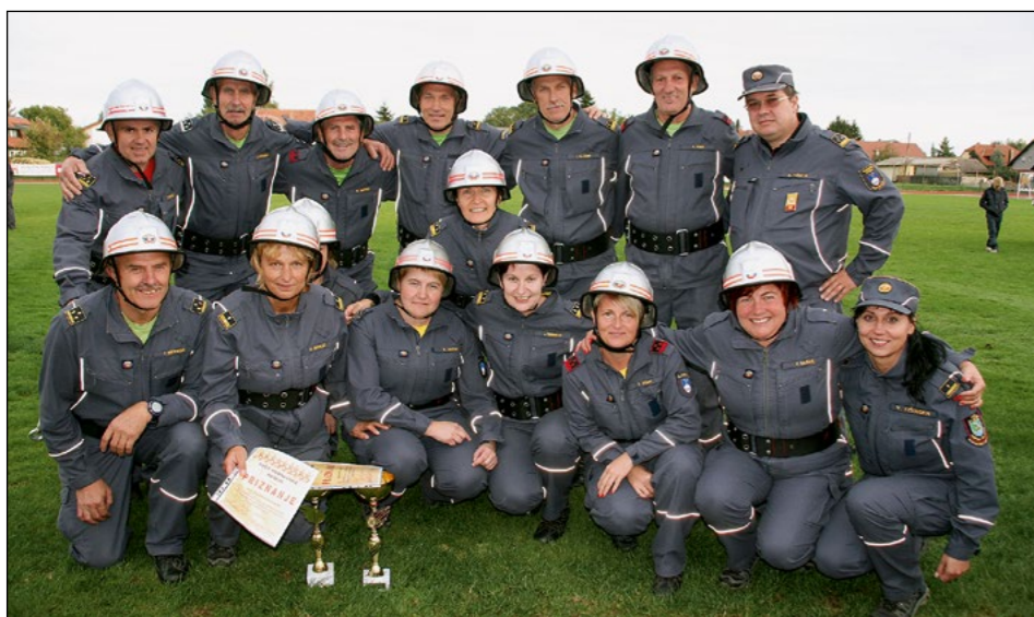
Dva nastopa in dve zmagi za člane in članice B PGD Hajdoše