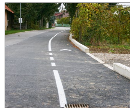
V Dražencih je urejena tudi pot za pešce in kolesarje.

Hajdinčan: Med zadnjimi v Sp. Podravju je občina Hajdina z novim letom dobila tudi svoj zbornik, za prepoznavnost občine pa so poskrbela številna društva z izvirnimi idejami in dogodki, mnogi športniki, kulturniki, gasilci in drugi. Prav gotovo ste ponosni na vsakega posebej, ki občino Hajdina dela še bolj prepoznavno in predstavlja priložnosti,