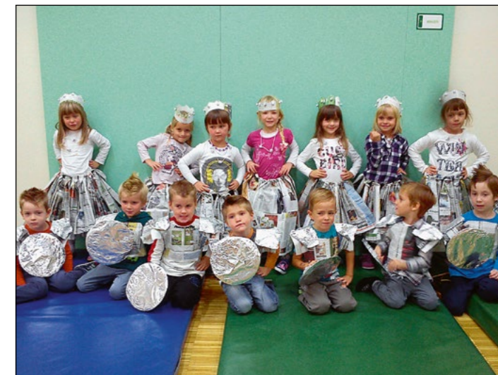
Tudi v rdeči igralnici smo si izdelali oblačila in se z njimi predstavili na modni reviji.