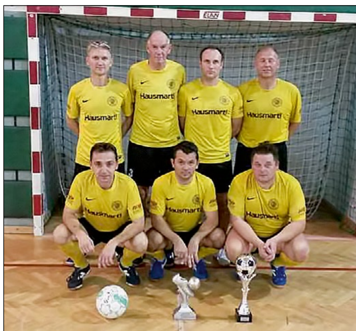
1. mesto: Hajdina – veterani