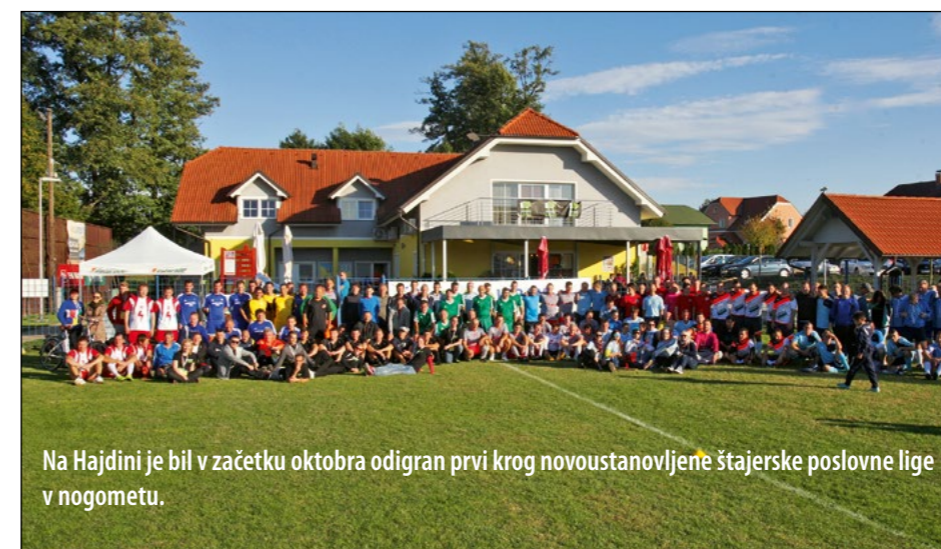
Na Hajdini je bil v začetku oktobra odigran prvi krog novoustanovljene štajerske poslovne lige v nogometu.

Ideja o poslovni nogometni ligi je na Štajerskem tlela že nekaj časa, letos pa je očitno preskočila tudi prava iskrica. Organizacije tega tekmovanja in druženja ekip iz poslovnega sveta sta se v sodelovanju z Nogometno zvezo Slovenije lotila Sport Forum in Movio, d. o. o.