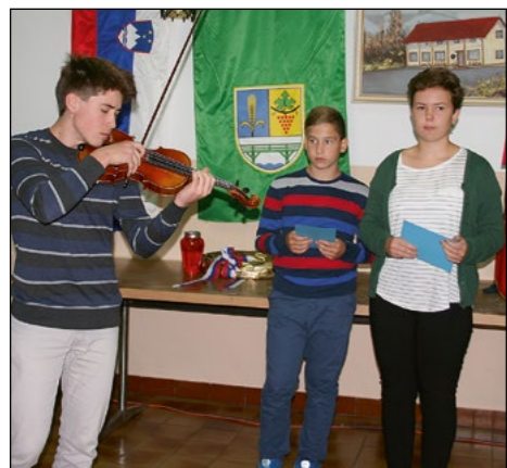
S pesmijo in lepo slovensko besedo so se učenci OŠ Hajdina poklonili padlim kurirjem.