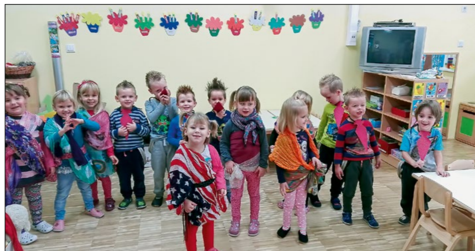
Otroci bele igralnice so se na modni reviji predstavili s kolekcijo pisanih šalov in igrivih frizur za novo šolsko leto 2015/16.