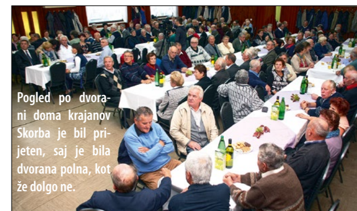
Pogled po dvorani doma krajanov Skorba je bil prijeten, saj je bila dvorana polna, kot že dolgo ne.