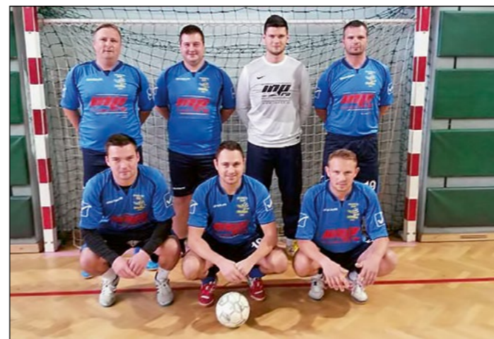
3. mesto: Skorba – člani