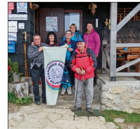
Pred Roblekovim domom nad Begunjščico