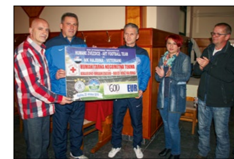
Utrinek s svečane predaje vrednostnega čeka OO RK Hajdina

V Športnem parku Hajdina je bila v četrtek, 22. oktobra, humanitarna nogometna tekma, napovedana kot spektakel z legendarnimi nogometaši, športniki in estradniki. Na nogometni zelenici so se pomerili veterani NK Hajdina in Humane zvezdice, Art football team Slovenije – vsi pa z enim samim namenom, da s humanitarnim dogodkom zberejo nekaj sredstev in jih podarijo humanitarni organizaciji.