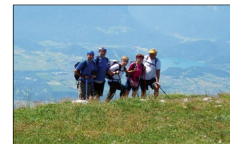
Hajdinski planinci tik pod vrhom Stola – v ozadju v dolini Blejsko jezero