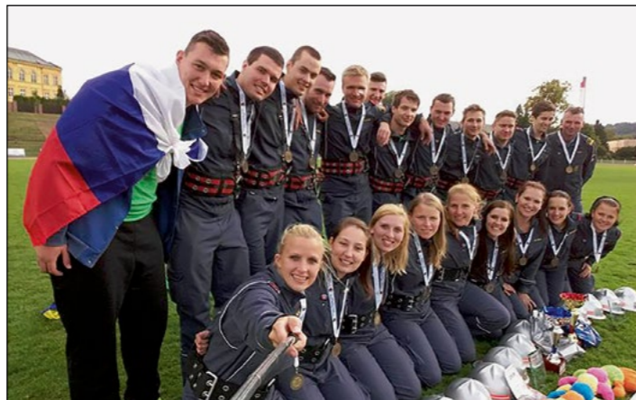
Hajdoške gasilke v družbi s prijatelji PGD Hmeljčič

Ekipo članic A sestavlja deset mladih deklet, ki veliko svojega prostega časa preživijo na gasilskih vajah in tekmovanjih. Tudi letos se lahko pohvalijo z uspešno tekmovalno sezono, saj so zmagale na številnih tekmovanjih in spet osvojile pokal GZS v zimski in poletni ligi.