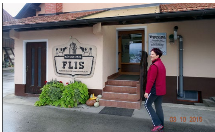
V Spodnjih Grušovljah pri Šempetru, na kmetiji Flis, so jim za pokušnjo pripravili različne izdelke – sire, jogurte, namaze ...

Po vsakotredenskem kuhanju marmelad so se Draženčanke, članice društva gospodinj, odpravile na še dve zelo poučni ekskurziji: 3. oktobra na strokovno ekskurzijo po Savinjski dolini, v oktobru pa so s prijatelji potovale v Bruselj.