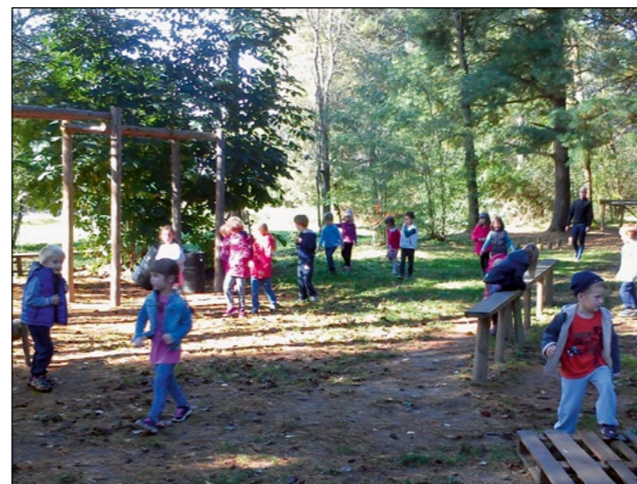
Otroci rdeče igralnice med iskanjem skritega zaklada v bližnjem gozdu

Torek je bil namenjen ogledu gledališke predstave Gibanica prijateljstva gledališke skupine iz Term Banovci. Žal so predstavo ta dan morali odpovedati, a so obljubili, da pridejo k nam v naslednjem mesecu. Dan smo nadomestili s pravljíčno-igralnimi uricami po skupinah, ki so prav tako pričarale posebno vzdušje v vrtcu, polno otroške iskrivosti, radovednosti, smeha, igre in medsebojne povezanosti.