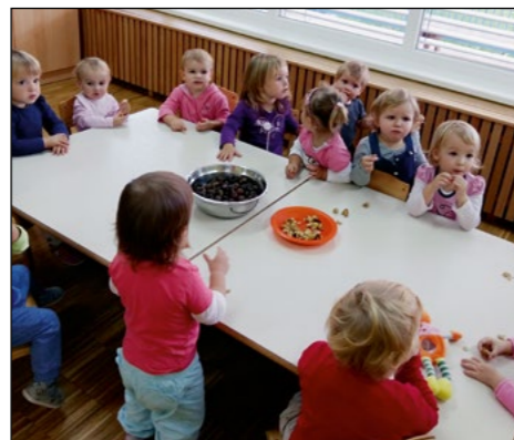
Otroci vijolične in oranžne igralnice smo skupaj jedli kostanje.