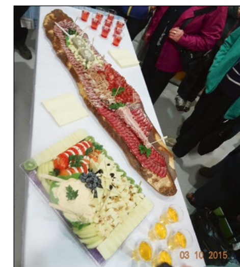
Na koncu so se okrepčale še s hmeljarsko malico in hišnim pivom.