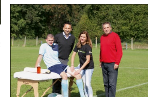
Utrinki s turnirja na Hajdini