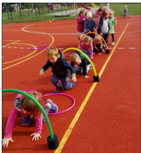
Lezem jaz, ležeš ti, lezemo mi vsi. Čez obroč en, dva, tri zlezemo vsi.