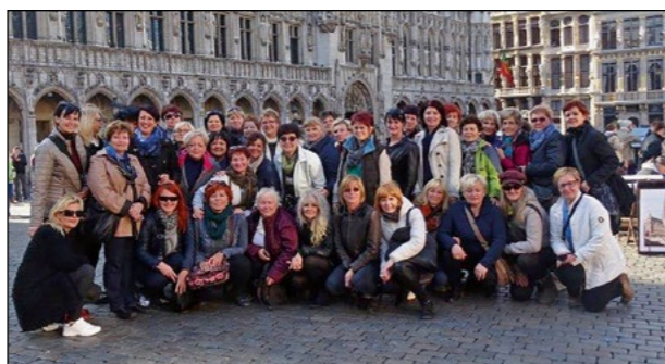
Še skupinski posnetek na osrednjem trgu v Bruslju

liko smo izvedele o sestavi Sveta EU, evropski komisiji, o članih, ki zastopajo evropske državljane.