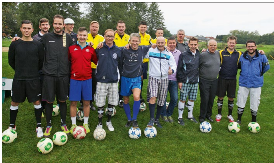
Pred začetkom turnirja. Na prvem turnirju v footgolfru ob prazniku občine Hajdina se je zbralo 16 igralcev.

Footgolf je v Sloveniji nova športna panoga, ki preprosto navdušuje, tudi občane Hajdine. Prvi turnir v Sloveniji je bil odigran na ptujskem igrišču za golf letos spomladi, doživel pa je odličen odziv. Prav zaradi tega ga je v koledar športnih prireditev ob prazniku občine Hajdina premierno uvrstila tudi Športna zveza Hajdina.