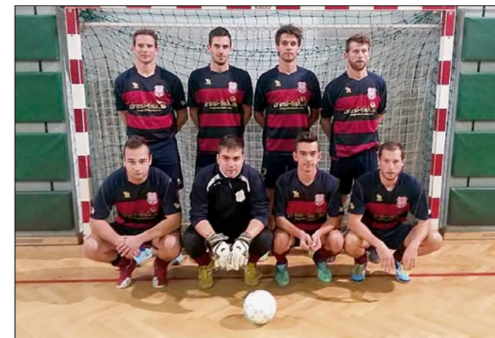
2. mesto: Hajdoše – člani