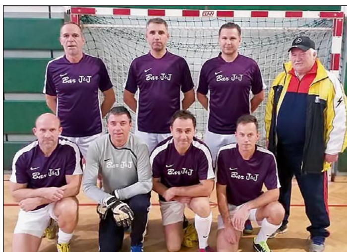
3. mesto: Gerečja vas – veterani