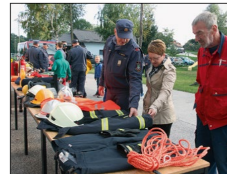
Pred gasilskim domom v Slovenji vasi so gasilci razstavili razpoložljivo tehniko in opremo.