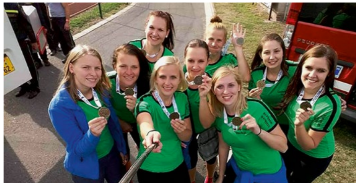
Zmagovalke z medaljami