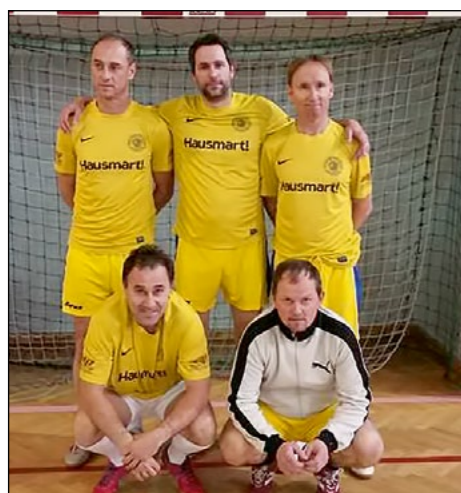
6. mesto: Slovenja vas – veterani