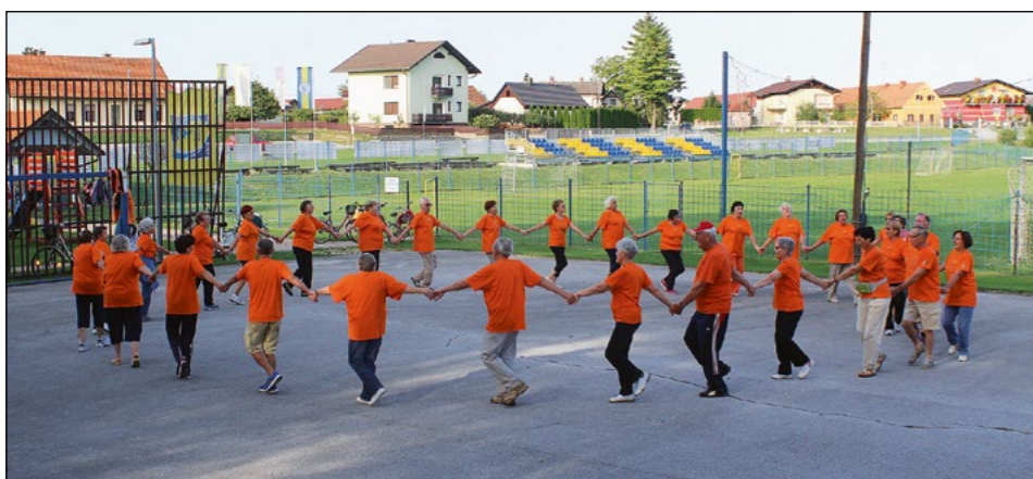
Po utečenem zaporedju je najprej potekal program tisočih gibov, ki sta jih tokrat skupno opravili ekipi Hajdinčanov in gostov iz novoformirane Šole zdravja Turnišče.