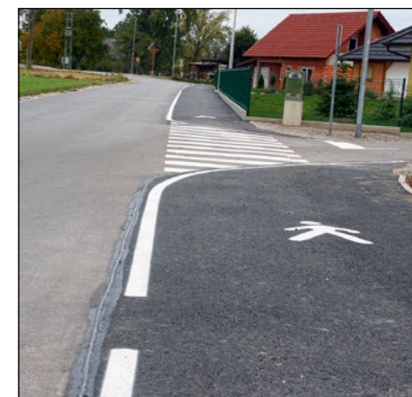
Cesta skozi naselje Draženci je dobila končno podobo.