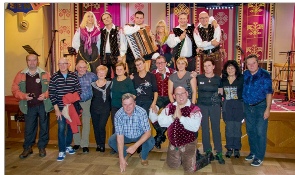
Planinci Pri Jožovcu v Begunjah s člani ansambla Ekart

Planinsko društvo Hajdina je letos v lepem in prijetnem vremenu, primernem za hojo, izvedlo številne pohode in vzpone tudi v visokogorje. V septembru pa nam je zagodlo vreme, ki ni dovoljevalo obiska gora, zato sta nam odpadla pohod v Kamniške Alpe na vrh Ojstrice in Marijina romarska pot.