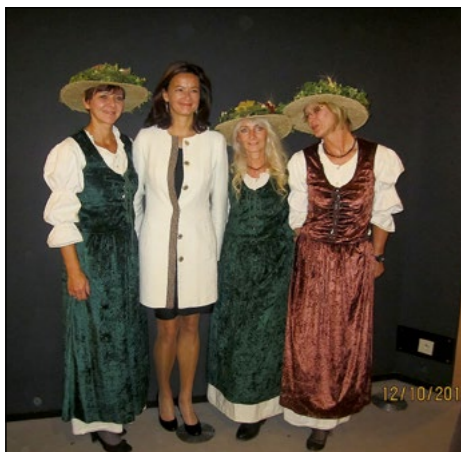
Draženske zeliščarice v družbi Fajonove

Zvečer smo obiskale še skrite koticke mesta – pivnice, butike, restavracije z značilno hrano, od krompirčka, čokolade do sladkih vafeljev.