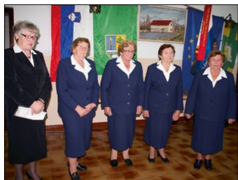
Lepa slovenska pesem se je slišala, ko so zapele hajdinske ljudske pevke.