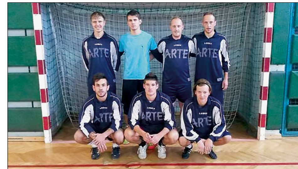
Prepričljivo 1. mesto: Hajdina – člani

V skupini A je o potniku v finale odločala tekma med ekipama Gerečja vas in Hajdina, ki pa so jo na »taktičen« način dobili igralci Hajdine. Gerečani so imeli posest žoge, Hajdinčani pa so se disciplinirano branili in po hi-