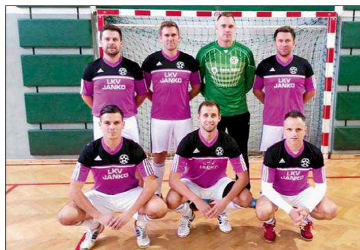
4. mesto: Gerečja vas – člani