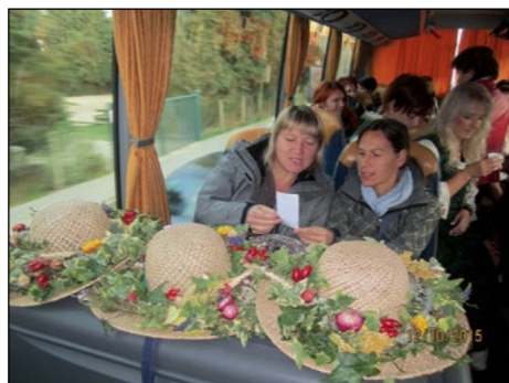
Polne pričakovanj že na avtobusu na poti v evropski parlament, kjer so zapele še svojo »himno« Čebelice.