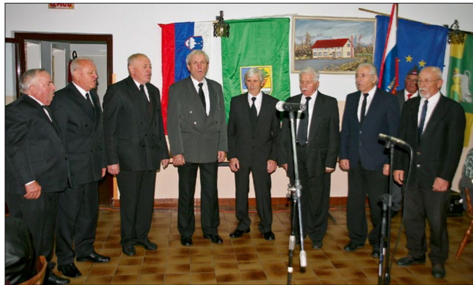
Zapeli so tudi hajdinski ljudski pevci.

Zveza borcev za vrednote NOB Hajdina je z živečimi borci in njihovimi prijatelji iz Dolene, Podlehnik, Vidma, Majšperka in Ptuja v petek, 25. septembra, v Doleni obeležila spomin na krut dogodek, ki se je zgodil 27. septembra leta 1944, ko so pod streli okupatorja padli partizanski kurirji.