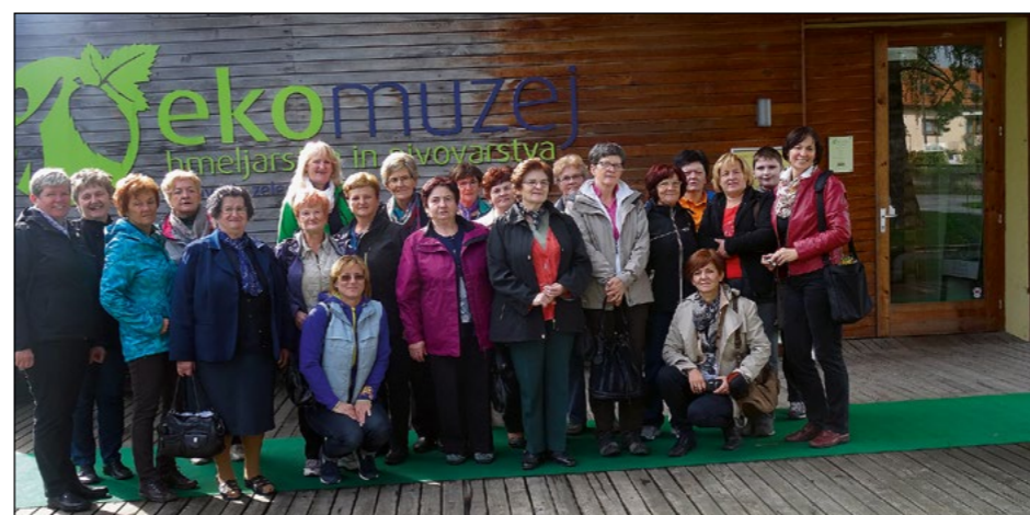
Draženčanke pred Ekomuzejem hmeljarstva in pivovarstva

V nekdanji sušilnici hmelja v Žalcu so imele rezerviran termin za ogled Ekomuzeja hmeljarstva in pivovarstva Slovenije, kjer so odkrivale zgodovino hmeljarstva in pivovarstva na Slovenskem. Na koncu so se okrepčale še s hmeljarsko malico in hišnim pivom, lepo, sončno popoldansko vreme pa