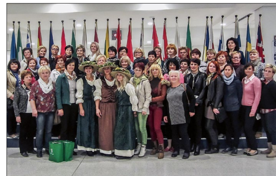
Skupinski posnetek na hodniku, v ozadju zastave zastopnic EU