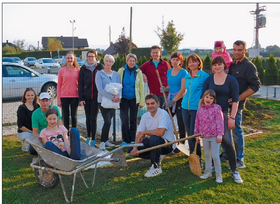
Delovne akcije, na kateri smo uredili čutno pot, so se udeležili starši in naši domači.