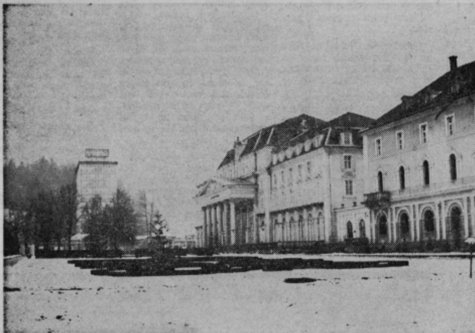
Zdravilišče v Rogaske Slatine je zadovoljno z delom lanskega leta. V primerjavi s predlanskim so dosegli 5 do 15 % prekoračitev realizacije po posameznih dejavnostih. Dosedanji rezultati kažejo, da se je produktivnost povečala, z njo pa tudi samo zanimanje za Zdravilišče. Kolektiv tega znanega turističnega središča šmarske Občine zre z vedrimi in optimističnimi očmi v prihodnost.