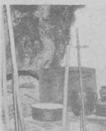
Rojstna hiša Josipa Jurčiča — notranjost