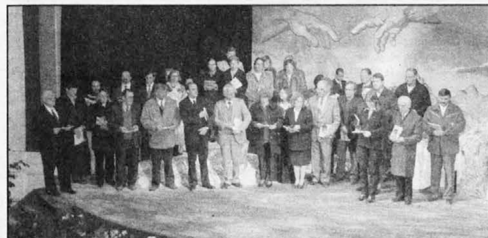
Zbrani predsednice in predsedniki SDO in SFZ.