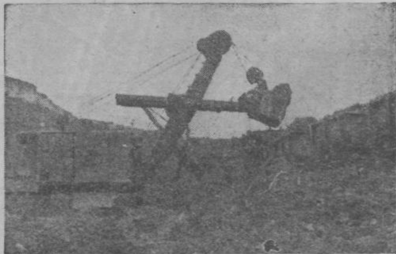
Dnevni kop premogovnika v Banovičih

Pravočasno sprejetje plana, nadaljevanje začete politike stabilizacije in zmanjšanje obremenitve gospodarstva z raznimi obveznostmi lahko ugodno učinkujejo na delo podjetij in dajo vsemu gospodarstvu pobudo za nadaljnji napredek.