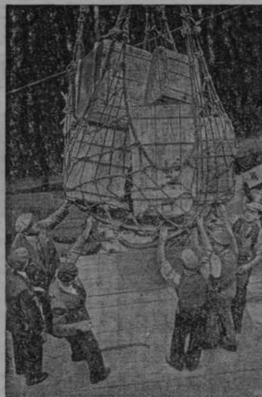
Iz Abesinije pregnani neguš je pripeljal iz domovine v London zlati zaklad, katerega izkrcavajo v londonski luči.