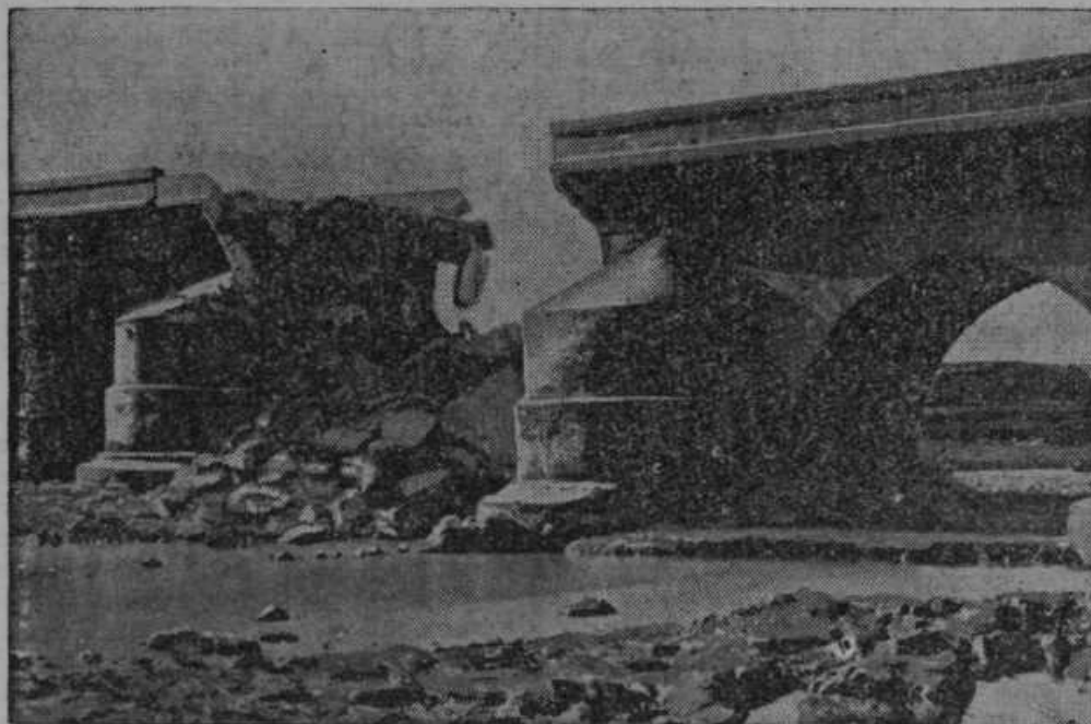
Tako zgleda od rdečih na španskem razstreljeni most.