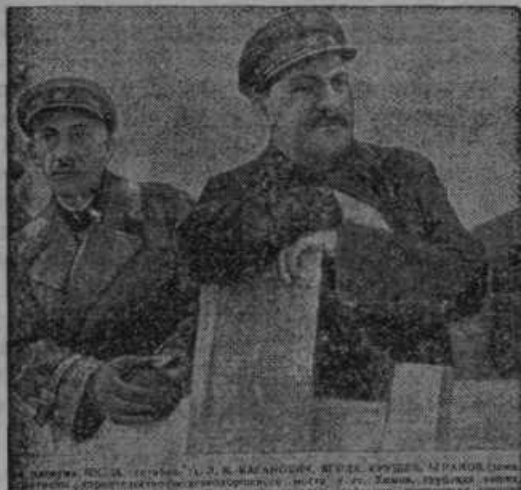
K spremembam v sovjetski Rusiji: Kaganovič in Jagoda (na levi).