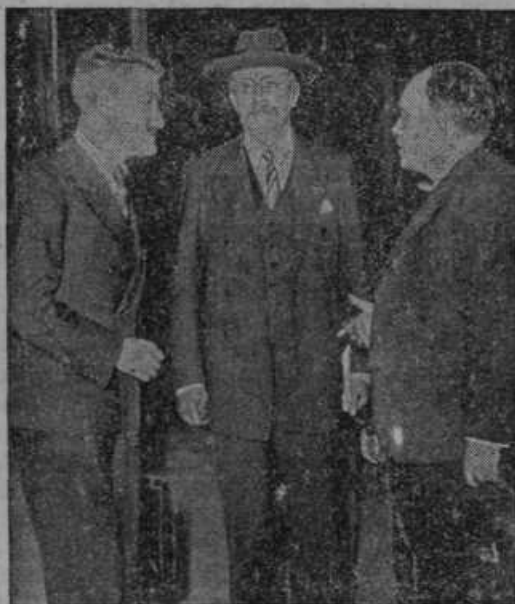
Francoski gospodarski minister Spinasse (na levi), predsednik vlade Blum (na sredi), finančni minister Auriol (na desni). Ta trojica je sklenila razvrednotenje franka.