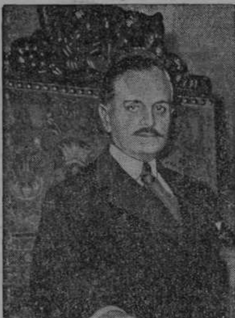
Novi predsednik sedajnega 17. zasedanja Društva narodov Carlos Lamas, zunanji minister južnoameriške države Argentine.