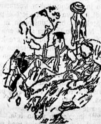
»Glej, gospod doktor nosi večinoma meje obleke! »? ? ? ? »Toda pred menoj!«

Radi prihodnjih tekem bo jutri ob 17.30 na igrišču strogo obvezen trening prvega in rezervnega moštva. Načelnik.