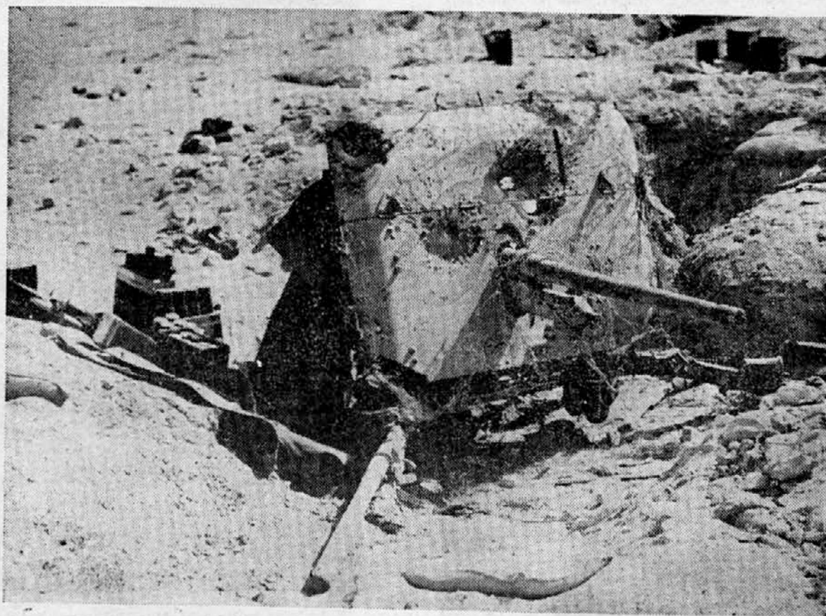
Uničena angleška proti tankovska artilerija.

Cela Francija je uvidela v tej smrti velik padec francoske časti in v kakšen prepad jo bo vse to dovedlo, če se ne zdrav del Naroda še dvigne in otrese anglo-amerikancev, ki hočejo uničiti vse kar ji je še evropskega ostalo in ki ji s temi njihovimi neprestanimi izdajstvi in propagando hočejo pogubiti mesto, ki bi pripadalo Franciji v Novi Evropi.