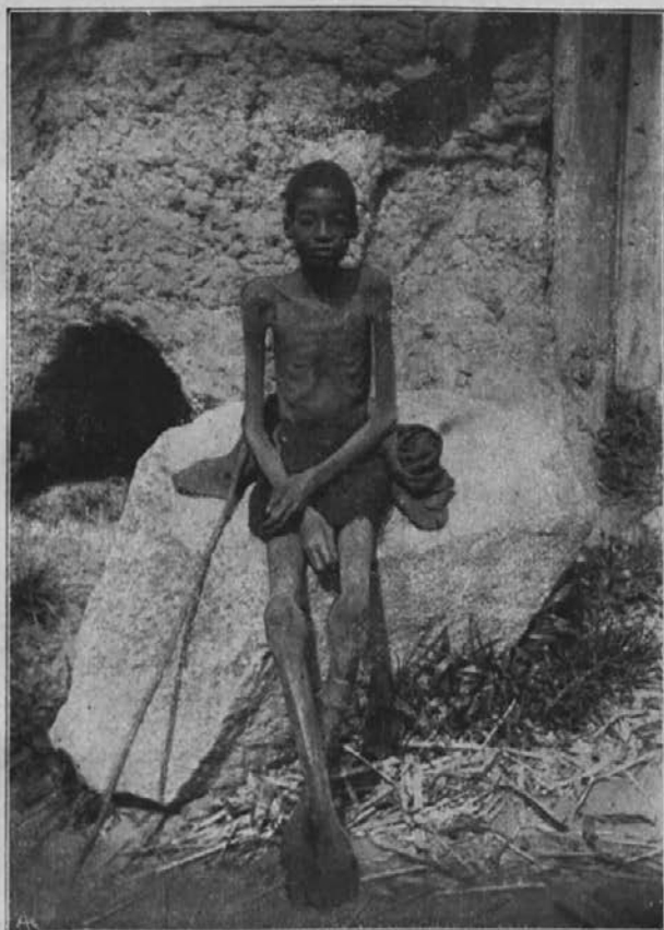
Grozna lakota. — Sestradanec iz misijona Cunene (Huilla).

prejetem denarju. To je bila pomoč božje previdnosti v skrajni sili. Preč. o. Lipp je bil že silno potrč; ni si vedel več pomagati s svojo prazno blagajno. — Vse se je neznančno podražilo, celo najpotrebnejša živila. Krav ali koz nam radi pomanjkanja paše ni mogoče imeti dalje kot nekaj mese-