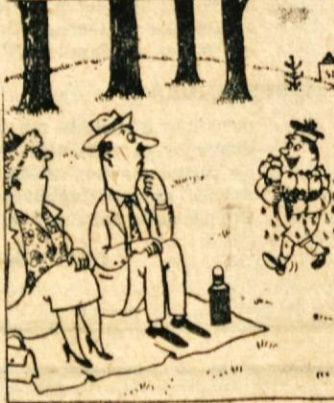
»Sladoledar ni imel drobiža!«

še danes brez skrbi veselo na Krki! Jutri pa v šolo, kjer si bodo kakor pridne čebele nabirali znanje in se pripravljali na življenje. Rod brsti iz roda in ta, ki se v naših šolah zdaj uči in vzgaja, nas bo kmalu zamenjal. Zdalej se otroško razigrani na vodi, čez leta pa delavci, inženirji, zdravniki, obrtniki, učitelji, skratka — nova generacija, ki bo nadaljevala veliko začeto delo: za dvig in razcvit svobodne domovine. In kot je bil mladi rod med narodnovobodilnim bojem v prvih vrstah graditeljev novega sveta, tako polna volje in požrtvovalnosti naj bo tudi mladina, ki prevzema ali bo prevzela veliko dediščino naše revolucije.