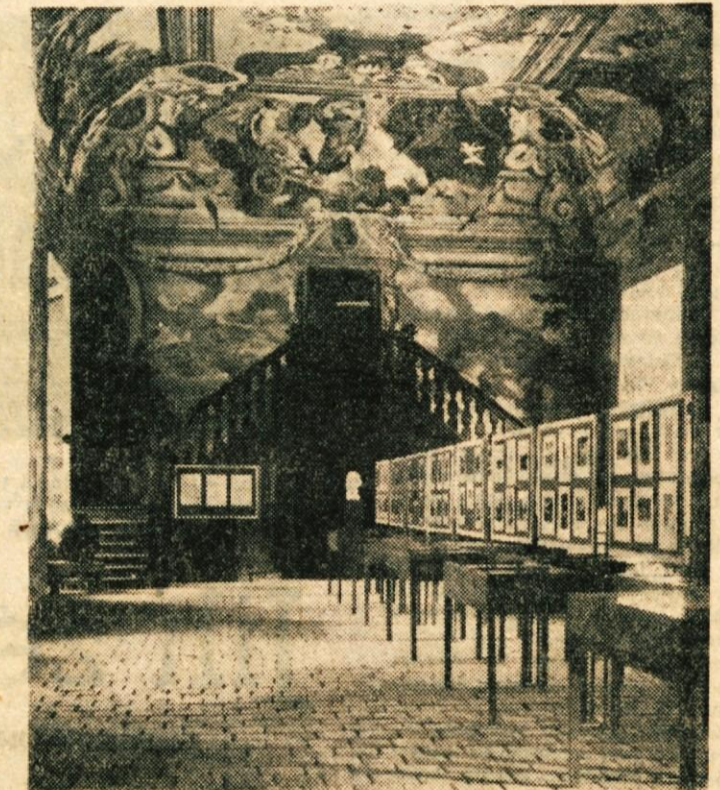
Detajl z razstave »Hrvaško-slovenski kmečki upor 1573« v brežiškem gradu

Zanimivo za filateliste: poseben poštini žig, ki ga bo v festival-skih dneh uporabljala kostanje-viška pošta