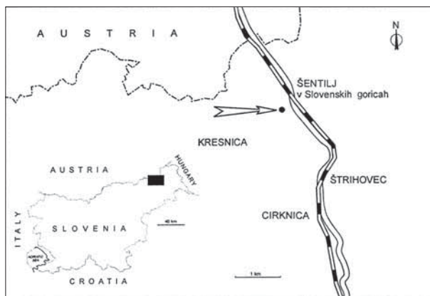
Slika 1. Geografski položaj najdišča Šentilj v Slovenskih goricah Figure 1. Geographical position of the site Šentilj in Slovenske gorice

O raziskavah miocenskih ramenonožcev v Sloveniji ni veliko podatkov. Sistematično jih dosedaj ni iskal ter raziskoval nihče. V različnih člankih, razpravah, monografijah in učbenikih lahko preberemo posamezne po-