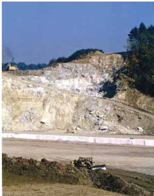
Slika 2. Izdanki miocenskih plasti v najdišču ramenonožcev blizu Šentilja v letu 1996

Opis: Primerek je deformiran, lupini sta majhni, bikonveksni in precej tanki. Anteriorni del je rahlo usločen-uniplikaten. Pecljeva lupina je bolj izbočena od ramenske. Umbonalni del je neizrazit in erekten, foramen okrogel. Obe lupini prekrivajo številne zelo tanke polkrožne prirastnice.