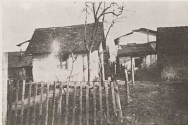
Starejša baraka na Galjevici, fotografirana 1958.

Ceste so bile oskrbovane z nasutjem in gladke kot asfalt, saj ni bilo drugih vozil kot kolo in konjska vprega. In vendar je bila, kadar je deževalo nekaj dni Galjevica v nevarnosti, da jo preplavi