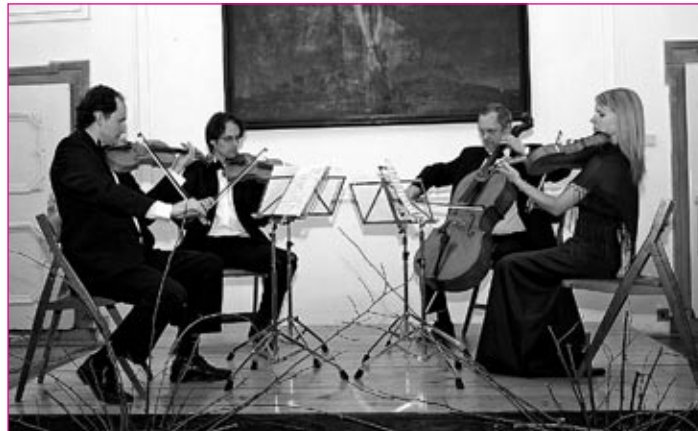
S koncerta Varaždinskega kvarteta v refektoriju minoritskega samostana.

Haydn (1732–1809); marljiv, preprost in pobožen velikan klasične glasbe je napisal čez 100 simfonij, lepo število koncertov, sonat, godalnih kvartetov, oper, maš, kantat in oratorijev, komornih skladb, vokalnih del ... Delo, ki smo mu v nedeljo lahko prisluhnili, je nastalo po naročilu španskega kanonika leta 1785 – med postnimi obredi v cerkvi v Cadizu naj bi glasba vzpodbudila cerkveno občestvo k meditaciji. Haydnova glasba je v zatemnjeni cerkvi, zgrajeni v jami, ter ob škofovi pridigi o poslednjih Kristusovih besedah na križu gotovo delovala pretresljivo. Skladatelju se je sicer sprva zadana naloga zdela težka. Sam je kasneje zapisal: »Naloga, da napišem sedem počasnih stavkov, ki bi morali trajati vsak po 10 minut, pa ne bi bili dolgočasni za poslušalce, ni ravno lahka. Hitro sem ugotovil, da se ne morem držati predpisanih pogojev.« Sedmim stavkom z oznako »adagio« je tako dodal