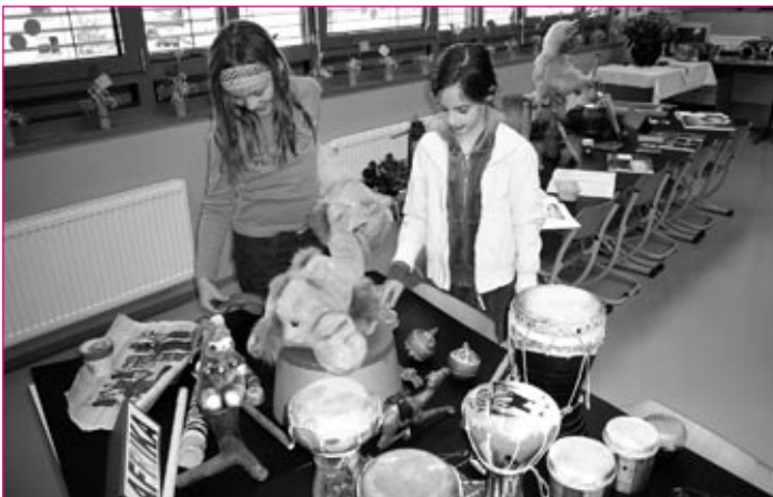
Učenci med ogledom razstave predmetov iz drugih predelov sveta

V telovadnici sta zapela otroški in mladinski pevski zbor, tam se je tudi plesalo. Poučen je bil kviz o poznavanju slovenskega jezika, lutkovni krožek pa se je predstavil z odlično igrico Žabica Nagica .