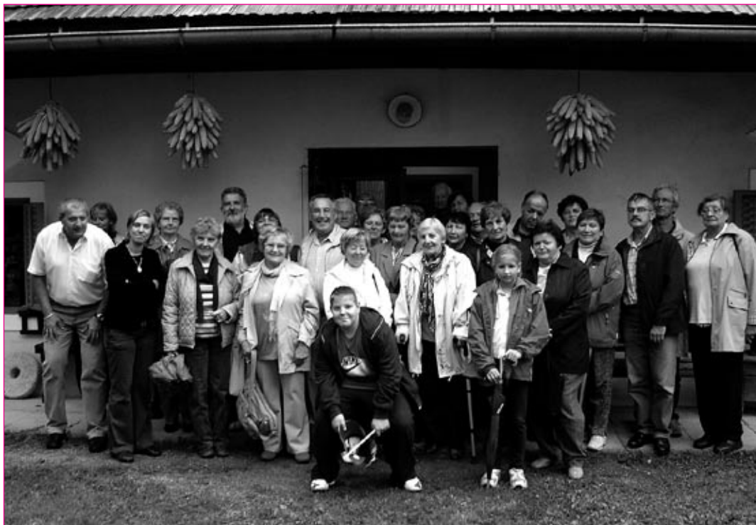
Člani Koronarnega društva Ptuj na jesenskem izletu v Kozjanskem parku.

Vseživljenjska rehabilitacija smo hvaležni tudi vsem zdravnikom, medicinskim sestram in drugim, ki nam s svojim strokovnim znanjem pomagajo pri izvajanju naše dejavnosti. Zahvaljujem se Mestni občini Ptuj in vsem donatorjem, ki z denarnimi prispevki podpirajo izvajanje društvenih nalog, tudi Večeru, Videoprodukciji Tinček Ivanuša – TV Ptuj, Radiu Tednik Ptuj, Radiu Maribor, Radiu Slovenija in uredništvu Ptujčana, ki imajo