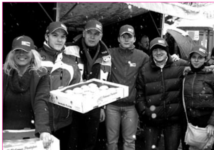
Razdelili so več kot 300 krofov.

in pustovanja na Ptuj s prav posebnim prispevkom. 17. februarja je Mladi forum SD Ptuj v sodelovanju s Socialnimi demokrati Ptuj kot že tradicionalno organiziral projekt ob otroški povorki: deljenje krofov, kuhanega vina in čaja. Ob njihovi stojnici so se z veseljem ustavili in okrepčali prav vsi, tako otroci