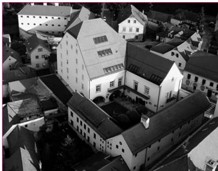
Poslopje knjižnice z atrijem v starem mestnem jedru.

dejavnosti segata tudi čez knjižnični prostor lokalne skupnosti, saj sta deležni strokovne, medijske in druge pozornosti tudi v celotnem slovenskem prostoru.