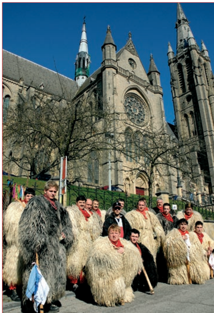
18 korantov iz Spuhlje pred cerkvijo Svetega Martina v Arlonu.