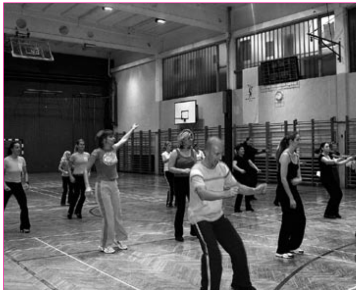
Priljubljena skupinska telovadba za ženske je aerobika.

Na splošno je telesna aktivnost pri ženskah velikega pomena. »Fizična aktivnost namreč poleg drugih zdravstvenih prednosti, ki jih daje, učinkovito omili težave, ki jih imajo ženske zaradi hormonskih sprememb. Številne raziskave dokazujejo, da ženske, ki se redno ukvarjajo s telovadno in se zdravo prehranjujejo, veliko lažje prenašajo hormonske spremembe, so manj napihnjene