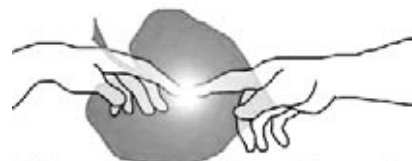
Humanitarno društvo Slovenije

S projektom Potujoče svetopisemske knjižnice želimo vsem ljudem, še posebej starejšim, olepšati vsakdan, tako da bodo spet čutili notranje zadovoljstvo in se zavedali, da niso povsem pozabljeni, ne od oblasti in ne od Boga. Tudi otrokom in mladini želimo s Svetim pismom in božjo besedo, z nasveti o zdravju in o božji modrostih usmeriti smisel življenja. Želimo jim pokazati, da obstaja tudi boljši, koristnejši in prijaznejši način preživljanja prostega časa in tako želimo njihove misli preusmeriti od alkohola, nikotina, kofeina in drog, ki so dandanes nekakšen del satanovega načrta. Zato bomo tudi otrokom nudili v izposajo otroške svetopisemske