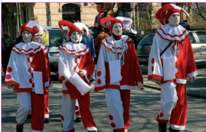
Les Pierrots D' Arlon so zelo številčna skupinska maska Arlonu, njihova značilnost je rdeče-bela kombinacija kostuma.

sprehodile po mestnih ulicah, od lokala do lokala pa vse do šotora v središču mesta, kjer so bučno igrale. Med koranti iz Spuhlje in organizatorji iz Arlonu so po vseh letih sodelovanja nastale številne prijateljske vezi. Kljub temu da Arlonci (žal) govorijo in razumejo samo francosko in je karneval mednarodni, pa organizatorji niso pripravili pripraviti osnovnih informacij o karnevalu v katerem izmed jezikov gostujočih skupin, npr. v nemščini ali angleščini. Organizatorji kurentovanja so, kar se tiče slednjega, v veliki prednosti.