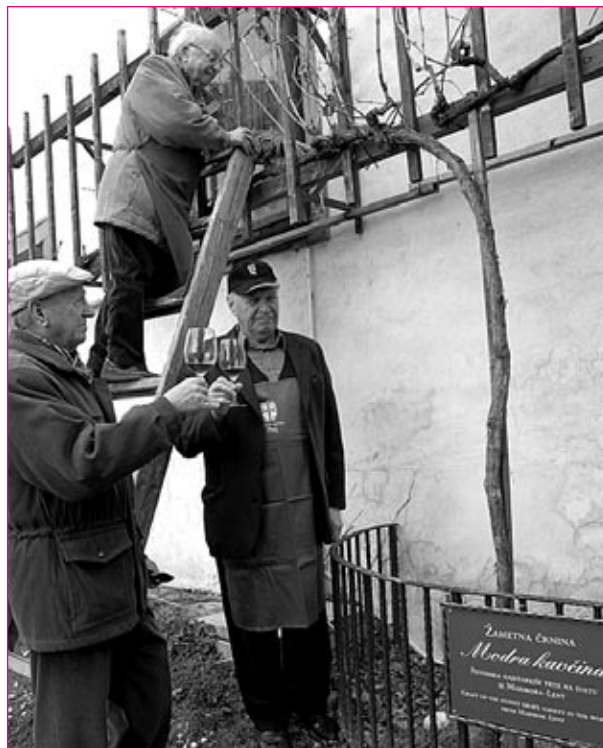
Stari prijatelji iz Kicarja so s pesmijo poleg vitezov vina (na fotografiji) popestrili slovesni rez žametne črnine na ptujskem gradu.