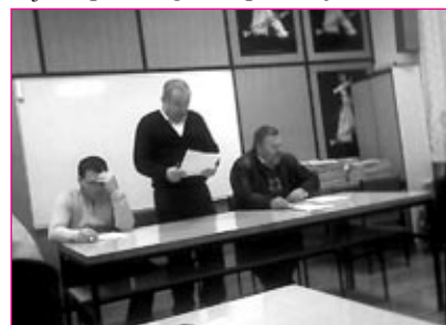
Predsedstvo skupščine AK Ptuj

in sekcije. Seznanjeni smo bili tudi s finančnim poslovanjem kluba ter z rezultati tekmovanj. Doseženih je bilo osem prvih, pet drugih in pet tretjih mest ter