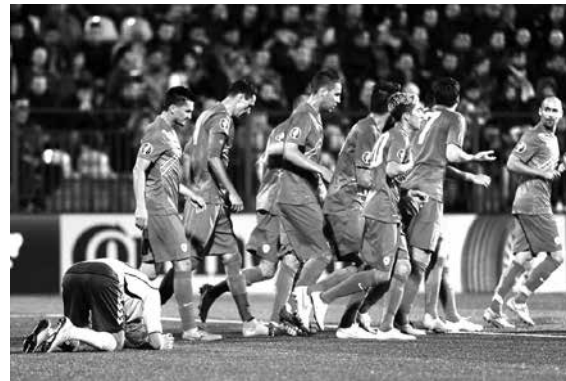
Latvijci na kolena

Štiri minute zatem so Slovenci udarili še enkrat, kaznovali bolj odprto litovsko igro, ko je Kevin Kampl podal z leve v kazenski prostor do Novakovića, temu je domači vratar Giedrius Arlauskis prvi strel obranil, pri drugem iz bližine pa je bil nemočen, tako da je izkušeni napadalec v statistiko vpisal še svoj 28. zadetek.