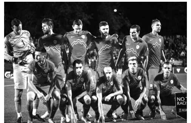
Zmagovita ekipa Slovenije

Izbrance selektorja Srečka Katanca čaka naslednji kvalifikacijski obračun 15. novembra v Londonu proti Angliji.