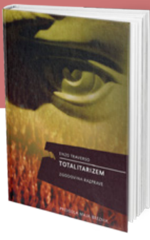
ENZO TRAVERSO Totalitarizem: zgodovina razprave prevod: Maja Breznik 20 €