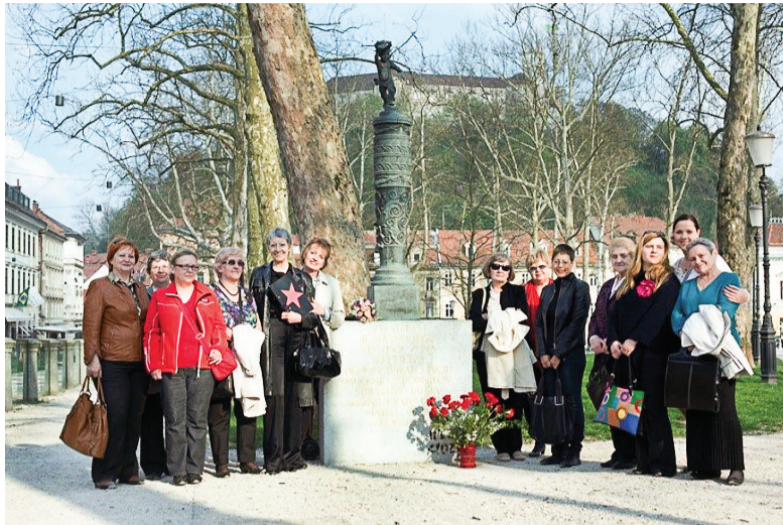
Spomenik pred Kasino v parku Zvezda

Potem pa so zavezniki prišli v Italijo. Zato so se ženske 21. junija 1943 spet zbrale pred vladno palačo in zahtevale pravičnost. Razgnali so jih z vodo iz gasilskih brizgal in kopiti. Pa so se spomnile na cerkvene očete in odšle pred stolnico, da bi spet prosile za milost pri cerkveni oblasti. Do stolnice niso prišle, ker je bila najprej zapora takoj za