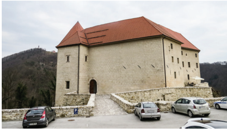
Grad Rajhenburg nad Brestanico

Po končanih rasnih, političnih in nacionalnih pregledih je nemška uprava začela izgon: prvi val – izgon vseh slovenskih izobražencev. V njem so bili zajeti učitelji, profesorji, duhovniki, sodniki, uradniki