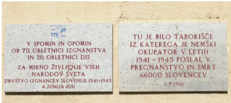
Spominski plošči na gradu Rajhenburg