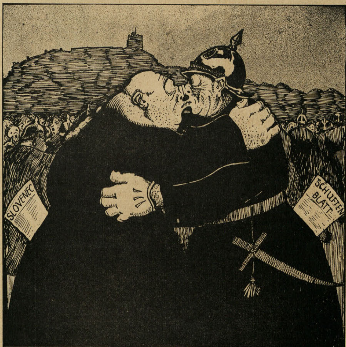
Dva prijatelja, ki se najdeta vedno, kadar gre za boj proti napredku Slovenstva.

Zabayno - humoristična nedeljska priloga „Dnevu“.