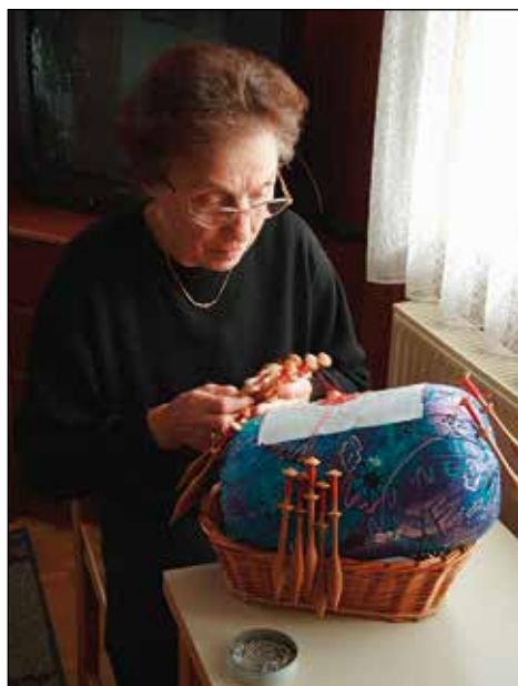
Ob punkeljnu.

... pa vendar se sedaj lahko pohvali z mnogimi nagradami in priznanji, ki jih za klekljane dosežke pobira na domačih in mednarodnih tekmovanjih. Zadnji uspeh je tretje mesto na mednarodnem tekmovanju iz klekljanja na Madžarskem, pripravlja pa že čipke za naslednja tekmovanja in razstave. Istočasno ima v delu več čipk, ki jih izdeluje za različne priložnosti.