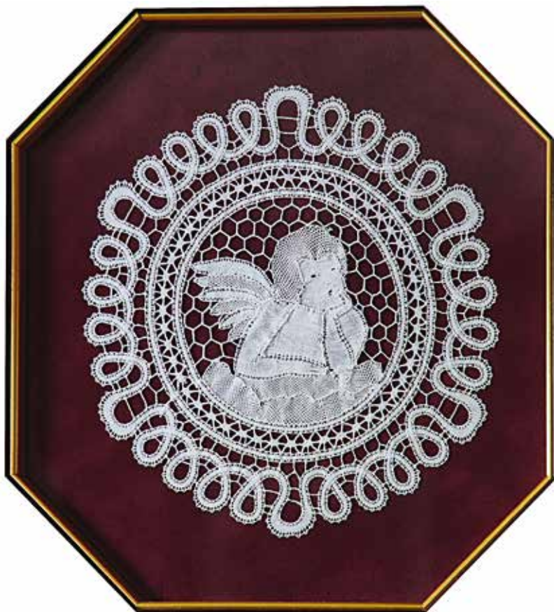
Fotografija nagrajene čipke v Sansepolcru leta 2000.