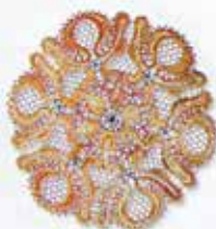
Saša Blasko 17 éves /17 years old szlovénia /Slovenian Az ősz színei vert/bobbin lace