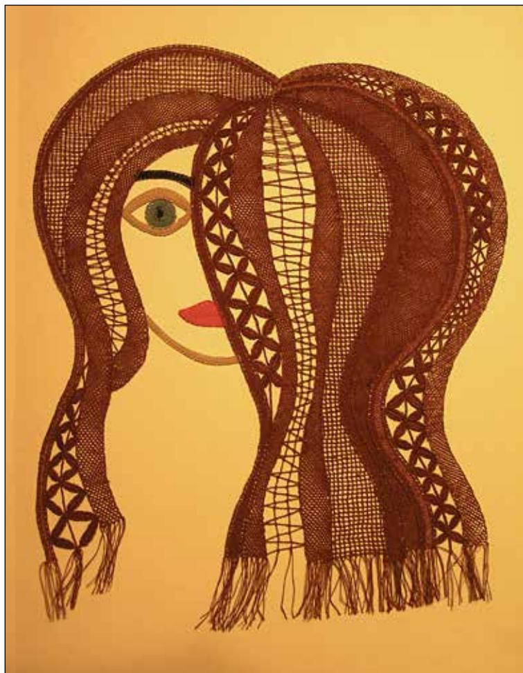
Odsev v ogledalu.