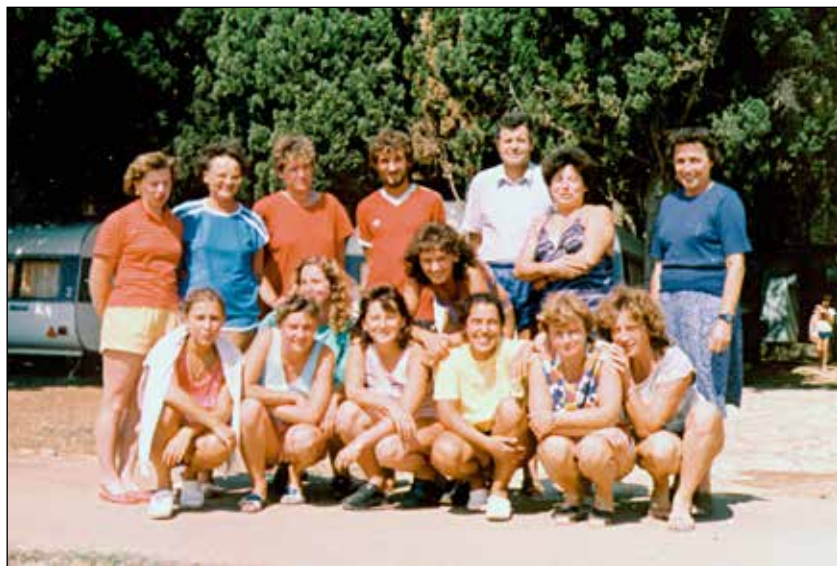
V šoli v naravi v Fažani leta 1988.