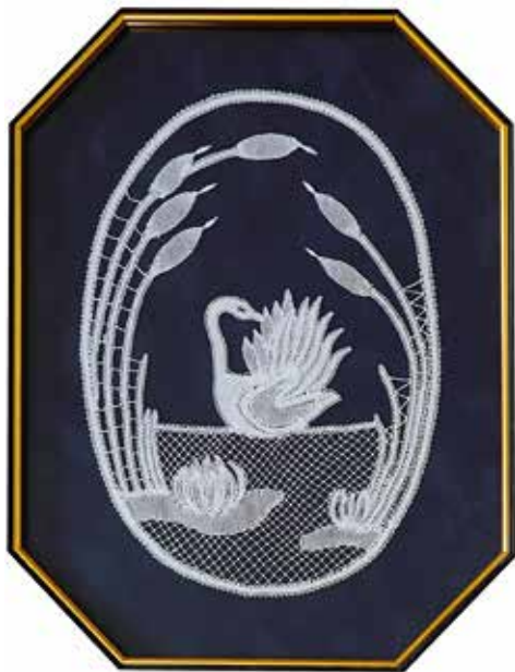
Labod.