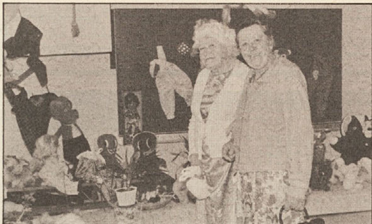
Tradicionalna zaključna prireditev je privabila tudi letos obiskovalce z vse Koroške, ki so si mr. ogledali tudi razstavo ročnih del.