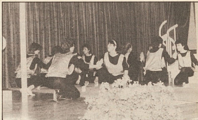
Z mag. Olgo Gallob so gojenke naštudirale programsko točko aerobike, ki je predvsem med mlajšimi obiskovalci zbudila veliko zanimanje.