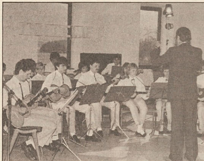
Tamburaški simfonični orkester iz Celja je igral preteklo soboto v Šmihelu.