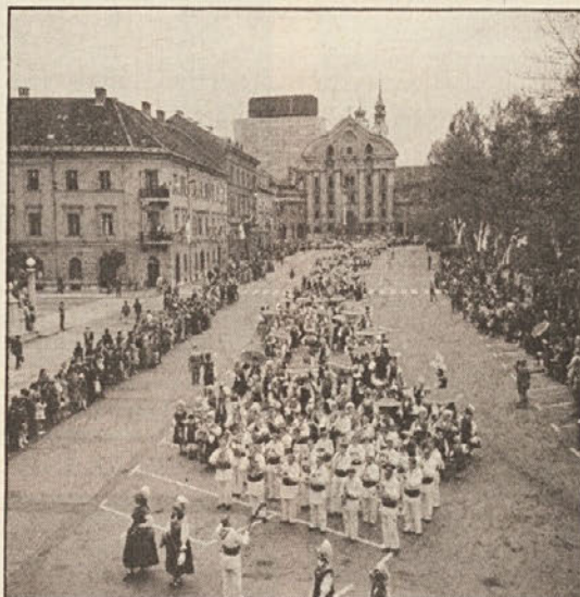
Prizor s prireditve „Ohcet v Ljubljani“

P rireditve se bodo vrstile ves teden, a naj opozorimo na najbolj pomembne. V četrtek, 26. junija, bo dekliščina in fantovščina v Rogaški Slatini (ob 16. uri), v petek, ob 18. uri bo alpska veselica ob Planšarskem jezeru na Jezerskem. Za rojake iz Koroške je to le kratek skok — pridite — ne bo vam žal! Osrednja prireditve bo v soboto,