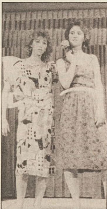
Pri modni reviji so dekleta predvajala lastne modele, ki so bili odlično narejeni.

Uvodoma je bila na sporedu mini modna revija, pri kateri so dekleta predvajala lastne modele, ki so bili tako izvrstni, da človek skoraj nisi mogel verjeti, da bi jih gojenke same