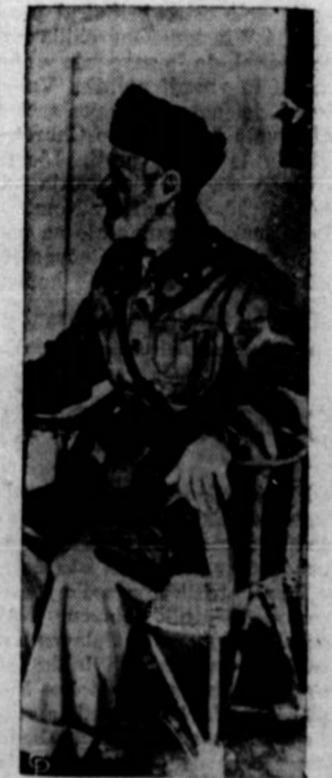
General Annabile Bergonzoli ("električna brada") je vodil italijansko armado v Libiji. Ko so Angleži udarili vanjo, so ga presenetili in ujeli. Od tuge je zbolel. Premisljal je, kako ga Mussolini proklanja, pa ga je prizadelo. Gornja slika ga predstavlja, ko je v angleški vojaški bolnišnici nekje v Egiptu.

so analfabetški srbski banditi v Beogradu zavrato napadli in sebe proglasili za režim sovražna proti nam. Verjemite, ni mi preostajalo drugega, kakor v tem položaju varovati najboljše koristi tretjega rajha s kakršnimi koli sredstvi. (Kar je pomenilo: Ker se Jugoslavija ni pustila ukantiti, kakor smo si začrtali, smo bili pripravljani tudi na možnost, da se bo v skrajnem momentu uprla. Ko je to storila, smo svojo pripravljenost ob njenih mejah še bolj izpopolnili in udarili po nji z vseh strani.)