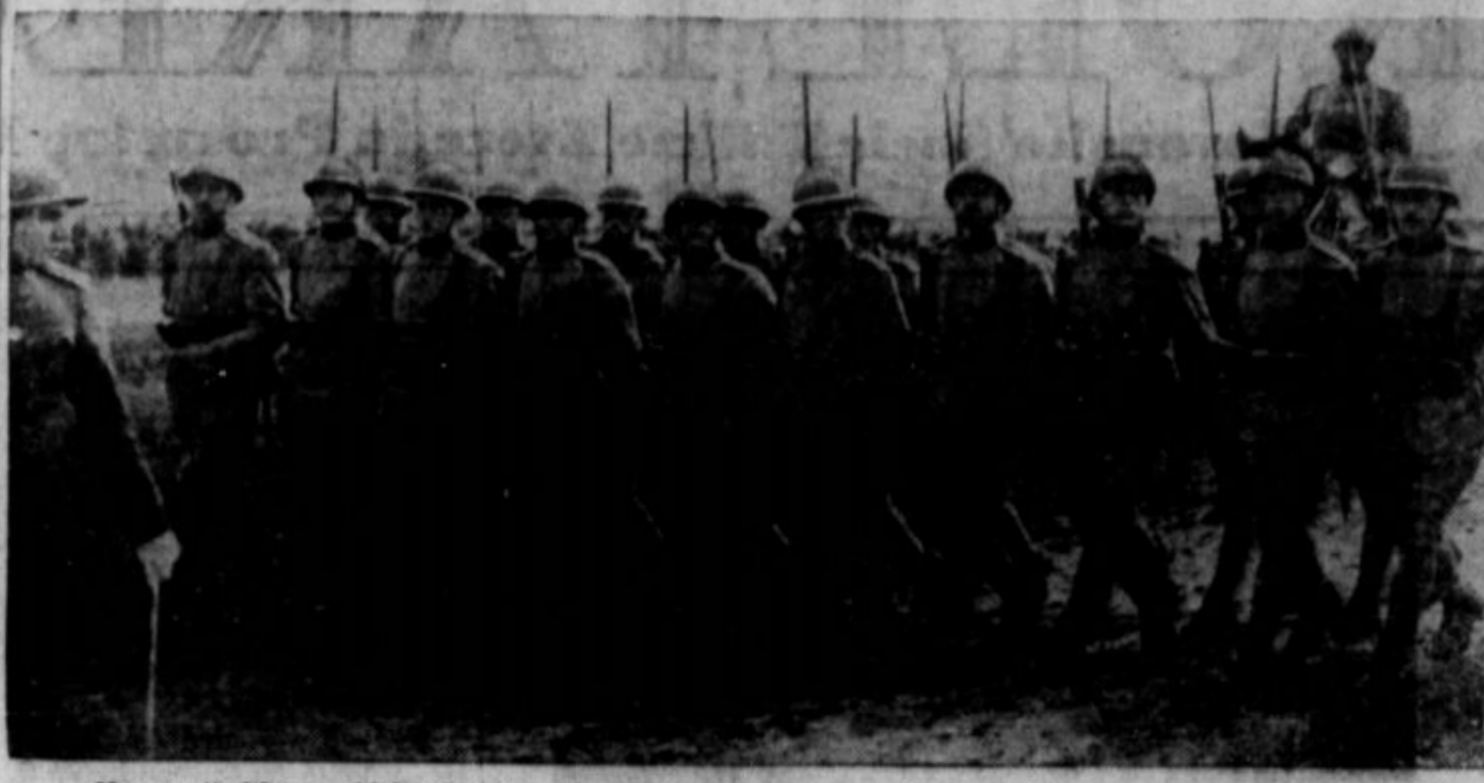
Na gornji sliki je oddelek čete jugoslovenskih vojakov v paradni pozi. Bila je sneta par dni predno je Nemčija udarila po Jugoslaviji.