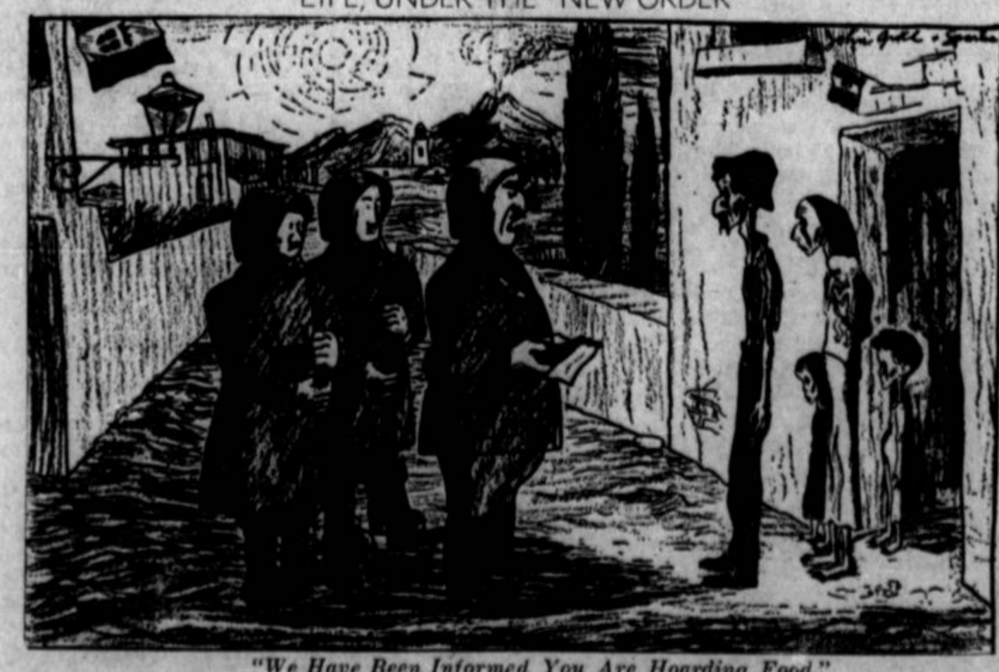
"We Have Been Informed You Are Hoarding Food."