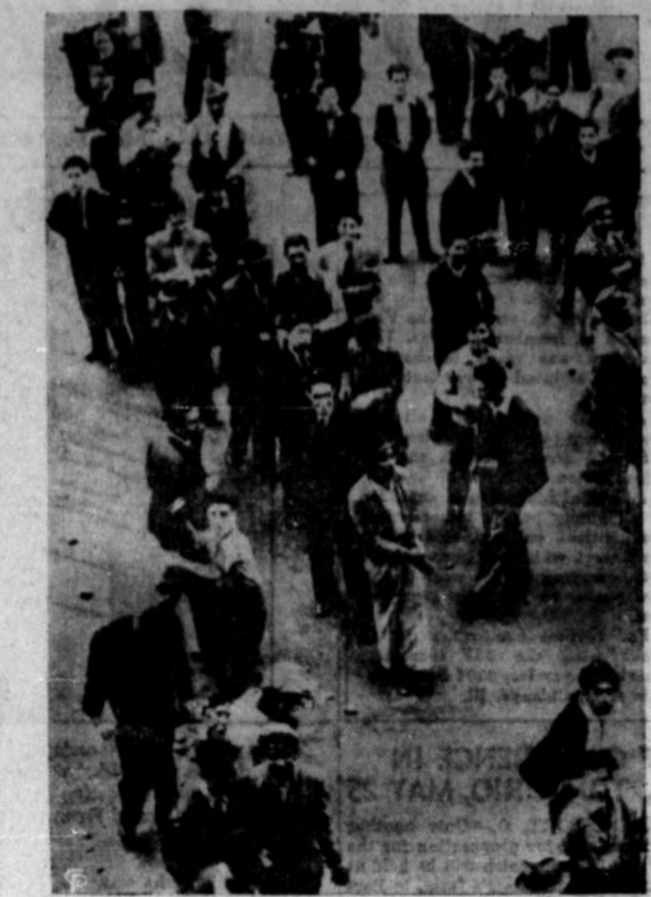
Nacijska in komunistična propaganda uspeva tudi v Mehiki. Naperjena je proti Zed. državam in na drugem mestu proti Angliji. Ljudstvo je razdeljeno, a vladi je ne povzročajo izrednih težav. Vročekvni študenti pa občasno dostikrat povzročajo sitnosti. Gornja slika predstavlja prizor iz demonstracije dijakov v mehiškem glavnem mestu.