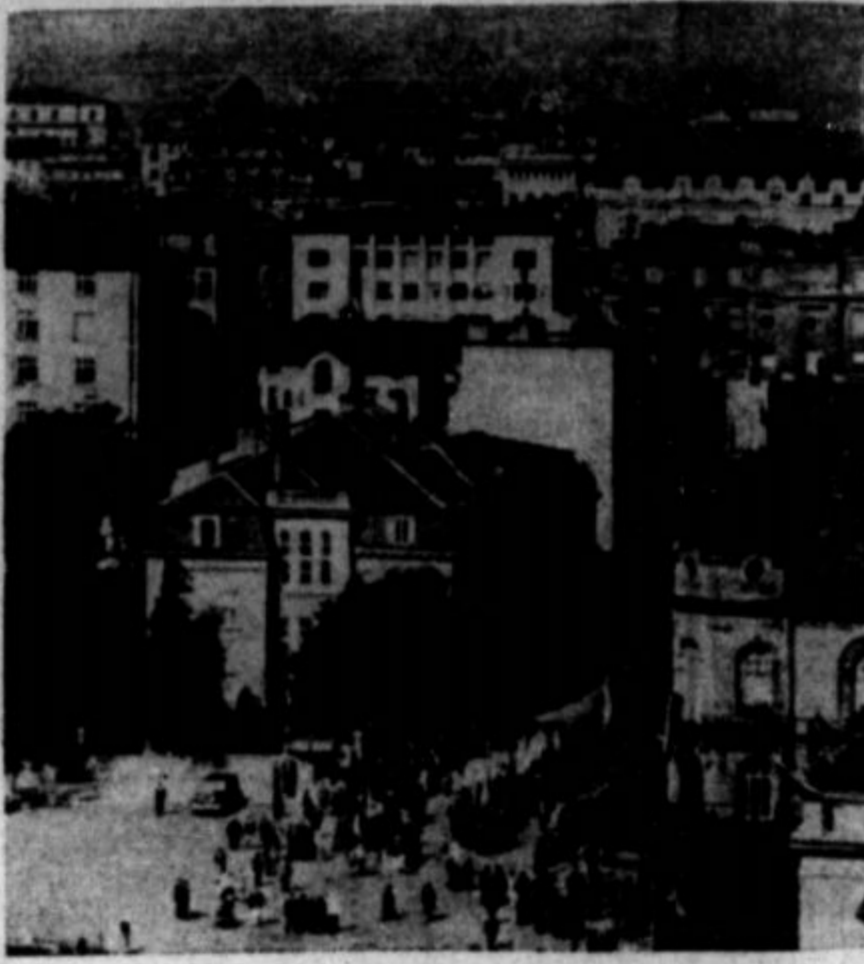
Bolgarija, ki se je v sedanjih vojni slepo udala Hitlerjevi Nemčiji, je z njim vred "premagala" Jugoslavijo in Grčijo ter si povečala svoje ozemlje. Za prejšnji dan v Rumuniji. Gornja slika predstavlja bolgarsko glavno mesto Sofijo. Angličani so pretuli, da ga bodo porušili s svojimi letalci, pa so načrt za enkrat umaknili bodisi iz političnih ozirov, ali pa zato, ker so njihovi letalci predaleč, da bi riskirali letalske napade po tako dolgi poti.