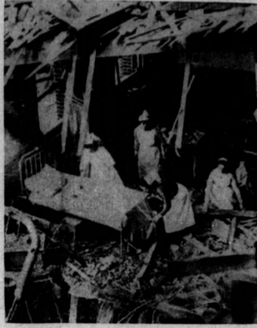
Nemška ofenziva na Anglijo uspeva. Stotine letalcev z nemških vletališč jo napada vsak dan ter ruši njeno industrijo, mesta, pomole, skladišča in pa stanovanjske hiše. Na gornji sliki je neka bolnišnica v Londonu, ki je bila žrtev napada iz zraka.

višje se je dvigala, stopala je razirano kot po godbi, jaz pa sem splezal s skale in ji hitel naproti. Smejala se je široko od daleč. Beli zobje so se ji lesketali. Ustnice je imela rdeče kot rododendronov cvet. Začuden sem se ustavljal. — "Jela?"