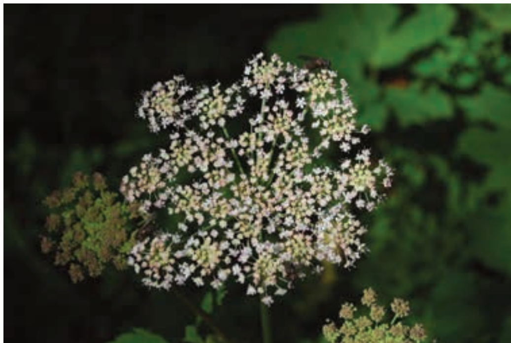
Figure 3: Peucedanum ostruthium – inflorescence Slika 3: Jaščarica ( Peucedanum ostruthium ) – socvetje