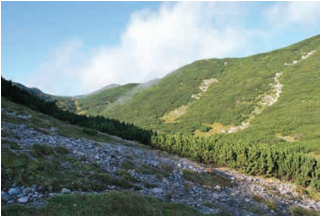
Figure 9: A small valley Poljska jama between peaks Kordeževa glava and Velika glava, one of the localities of Peucedanum ostruthium on the top of Peca Mountains

Slika 9: Dolinica Poljska jama med vrhovoma Kordeževa in Velika glava, eno od nahajališč jaščarice na ovršju Pece