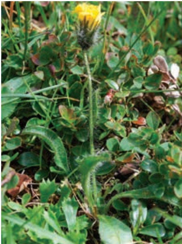
Figure 10: Hieracium alpinum grows close to the Peucedanum ostruthium stands on the Peca Mountains

Slika 9: Dolinica Poljska jama med vrhovoma Kordeževa in Velika glava, eno od nahajališč jaščarice na ovršju Pece