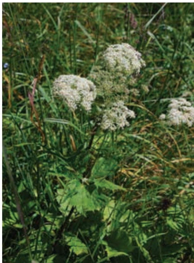
Figure 5: Peucedanum ostruthium on the alpine meadow near the alpine cotage on the Mt. Peca Slika 5: Jaščarica (Peucedanum ostruthium) na visokogorskem travniku pri planinski koči na Peci