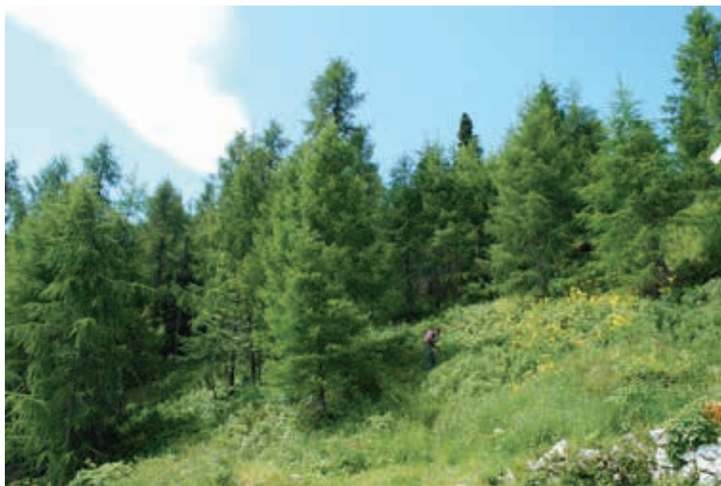
Figure 6: The habitat of Peucedanum ostruthium, forest edge near the alpine cotage on the Mt. Peca Slika 6: Rastišče jaščarice (Peucedanum ostruthium), gozdni rob pri planinski koči na Peci