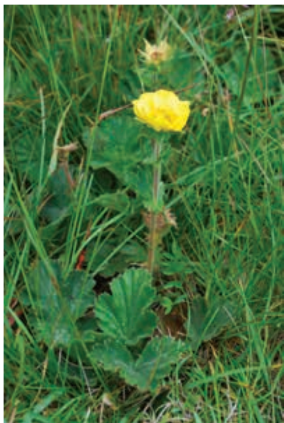
Figure 12: Geum montanum , together with Peucedanum ostruthium one of the species in the association Rhododendro hirsuti - Pinetum mugo

Slika 11: Najmanjši jeglič ( Primula minima ) – redka vrsta (R) slovenske flore je na ovršju Pece dokaj pogosta