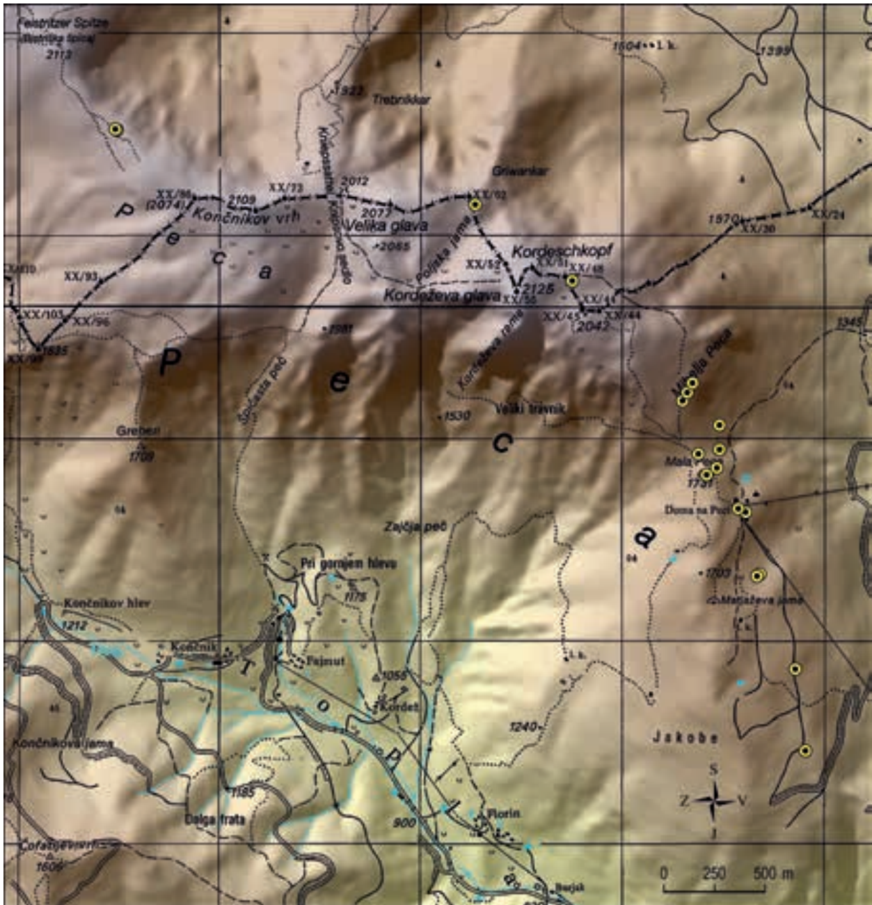
Figure 2: Localities of Peucedanum ostruthium in the Peca Mountains Slika 2: Nahajališča vrste Peucedanum ostruthium na Peci

lowest was under the mountain hut Dom na Peci along the trail leading from Jakobe, at around 1460 m a.s.l. It is very common in pioneer larch-spruce and larch stands and in tall herb communities on shady slopes under Mala Peca. Individual localities are situated along the path from the saddle Na sedlu towards Kordeževa glava, to the timberline and further on the ridge to the east of Kordeževa glava, up to the eleva-