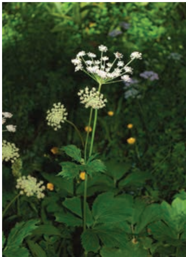
Figure 4: Peucedanum ostruthium – plant Slika 4: Jaščarica ( Peucedanum ostruthium ) – rastlina