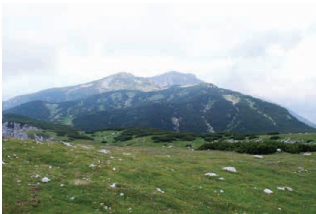
Figure 8: Mt. Peca – western part with the highest peak Bistriška špica Slika 8: Peca – zahodni del z vrhom Bistriška špica