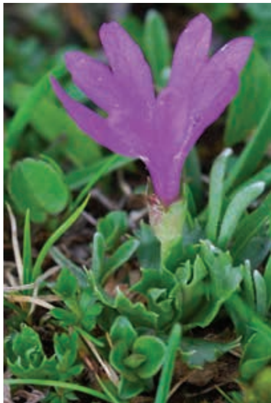
Figure 11: Primula minima – rare species (R) of Slovenian flora is very common on the top of Peca Mountains

Slika 11: Najmanjši jeglič ( Primula minima ) – redka vrsta (R) slovenske flore je na ovršju Pece dokaj pogosta