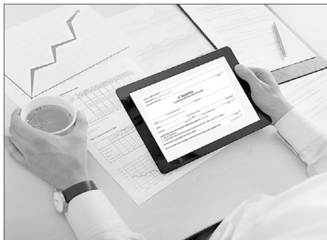
V preteklem tednu je tudi zaživel elektronsko naročanje, ki je imelo v začetni fazi kar nekaj težav.

V preteklem tednu je tudi zaživel elektronsko naročanje, ki je ime-