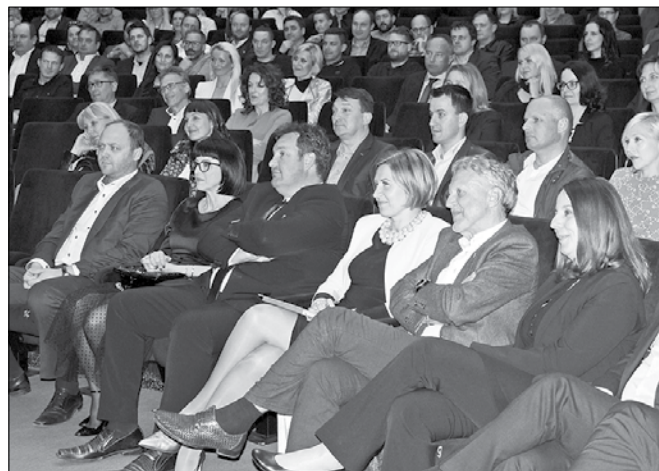
Množica podjetnikov in drugih gostov je navdušeno spremljala predavanje Formula za zmago: Motivacija.

V nadaljevanju so predstavili motivatorja, športnika ter selektorja slovenske rokometne reprezentance Veselina Vujovića, ki je v pogovoru z moderatorjem Igorjem E. Bergantom navduševal prisotne z energijo ter iskrenim pogovorom o svoji športni in trenerski poti.