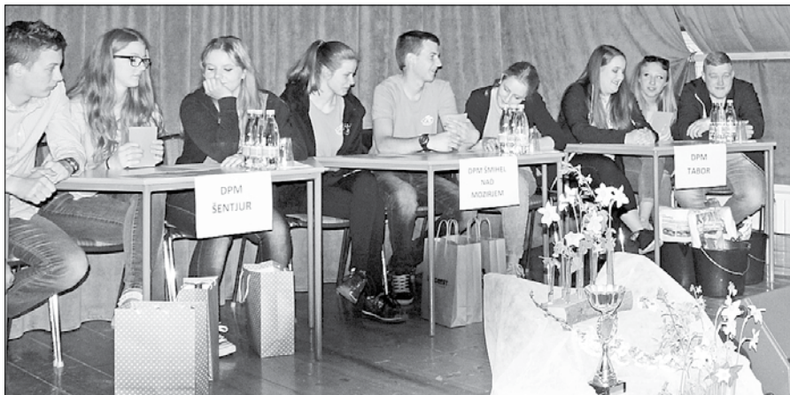
Člani Društva podeželske mladine Šmihel nad Mozirjem (v sredini) so titulo za najboljšega predali ekipi DPM Spodnja Savinjska dolina.

Sodelujoče ekipe: DPM Šmihel nad Mozirjem, DPM Tabor, DPM Šentjur, DPM Spodnja Savinjska dolina, DPM Šaleška dolina in Šolski center Šentjur.