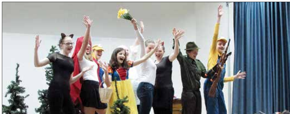
Junakom Rdeče kapice malo drugače so se pridružili poznani liki, z interakcijo in humorjem pa so igralci OŠ Blaža Arničiča Luče navdušili gledalce.