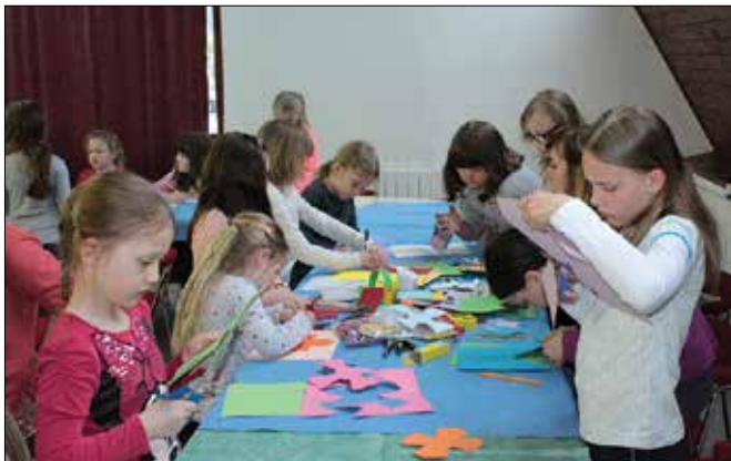
Otroške velikonočne delavnice so vsako leto bolj obiskane.