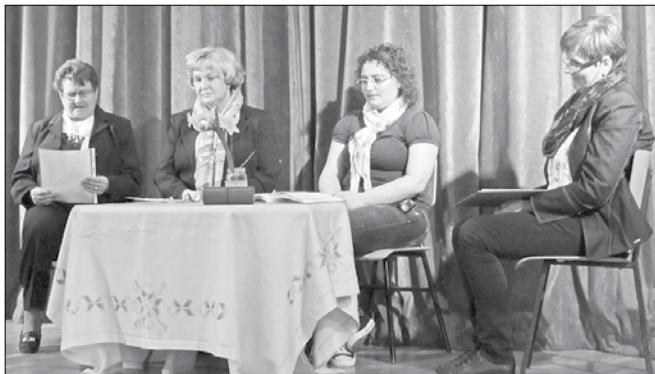
Članice društva so prisluh-nile poročilom o delovanju organizacije v preteklem letu in načrtom za tekoče.