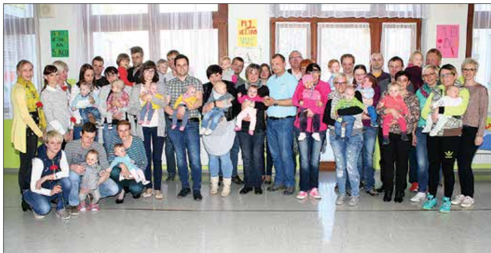
Sprejem za družine z novimi malčki je bil prisrčen dogodek