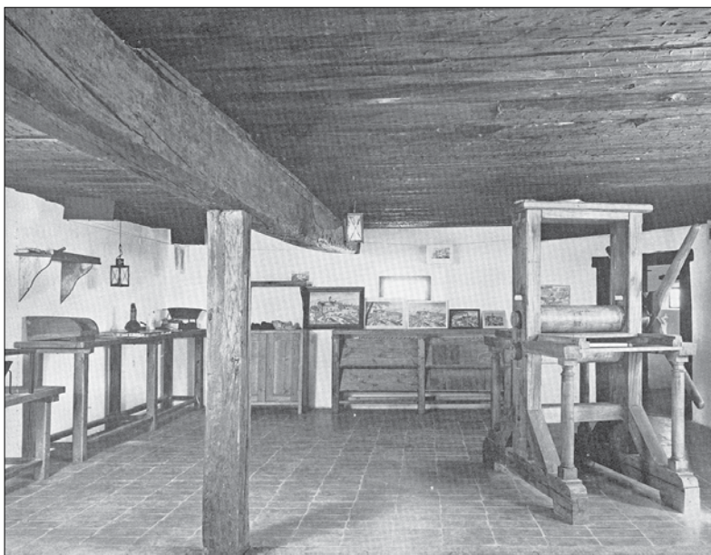
Rekonstrukcija Valvasorjeve grafične delavnice na Bogenšperku

Na koncu predstavitve Slave vojvodine Kranjske dodajamo v prevodu zadnji odstavek iz tega dela, ki je osebna izpoved in nazorna slika časa in razmer, v katerih je deloval in ustvarjal Janez Vajkard Valvasor: