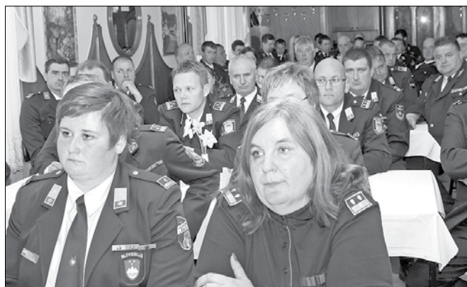
Zbrani so prisluhnili tudi poročilom o delu komisij, iz katerih so bile razvidne uspešno izvedene aktivnosti.