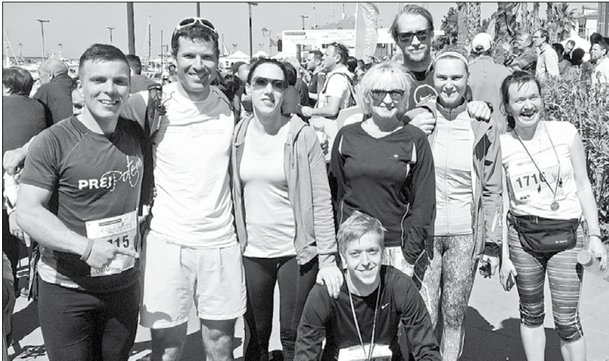
Savinjski tekači so bili po teku polni dobre volje in energije.