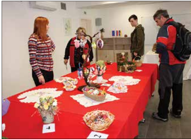
Razstavljene pirhe so ocenjevali obiskovalci.

Na ogled so bila unikatno pobarvana jajca oziroma aranžmaji trinajstih izdelovalcev, ki so naravna jajca ali umetne materiale okrasili s cvetnimi motivi, ornamentami, geometrijskimi liki ... Okraske so izdelovalci ustvarili s kraspanjem, kvačkano čipko, barvnimi trakovi in blagom, opaziti je bilo tudi servietno tehniko. Za barvanje pirhov so uporabljali naravne barve, kot so čebula, vino in različne zeli.