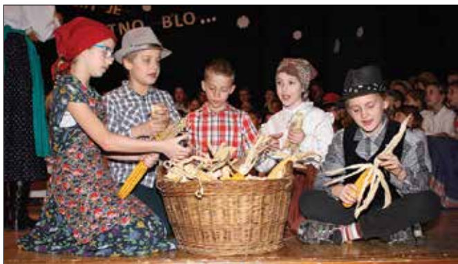
Ličkanje koruze je bilo v preteklosti ena od oblik družin vaščanov.