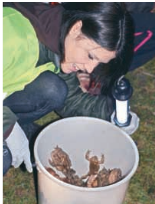
Prostovoljci bodo tudi v prihodnjih dneh v Hrašah dobrodošli.