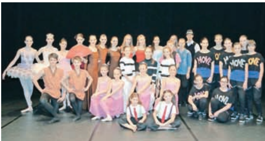
V Kranju so se plesalci pomerili na izbirnem tekmovanju za svetovni plesni pokal.