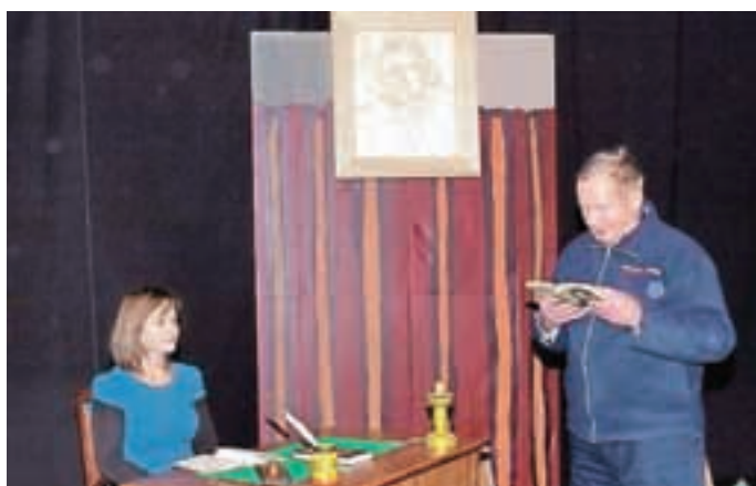
Kulturni praznik so v Pirničah zaznamovali z interpretacijo Prešernovih pesmi na odru tamkajšnjega kulturnega doma.