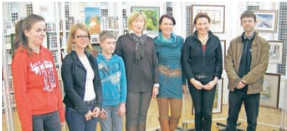
Ustvarjalci KUD Zbilje na razstavi v Medvodah

V medvoški knjižnici so se s pregledno razstavo predstavili člani likovne, grafične in študijske sekcije KUD Zbilje.