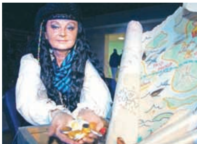
Skupina gusark je s seboj prinesla zemljevid, ki je vodil k zakladu – polni skrinji zlatnikov.