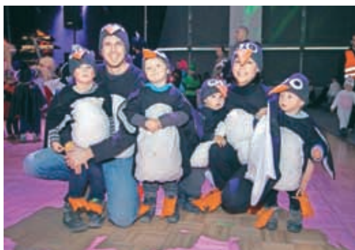
Z Antarktike v Medvode, nato pa brž nazaj! Pingvini.