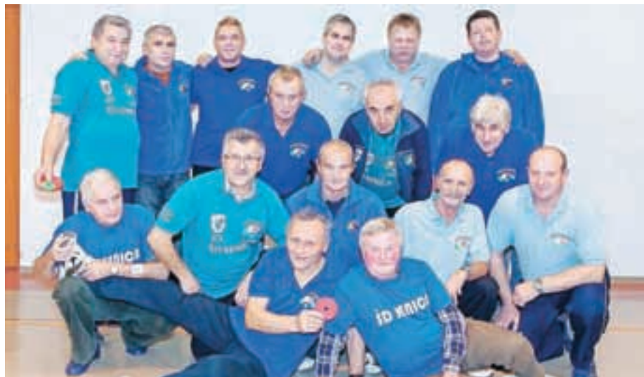
Prva in druga ekipa ŠD Senica v prstometu sta sezono 2013 končali na šestem in četrtem mestu v svoji ligi.

V ligaškem tekmovalju je največ gorenjskih ekip, tako da ligo igrajo od Jesenic do Ljubljane. Primorci vsako leto organizirajo pokalno tekmovalje, v ligi pa ne nastopajo, ker so prizorišča