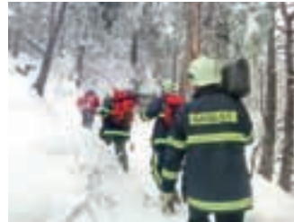
Pet gasilcev se je peš odpravilo do dveh starejših oseb na Šmarni gori, ki sta potrebovali agregat.