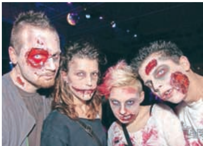
Živi mrtveci so pritegnili veliko zvedavih pogledov.