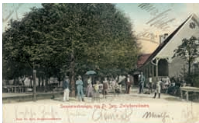
Središče Medvod konec 19. stoletja – Letovišče med vodami, celo s teniškim igriščem in visoko družbo