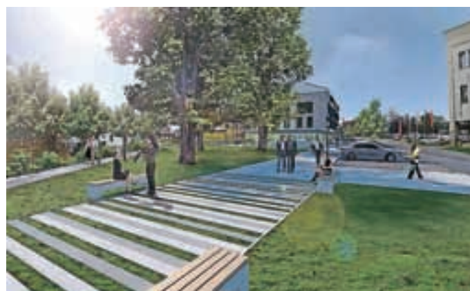
V bližnji prihodnosti bodo na tem mestu uredili mestno središče s parkom.