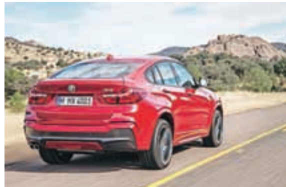
Miroslav Cvjetičanin X4, vsečna dopolnitev BMW-jeve ponudbe