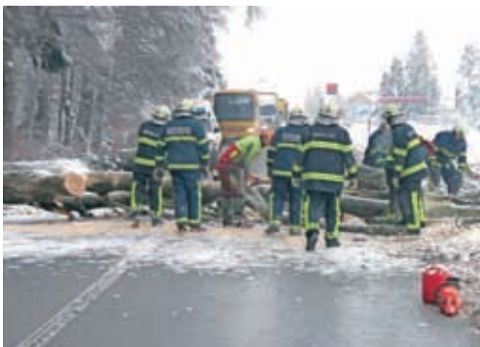
Podrto drevje je oviralo promet tudi na glavni cesti od Medvod proti Kranju.

V torek, 4. februarja, so dobili tudi obvestilo, da dve starejši osebi na Šmarni gori potrebujeta elektriko. »Iskali smo načine, kako bi prišli do njiju. V sredo se ja tako skupina petih gasilcev, opremljenih z žagami, peš odpravila do Sedla, da so jima dostavili agregat.« Do konca tedna so še večkrat posredovali, ker so se drevesa podirala in ogrožala imetje, a v manjšem obsegu kot v minulih dneh. »V soboto, 8. februarja, pa je bilo izdano povelje, da je gasilski del intervencije končan,« je sklenil Jarc. Mateja Rant, foto: arhiv GZ Medvode