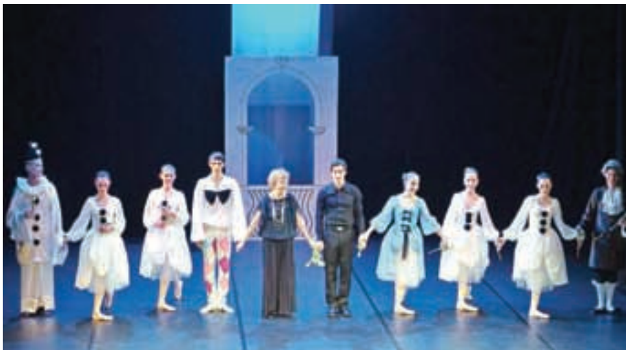
Harlekin na odru Prešernovega gledališča.