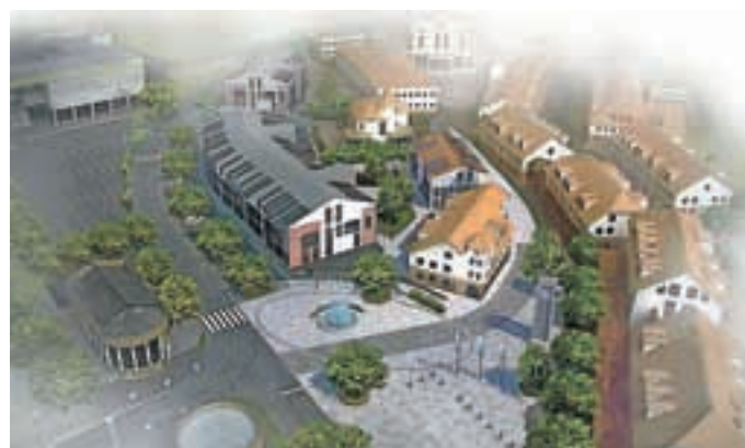
... bodo v prihodnje pred občinsko stavbo in knjižnico uredili mestno središče z vodnjakom in stolpom z uro.