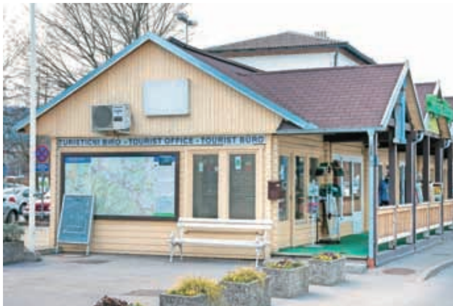
Tudi turistično informacijski center odslej sodi pod Zavod za šport in turizem Medvode.

»Glavno, kar smo si zastavili, je, da na področju turizma oblikujemo neko celostno podobo ter da vse, kar imamo, primerno zberemo na spletni strani medvode.info, ki bo namenjena dvema vrstama uporabnikov. Najpomembnejši bodo domači uporabniki, ki bodo lahko dobili vse informacije o Medvodah in dogajanju v občini, precej koristnih informacij pa bodo našli še obiskovalci iz drugih krajev iz Slovenije in tujine. Vse skupaj bomo torej najprej zbrali na enem mestu v elektronski obliki, v nasled-