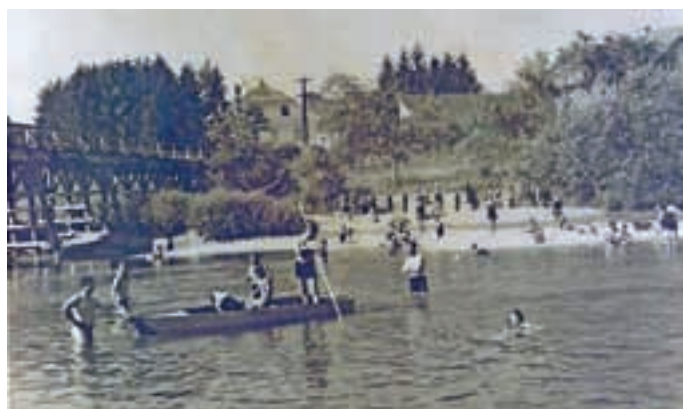
Na mestu, kjer so se ljudje pred 2. svetovno vojno (fotografija je iz leta 1938) še sončili in kopali v reki Sori ...