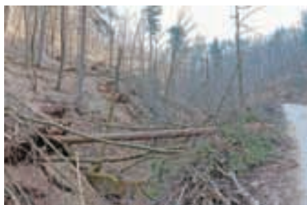
Na območju gozdnogospodarske enote Medvode je žledolom močnejše poškodoval kar dve tretjini revirja.

Po podatkih ljubljanske območne enote Zavoda za gozdove Slovenije je zaradi žledoloma na območju GGE Medvode po površini močnejše poškodovanih 1830 hektarov zasebnih in 137 hektarov državnih gozdov. Iglavcev, poškodovanih do te mere, da jih je potrebno posekati, je 15.300 kubičnih metrov, listavcev pa je za posek predvidenih 71.500 kubičnih metrov. Obnova gozda bo potrebna na okrog šestdesetih hektarih površin, površin, kjer bo potrebno izvesti gozdno higieno, kar pomeni pretežno pospravilo vrhov iglavcev, pa je okoli 100 hektarov.