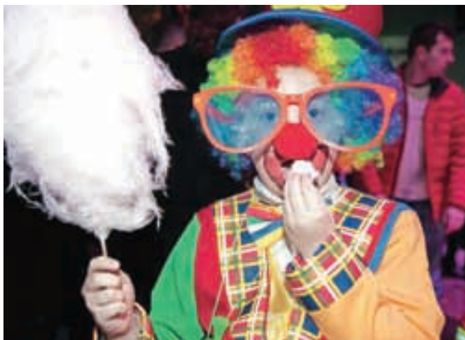
Sladkorna pena gre v slast tudi klovnom.