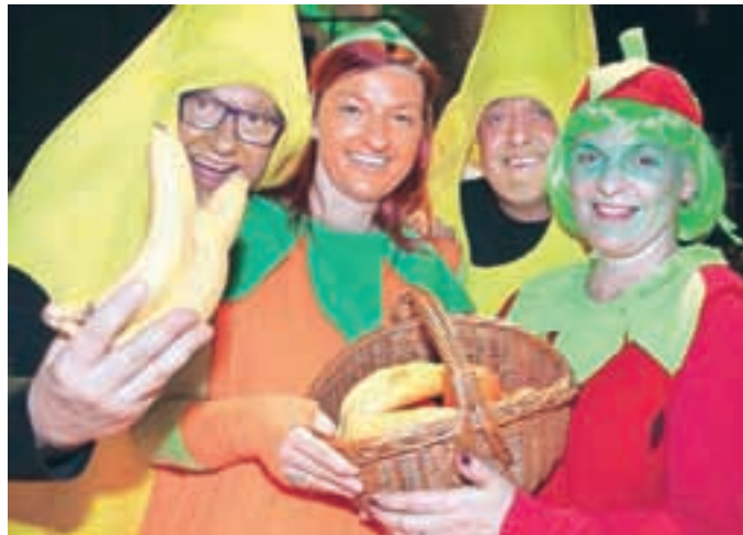
Dve banani, pomaranča in jagoda – sadna kupa