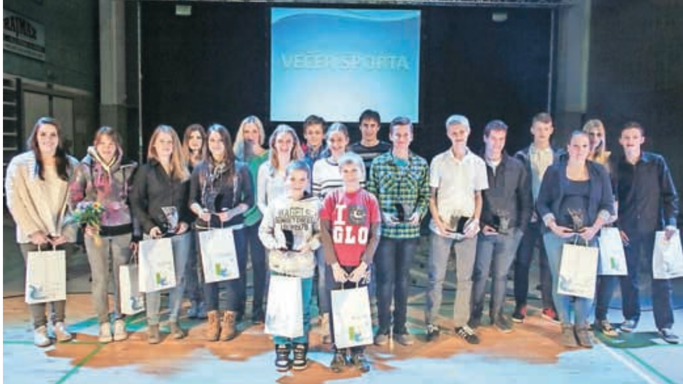
Najmlajši, najuspešnejši medvoški športniki