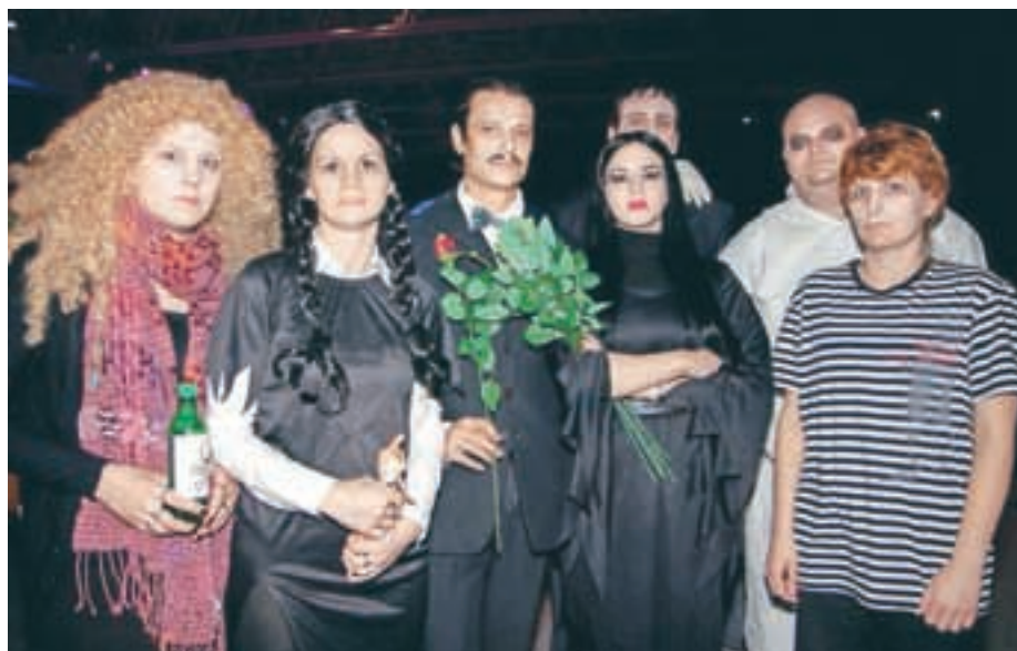
Adamsovi so bili najbolj čudna družina na pustovanju.