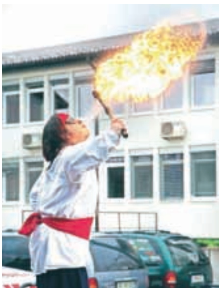
Gusar Lesena noga je pred športno dvorano bruhal ogenj in vabil otroke na pustovanje.