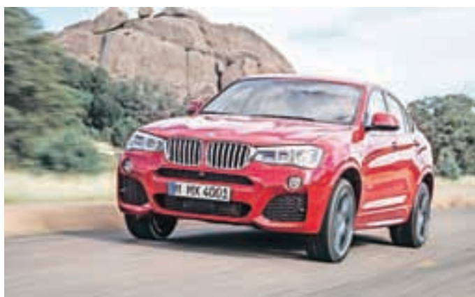
Prepoznavna štirica iz »X Drive dežele«