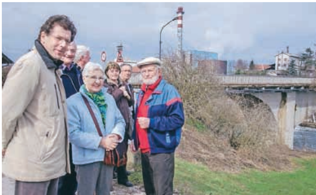
Kot zadnje v tem mandatu so občinski svetniki obiskali KS Vaše – Goričane.