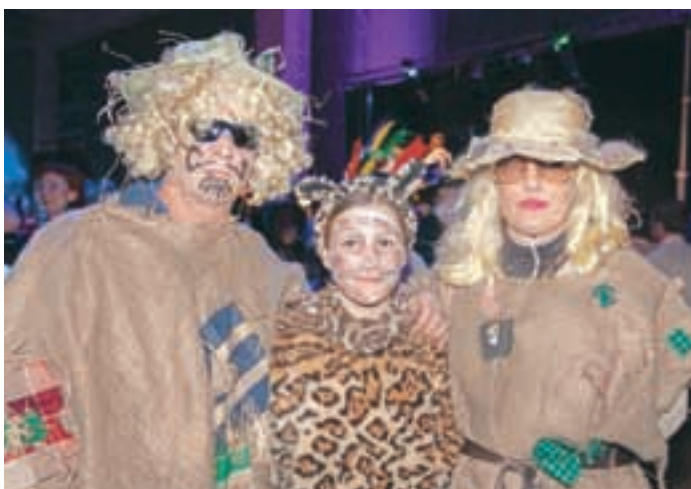
Risinja, ki je niso našli na ljubljanskem Rožniku, se je pojavila v Medvodah v spremstvu dveh strašil.