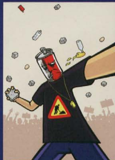
Naslovnica in ilustracija pri peticiji: Zoran Smiljanič

Katedra je sofinancirana s strani Študentskega sveta Univerze v Mariboru in Ministrstva za Kulturo RS.