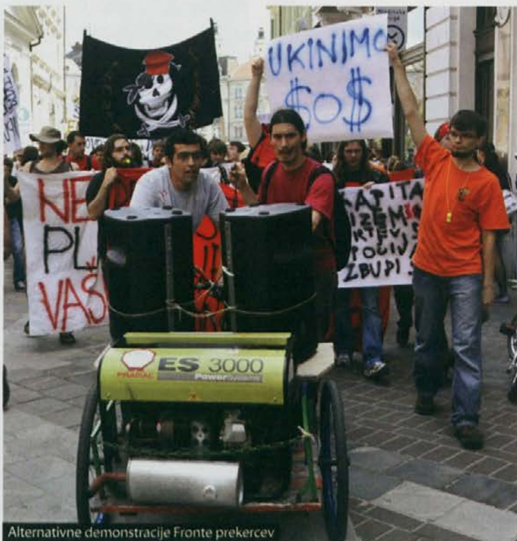
Alternativne demonstracije Fronte prekercev

Resnični problem pa morda ne leži v razbitih oknih ali izidu bitke med silami dobrega in zla, ampak v kolateralni škodi, ki jo bo utrpela slovenska demokracija. Znan je rek, da je v vsaki vojni prva žrtev resnica. Če bo šel razvoj po načrtani poti, bomo kmalu pričala permanentnemu izrednemu stanju in poleg strupenih puščic, podtikanja in laži z mačehovskim odnosom do resnice zabijamo žeblje v krste slovenskega novinarstva, ki je kot četrta veja oblasti predpogoj za delujočo demokracijo.