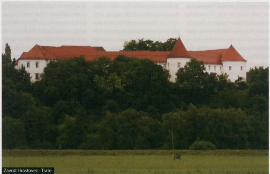
Zavod Hrastovec - Trate

Po podatkih organizatorjev Iz-hoda je Slovenija med najbolj institucionaliziranimi državami na svetu. Vsak stoti Slovenec naj bi bil interniran v kakšni ustanovi bolj ali manj zaprtega tipa. To pomeni, da je več kot 20 tisoč ljudi zaprtih v psihiatričnih bolnišnicah, splošnih in posebnih zavodih, zavodih za usposabljanje in drugih institucijah. »Število mest v institucijah raste, obseg skupnostne obravnave ostaja enak, preseljevanje ljudi iz institucij pa se je ustavilo. Projekt individualnega financiranja je naletel na kup težav in odporov. Psihatri se, vključno z varuhinjo človekovih pravic, upirajo zagovornikom, ki na sramežljiv način uvaja Zakon o duševnem zdravju, Zakona o dolgotrajni oskrbi in osebni asistenci čakata na uveljavitev že več let,« so do trenutne ureditve še kritični organizatorji Iz-hoda.