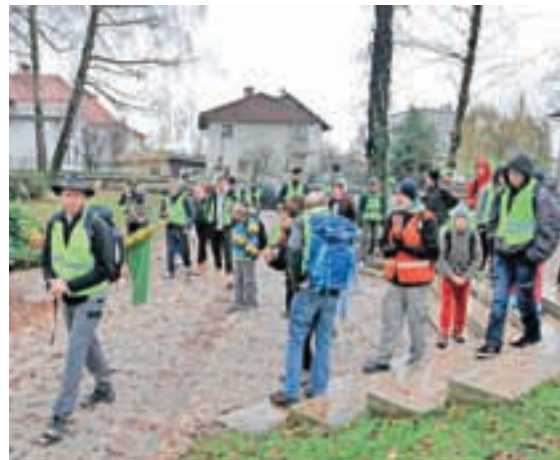
Pohodniki so se kot vedno ustavili v Prešernovem gaju ter na Prešernov grob položili cvetje in prižgali svečko.