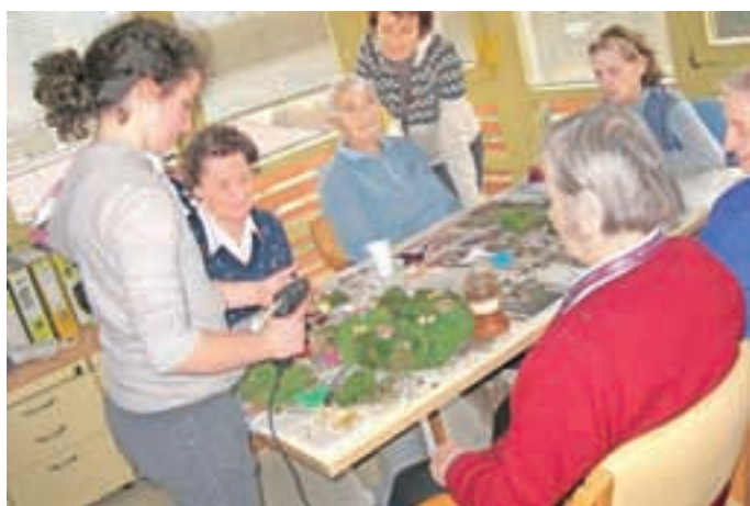
Izdelovanje adventnih venčkov v Centru starejših Medvode