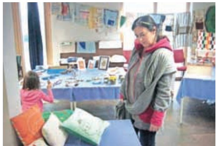
Okrasne blazine gredo dobro v promet.