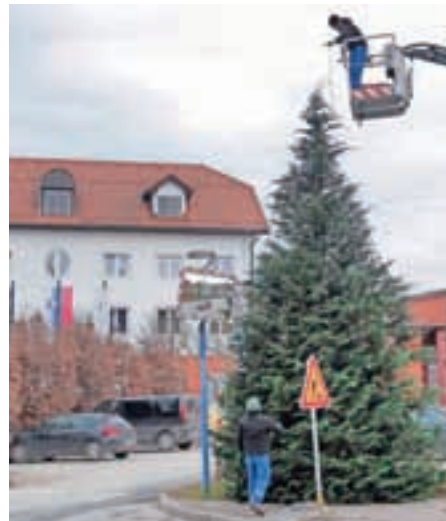
Smreke so tudi letos občini podarili domačini.

Medvode – Posebno pozornost pri praznični okrasitvi so letos namenili središču Medvod, torej okolici občinske stavbe in knjižnice. Tu bo namreč tudi središče pestrega decembrskega dogajanja, ki se bo začelo že danes s prižigom praznične razsvetljave in koncertom božičnih pesmi, s katerimi se bodo predstavili medvoški pevski zbori. Vse skupaj bodo pospremili s pošto želja, že prej pa bodo otroci na ustvarjalnih delavnicah v knjižnici napisali svoje pismo dedku Mrazu. Prireditve se bodo nato vrstile vse do 22. decembra.