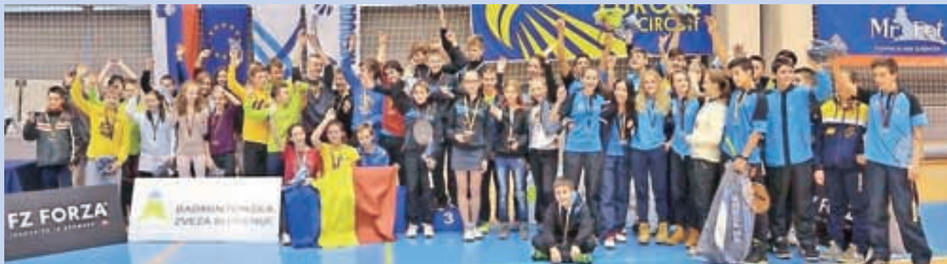
Zmagovalci 6. Forza cupa