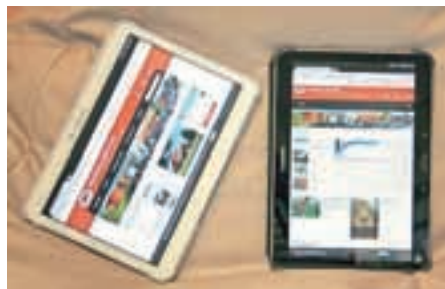
V knjižnici si je po novem mogoče izposoditi tudi dva tablična računalnika.