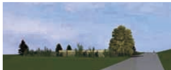
Zbirni center nenevarnih odpadkov na Jeprci bodo intenzivno ozelenili, da se bo čim bolj vklopil v okolico.