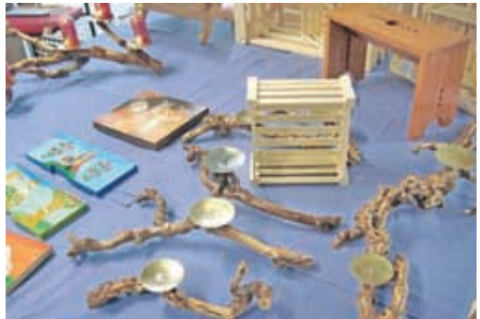
Zlasti zanimivi so bili svečniki iz vinske trte.

Zbilje – V delavnicah Barke so se tamkajšnji zaposleni ves november še zlasti trudili s svojimi izdelki. Konec novembra so jih namreč ponudili na Miklavževem sejmu, ki so ga pripravili kar v prostorih delavnic. Ogljedati in kupiti je bilo mogoče izdelke, ki so nastali pod rokami 18 delavcev v okupacijski, lesni in gozdarski delavnici. V kuharski delavnici pa so pripravili slane piškote za pogostitev na sejmu.