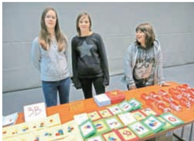
Miklavžev sejem v Osnovni šoli Medvode