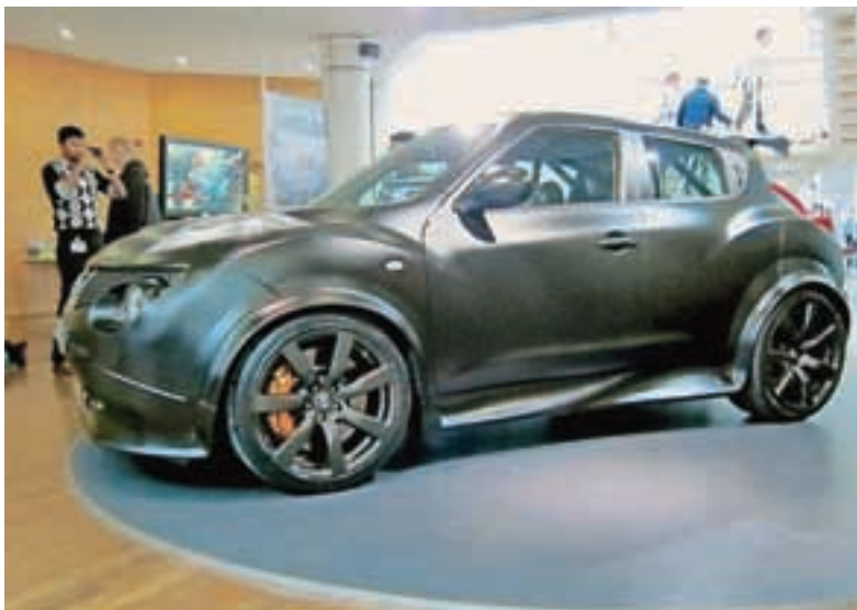
»Bomba« na kolesih!

Prenovljenega juka smo že spoznali. Na začetku smo zmajevali z glavo. Bili sta samo dve mnenji: vŕečen ali nevŕečen, srednje poti ni bilo. Uspeŕna nadaljevanka povsem drugačnega avtomobila se nadaljuje. Sprejeli smo ga celo tisti, ki ne živimo v velikih mestih. Preveč smo že povedali, zdaj veste, kaj vam predstavljamo tokrat. Tempirana bomba na