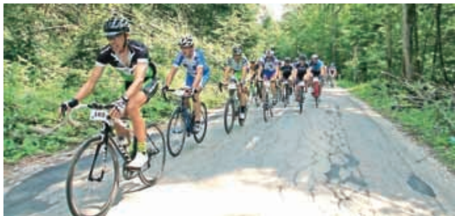
Vzpon na Katarino je ena najstarejših športnih prireditev v Medvodah.

Da pa zdaj dolgčas nam ne bo, spijmo eno kupico.