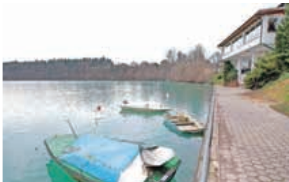
Na občini imajo pripravljen projekt ureditve pešpoti ob Zbiljskem jezeru, za katerega bodo poskušali dobiti tudi evropska sredstva.