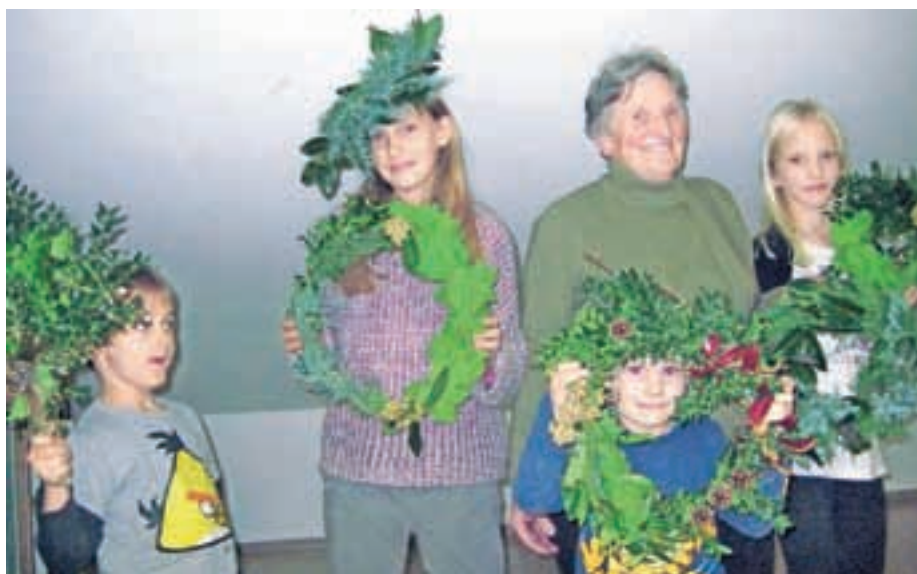
Na zadnji ustvarjalni delavnici v novembru so v Sori izdelovali unikatne adventne venčke.

Božični sejem vsako leto pripravijo po prireditvi, na kateri otroke obišče dedek Mraz. S košem daril se bo tudi letos skozi vas pred Dom