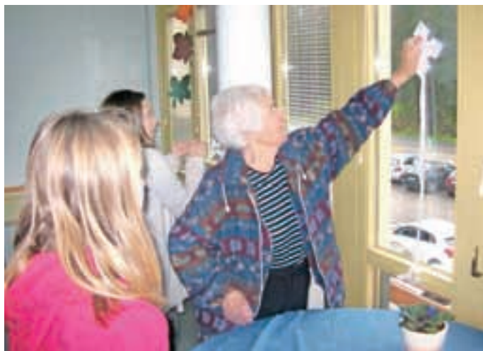
Učenci OŠ Preska so na novoletnih delavnicah izdelali novoletne okraske tako za šolo kot Center starejših Medvode.

V medvoških šolah so tako kot vsako leto konec novembra oziroma v začetku decembra pripravili praznične sejme, na katerih ponudijo izdelke, ki jih učenci izdelajo sami.