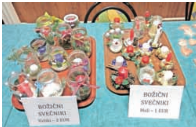
Izdelke z decembrskih delavnic na Senici vsako leto ponudijo na božičnem sejmu, ki bo tokrat prihodnje nedeljo.