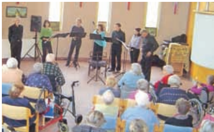
Sorarmonica so imeli oktobra celovečerni koncert pred polno kapelo Centra starejših Medvode.

Ansambel ustnih harmonik Sorarmonica bo v soboto, 27. decembra, ob 19.30 nastopil na Božično-novoletnem koncertu v Župnijski cerkvi sv. Marije Vnebovzete v Zgornjih Pirničah. V goste bodo povabili tudi dva odlična mlada glasbenika.