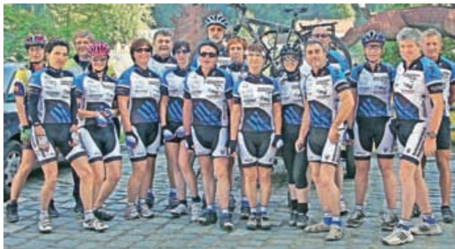
Člani Kolesarskega kluba Medvode se radi udeležujejo prireditev in izletov po Sloveniji in tujini.