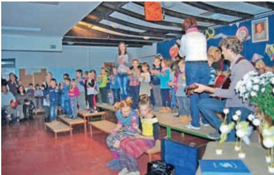
Bitenčeve pesmi so letos prepevali najmlajši.