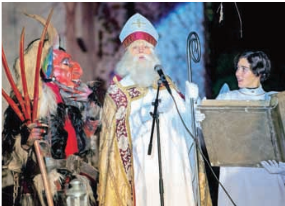
Miklavž v Sori

Dobri mož je tudi letos otroke obdaroval v noči s petega ne šesti december.