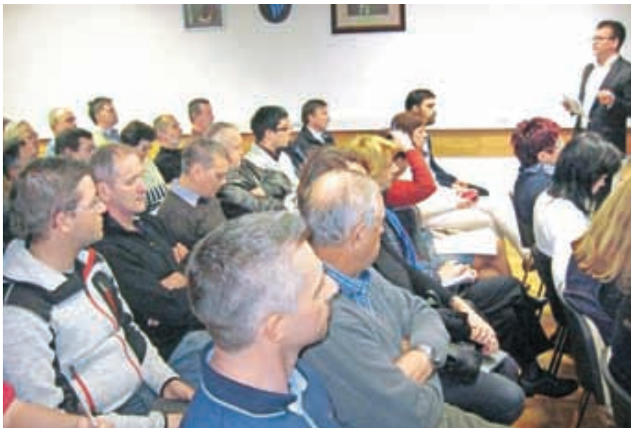
Torkovega srečanja z občinsko upravo se je udeležilo več kot sedemdeset članov svetov in tajnikov vaških in krajevni skupnosti.