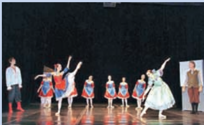
Prizor iz predstave Coppelia, ki jo bodo v nedeljo uprizorili v Prešernovem gledališču.