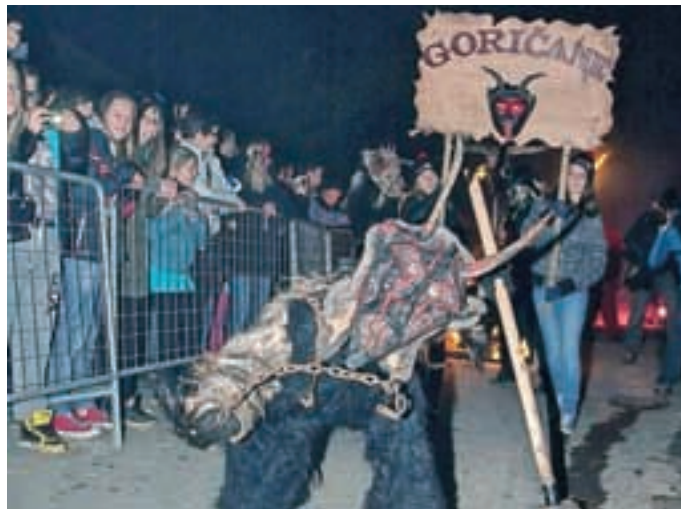
„Domači“ Goričanski parkeljni