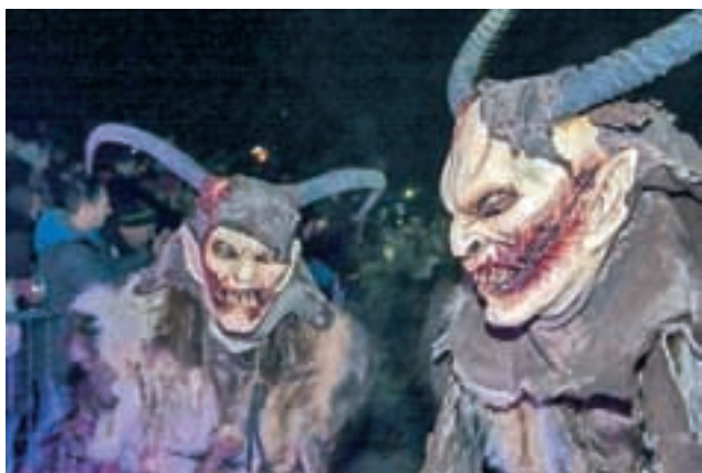
Grožljive maske si večina izdelava sama.