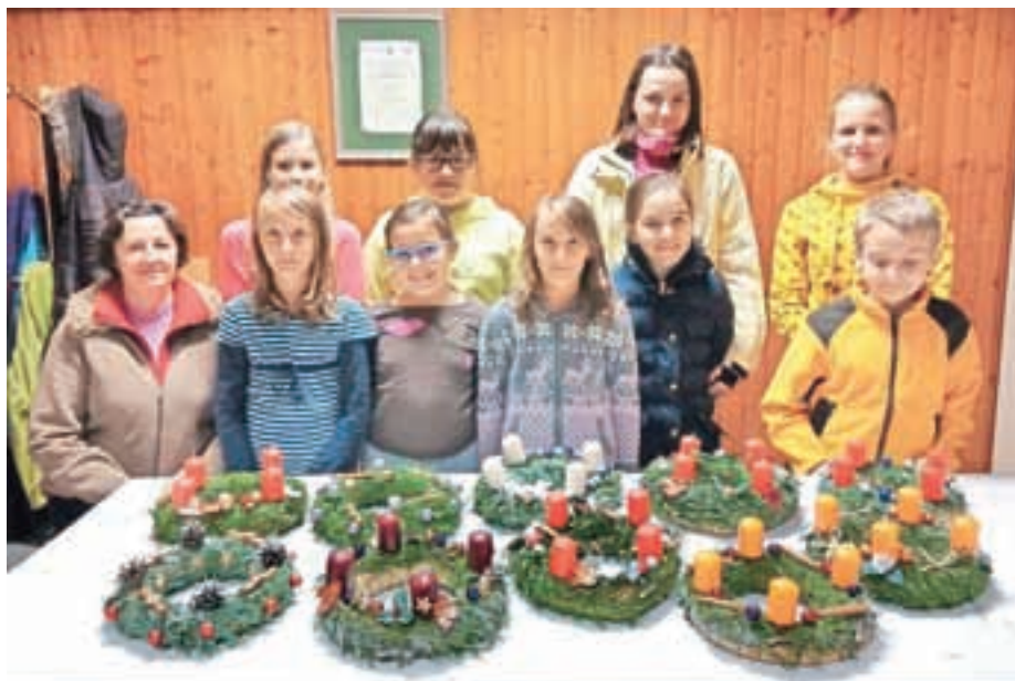
Adventne venčke so s ponosom pokazali tudi otroci, ki so se njihovega izdelovanja lotili v delavnicah na Senici.