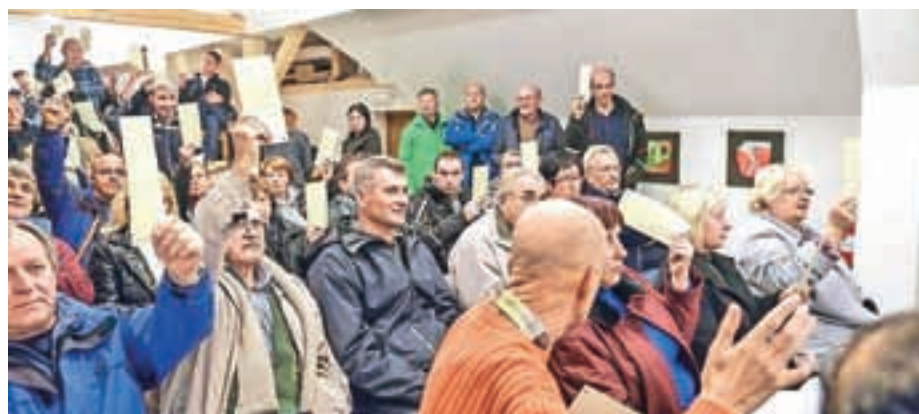
Na zboru krajanov v Zavrhu so opozorili na številne probleme, s katerimi se soočajo tamkajšnji prebivalci.