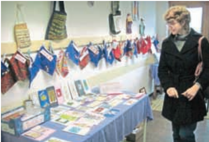
V delavnicah Barke so konec novembra pripravili Miklavžev sejem.

V delavnicah društva Barka v Zbiljah so drugo leto zapored pripravili Miklavžev sejem.