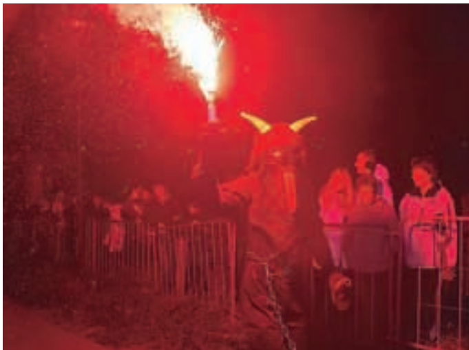
Dim in ogenj sta še dodatno prispevala k zlovesčemu vzdušju.

Slovenskim parkeljnom so se znova pridružili še parkeljni iz Avstrije, Italije in Hrvaške. Ob zvokih skupine Rammstein so razgrajali na poti skozi Goričane in se grozeče zaganjali v varovalne ograje,