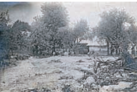
Posledice poplav leta 1924 v dolini Ločnice

Medvode – Ob poplavah, ki so oktobra prizadele Medvode, se je marsikdo spomnil tudi katastrofalnih poplav, ki so poleti leta 1924 opustošile dolino Ločnice. „V nekaj urah je padlo toliko dežja, da je Polhograjsko Grmado