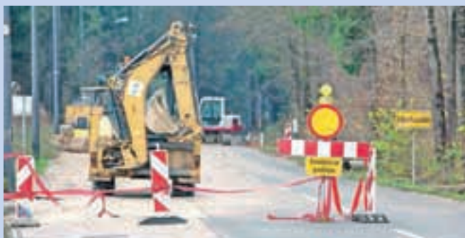
Na Zbiljski cesti so zaradi gradnje vodovoda in kanalizacije uvedli začasno prepoved prometa s popolno zaporo.

Medvode – Na Zbiljski cesti so konec novembra začeli graditi primarni vodovod v dolžini dobrih štiristo metrov in kanalizacijo za odpadne vode, sočasno bodo zgradili tudi plinovod, in sicer na trasi