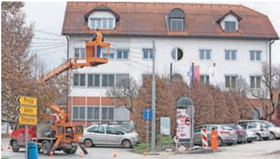
V središču Medvod so v minulih dneh napeljali praznično osvetljava, ki jo bodo prižgali danes.

Središče Medvod so v minulih dneh že odeli v praznično okrasje, ki bo zažarelo na današnjem prižigu luči. S tem bodo na simboličen način zaznamovali uvod v pestro decembrsko dogajanje.