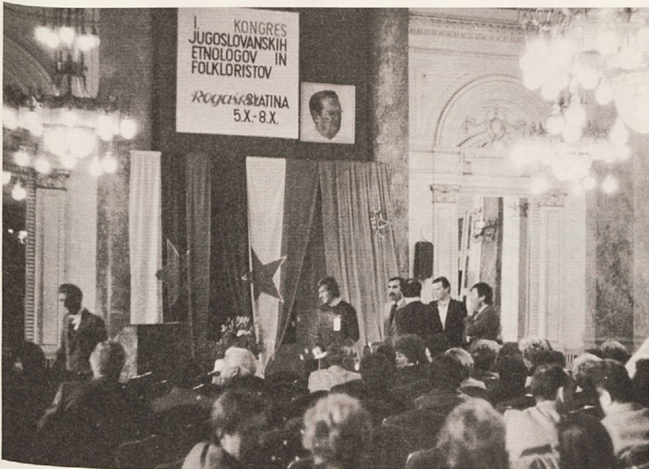
Zares zgodovinski trenutek! Pred slovesnim pričetkom prvega (mogoče tudi zadnjega) skupnega kongresa jugoslovanskih etnologov in folkloristov, Rogaška Slatina 5. — 8. 10. 1983.