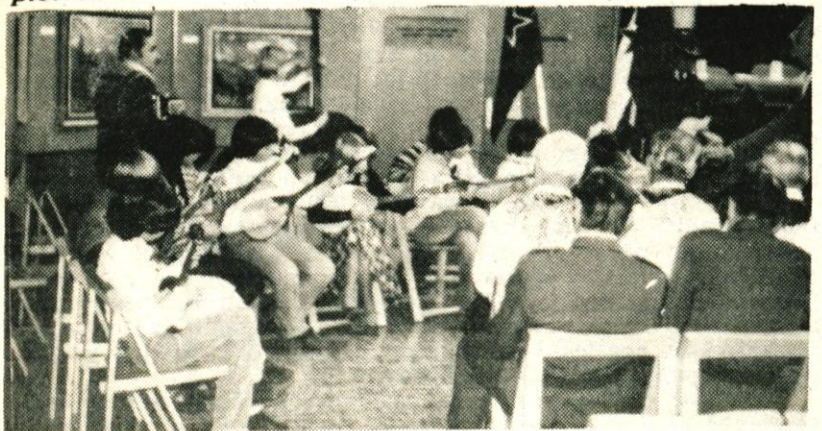
BOHINJSKA BISTRICA - Že vrsto let v Bistrici deluje tamburaški orkester, ki deluje v okviru šole dr. Janeza Mencingerja, sodi pa v okvir DPD Svoboda Tomaž Godec. Poleg številnih nastopov v bohinjškem kotu so igrali letos na srečanju planincev treh dežel v Bazovici, v Lescah, v Radovljici in drugod. Za svoje uspešno delo so lani prejeli posebno priznanje Zveze kulturnih organizacij Radovljica.