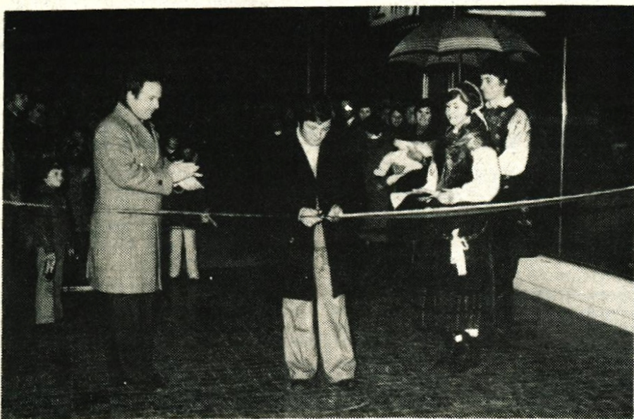
Poslovni in trgovski center Deteljica je odprl delavec SGP Tržič

Krajevna skupnost Stara Fužina, v katero sodi še naselje Studor, sodi med turistično zelo zanimive bohinjske krajevne skupnosti z lepo in privlačno okolico ter s planšarskim muzejem in drugimi kulturnimi zanimivostmi. Sami krajani so zadnja leta z veliko delovno vnemo in prizadevnostjo razrešili marsikateri krajevni komunalni problem, vendar pa so si vedno želeli vsaj nekaj prostorov, kjer bi se lahko shajali in organizirali prireditve ter končno preselelili vaško knjižnico, ki je zdaj že nekaj časa zaprta. Zdaj pa bodo ob sodelovanju in pomoči občinskih samoupravnih interesnih skupnosti zgradili objekt, kjer bodo našle svoj prostor družbenopolitične organizacije krajevne skupnosti, društva, knjižnica ter vrtec. Družbeni center pa bo pomembna pridobitev tudi za razvoj turizma v tej krajevni skupnosti, ki ima največ zasebnih turističnih sob. D.S.