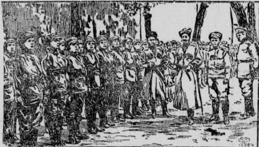
Ruski ženski bataljon.

Ogrožena italijanska armada na Krasu. Dočim se je bila ob severni Soči silna bitka, je bilo na Krasu precej mirno. Ko so se pripeljali prvi ranjenci s Krasa v Ljubljano, niso hoteli verjeti, da so Italijani poraženi ob Soči! Le na Fajtovem hribu so naši možnarji in metalci min razbili italijansko postojanko, ki so jo potem Ogrji zasedli, da so naši laglje napadali Sveto Goro in Gorico, na Krasu so pa naši mirno čakali, kdaj jo bodo Italijani popihali, ali pa če se bodo morda dali ujeti. Njih hrbet že ogrožajo naše čete, ki so pri Gorici udrele čez Sočo, zasedle 115 m visoki grič Fortin ob Soči, s katerega sedaj lahko obstreljujejo vso ravnino Gradiške in vse ceste, po katerih se mora umikati italijanska armada na Krasu. Obenem prodirajo naše čete tudi ob morju, zasedle so že Tržič in tamošnje razdejane ladjedelnice. Italijani so se zato morali umakniti na Doberdobsko planoto — in od tu morajo nastopiti trnjevo pot umikanja čez Sočo v ognju naših topov. Velika nevarnost preti sedaj onim italijanskim baterijam ob izlivu Soče. Tu so namreč Italijani vzdali veliko množino najtežjih ladijskih topov, s katerimi so obstreljevali Trst in naše postojanke na Krasu ter prizadejali s tem naši armadi mnogo preglavic. Da bi mogli take topove odvesti, za to bi morali imeti