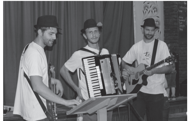
Ansambl bratov Nemanič

Lahko smo zelo ponosni, da so mladi iz naše skupnosti sprejeli iniciativo za organizacijo te nove dejavnosti, ki je tako blizu občutkov Mendoščanov in Slovencev. Bog