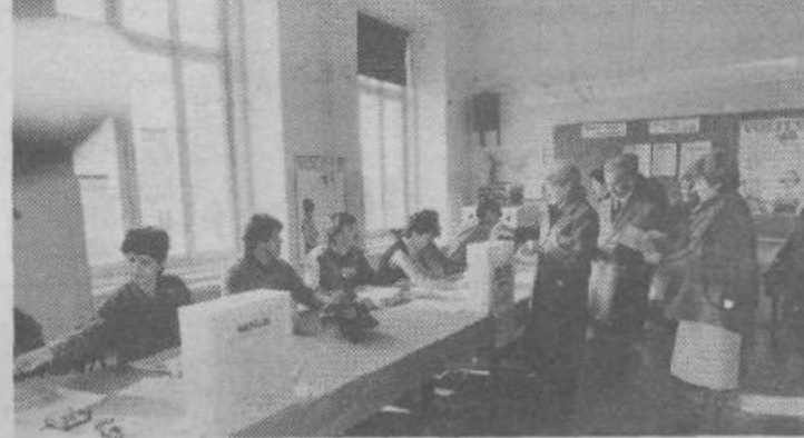
Prostorne in svetle učilnice naših šol so se 16. marca v velikih primerih spremenile v najbolj urejena volišča