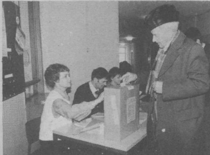
Starejši občani so po večini volili že v jutranjih in zgodnjih dopoldanskih urah. Ravnali so se po življenjskem vodilu, da če že nekaj name-ravaš, to čimprej opravíš