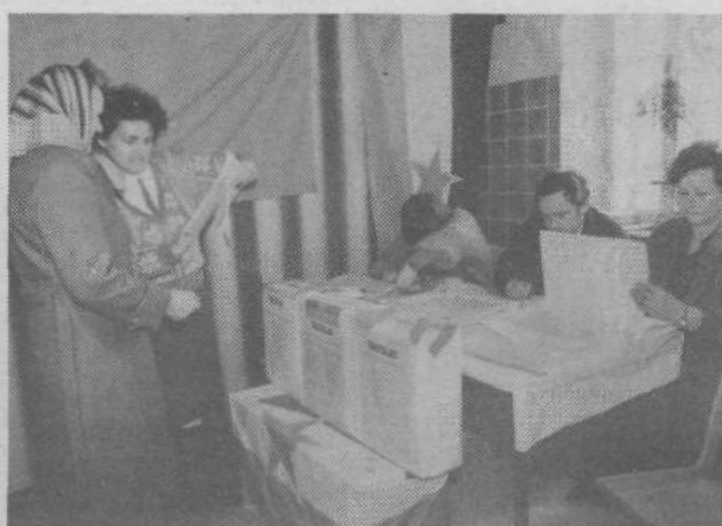
Zaradi obsežnega delegatskega sistema je tudi glasovalni postopek tak in zahteva kar dobra pojasnila, da ne pride do nenamernih napak