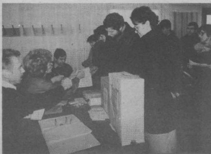
Delovni ljudje so volili v četrtek, 13. marca. Posnetek je z volišča v prostorih obrtnega združenja, kjer so volili vsi obrtniki in pri njih zaposleni delavci. Upoštevanje specifičnosti dela (po vsej Jugoslaviji) je bila 71% udeležba velik uspeh

V 25 letih je podjetje doseglo nesluten razvoj. V njem združuje delo 2530 delavcev, na območju 14 občin ljubljanske regije in Cerknice, ki ga pokriva podjetje, pa imajo 96 pošt. Kapaciteta avtomatskih telefonskih central znaša 135.800 telefonskih priključkov, v promet pa jih imajo vključenih 108.500, s čimer so dosegli gostoto 21 telefonov na 100 prebivalcev. Javnih telefonskih govornic imajo že 576. Kapaciteta končnih telegrafskih central pa znaša 1000 priključkov. Z okrog 800 teleks naročniki je dosežena gostota 16 teleks naročnikov na 10.000 prebivalcev. V zadnjih letih so v razvoju slavili več pomembnih jubilejev, od katerih sta prelomna vključitev 100.000 telefonskega naročnika in ukinitve zadnje ročne telefonske centrale.