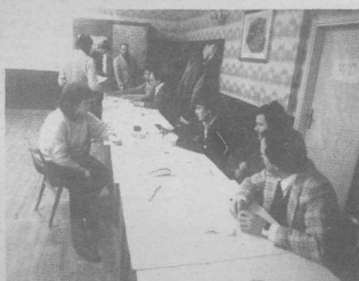
V zadnjih urah so številna volišča postala prazna, na člane odborov in komisij pa je že legla utrujenost. Kako da ne, dan je bil odgovoren in naporen. Hvala jim