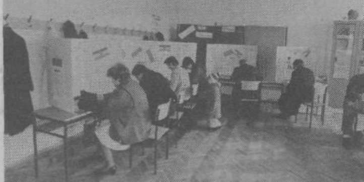
Za tajnost volitve je bilo na vseh voliščih primerno poskrbljeno. Seveda pa je bilo to v velikih prostorih lažje zagotoviti kot v majhnih, saj vemo, kako številni so in koliko prostora zavzamejo že volilni odbori