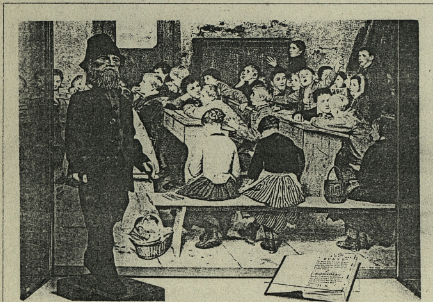
Vaški učitelj v 19. stoletju

Glede na službo so učitelji začasni ali stalni. Začasni učitelj je lahko tisti, ki je končal državno učiteljsko. Za stalnega pa se potrdi začasni učitelj, ki je opravil praktični učiteljski izpit. Izpit lahko dela po dveh letih, enako velja za zabavilje (vzgojiteljice). V osnovni šoli smejo poučevati učitelji in učiteljice ne glede na spol učencev.