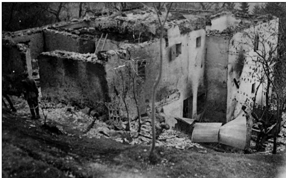
Pogorela hiša pri Lajbonu.