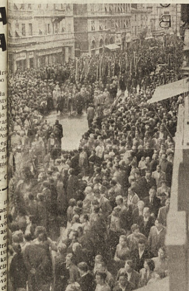
vrste žalnega spreveda vikorakajo na Garibaldijev trg.