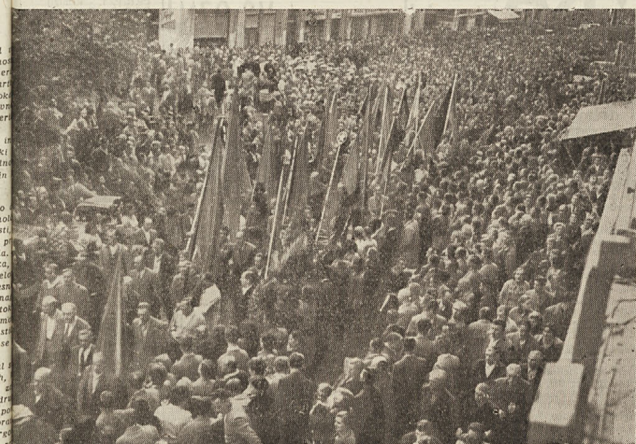
Stotine demokratičnih Slovencev in Italijanov iz mesta in podeželja so se udeležili veličastnega pogreba ljubljenih tovarišev Uršiča in Bolčine.