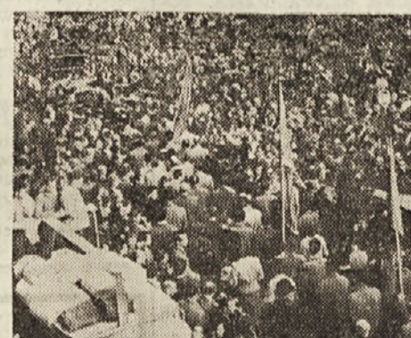
Zadnji pozdrav množice na trgu Garibaldi