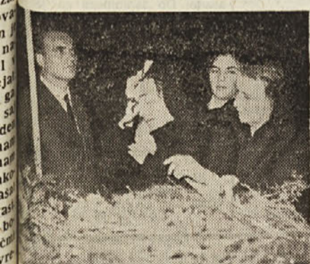
Neutolajljiva bolelost pred krsto dragega Franca

Večna slava tovarišema Avreliju in Bolčini!