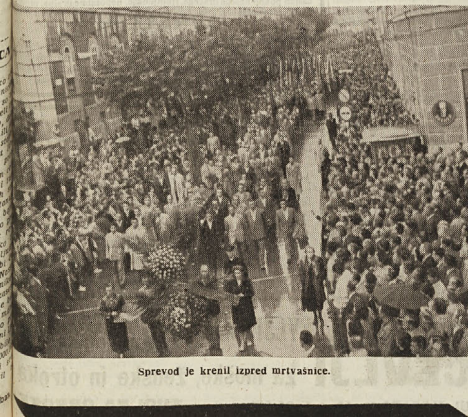
Spreved je krenil izpred mrtvašnice.