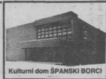
Kulturni dom ŠPANSKI BORCI

Zveza kulturnih organizacij Ljubljana Moste-Polje je 13. novembra priredila v kulturnem domu Španski borci koncert Koroškega akademskega okteta.