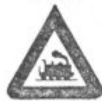
Nezavar. žel. prehod