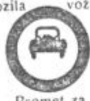
Promet za avtomobile prepovedan