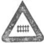
Zavarovan žel. prehod