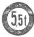
Prepovedano za težo nad 5 1/2 tone