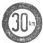
Maksimalna dovoljena brzina