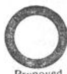
Prepoved za vsa vozila