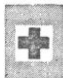
Znak za bližnjo pomoč postajo