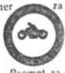
Promet za motocikle prepovedan