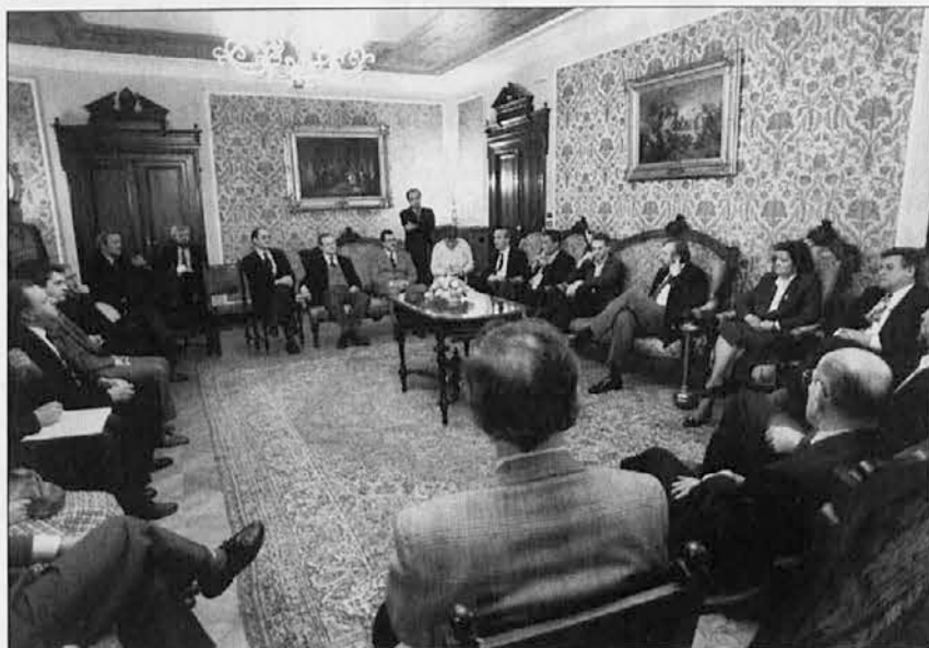
Župana Illy in Rupel sta se srečala tudi s predstavniki slovenske manjšine

Ruplov obisk se je po srečnem naključju ujema z odprtjem razstave o slovenski ustvarjalnosti v Trstu, ki je bila prav tako v soboto, 18. marca, v občinski dvorani palače