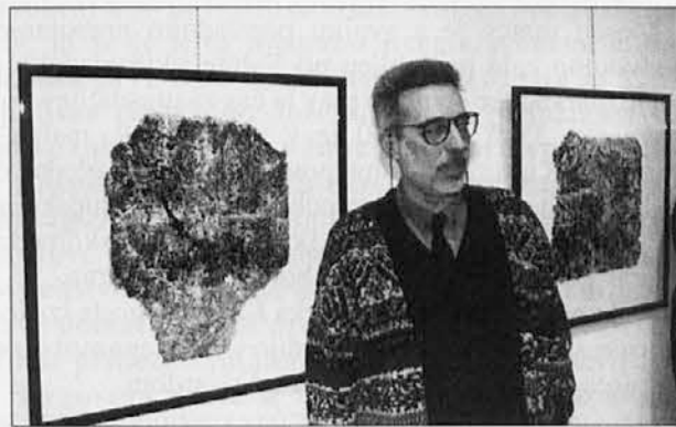
Umetnik ob svojih slikah